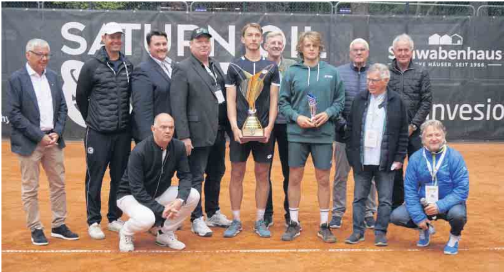
Veranstalter, Organisatoren, Publikum und Tennis-Profis freuen sich auf die 2. Auflage der Saturn Oil Open.

ATP Tennis an Rhein & Sieg zu Gast beim TC RW-Troisdorf e.V. 28. Mai bis 4. Juni