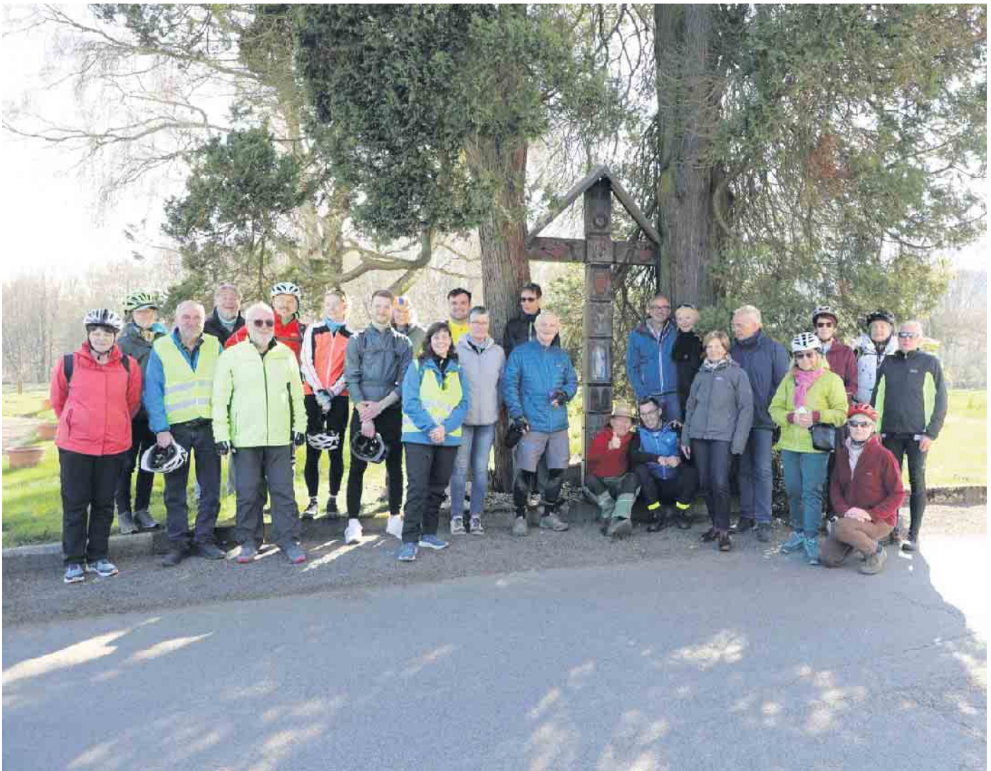
Gruppe mit 25 Radlern aus unterschiedlichen Regionen

Den Leidensweg Jesu in besonderer Art er-fahrbar