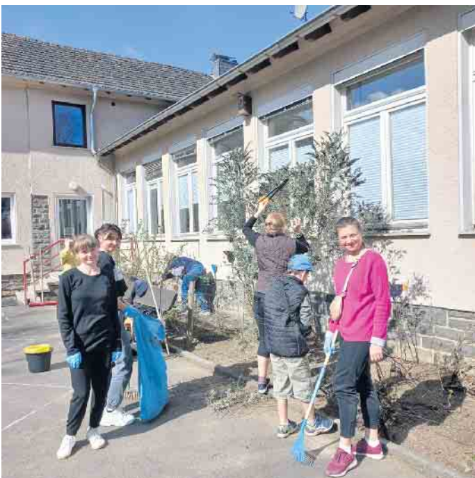
Reinigen der Beetanlagen