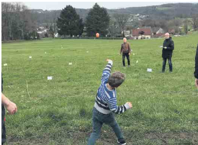
Eierwerfen für jedes Alter

Auch in diesem Jahr findet am Ostermontag, das traditionsreiche Eierwerfen statt. Beginn ist um 14 Uhr auf der Wiese an der Steinkuhle. Teilnehmer kann jeder, egal ob Jung oder Alt. Neben Preisen für die besten