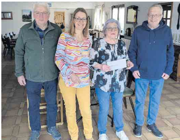
Spendenübergabe der Kleiderstube an die Angeljugend.