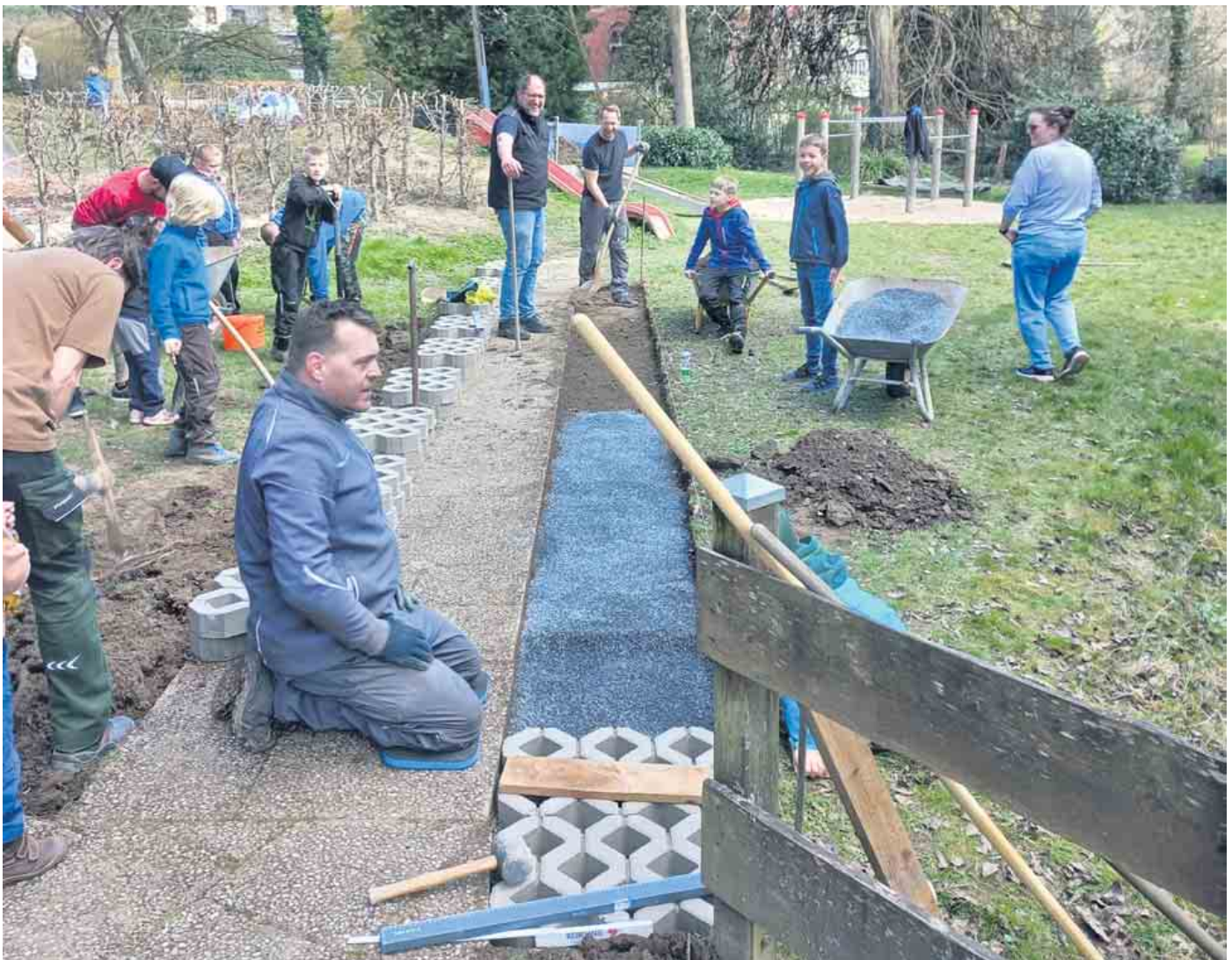
Legen von Rasengittersteinen

Verein der Freunde und Förderer der Grundschule am Klostergarten e.V.