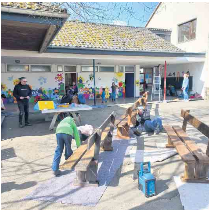
Streichen der Bänke, Türen und Geländer