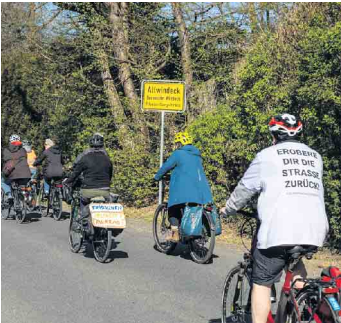
Die Fahrraddemo in Altwindeck

Natürlich wurde auch darauf hingewiesen, dass es zwar einerseits mehr und bessere Radwege geben muss, andererseits aber wir alle auch durch unsere Sichtbarkeit als Radfahrende im Alltagsverkehr diese Forderung untermauern müssen. (dieter.zerbin@adfc-bonn.de)