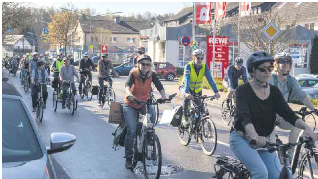
„Wo ist unser Radweg?“ in Rosbach.

Und so machte sich dann ein eindrucksvoller Zug von Fahrradfreund*innen aller Altersklassen