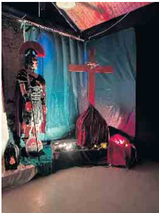
Szene am Kreuz