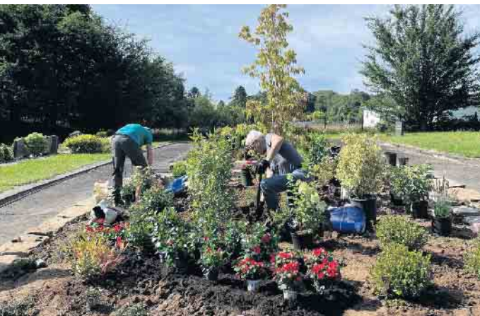
Der Urnengarten - Erstbepflanzung 2024

An alle Mitglieder und Interessierte, nächster Arbeitseinsatz ist am Samstag, 5. April, um 9 Uhr, auf unserem Friedhof im Siegbogen. Wir möchten an diesem Tag vorrangig den im vergangenen Jahr angelegten „Urnengarten“ mit