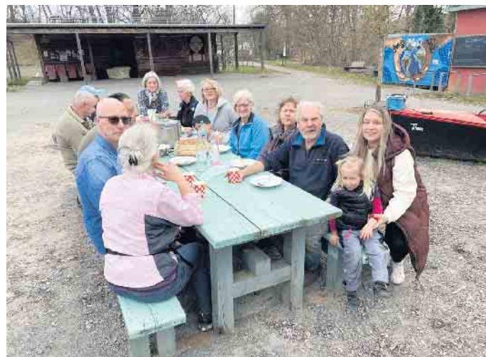
Abschluss der Müllsammelaktion in Schladern

Letzten Samstag, 22. März, trafen wir uns bei schönstem Frühlingswetter zum Müllsammeln in Schladern am Bahnhof. Schnell waren die einzelnen Routen verteilt und los ging es in kleinen Gruppen, bewaffnet mit blauen Müllsäcken.