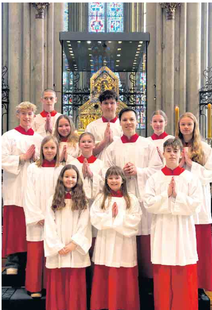
Rosbacher Minis im Kölner Dom