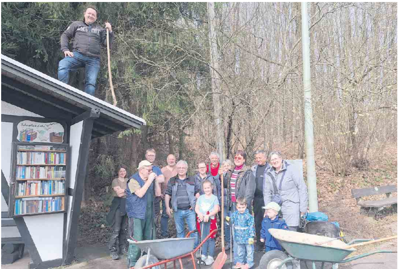
Große und kleine fleißige HelferInnen bei der Müllsammelaktion in Lindenpütz.

„Gemeinsam für ein sauberes Lindenpütz!“ - ein Motto, das auch in Zukunft das Dorfleben prägen wird.