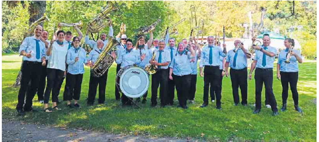
Die Windecker-Musik-Vereinigung in Feierlaune.