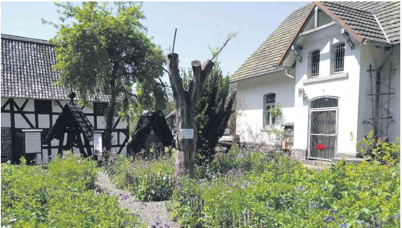
Museumsgarten im Mai.

Die Lokale Agenda Windeck Arbeitsgruppe (AG) Naturnaher Garten veranstaltet am Samstag, 4. Mai, den beliebten Garten- und Pflanzenflohmarkt für alle HobbygärtnerInnen.