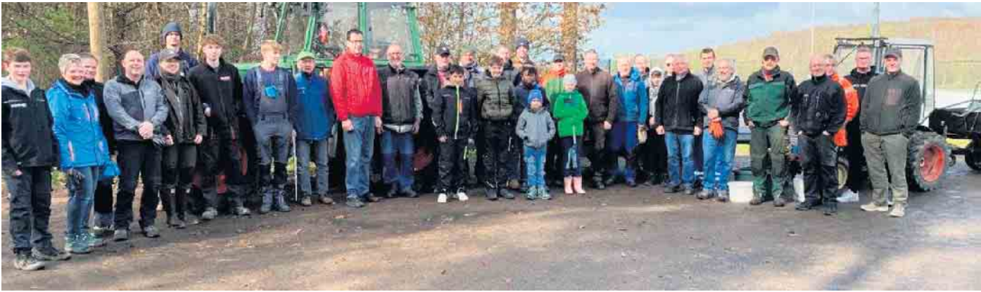
Die fleißigen Helfer von Pracht