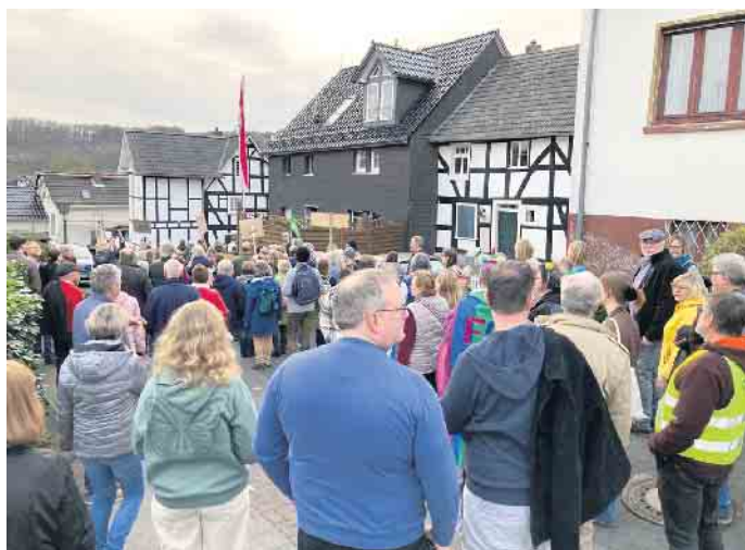
Der Demonstrationzug führte über die Rathausstr., Mittelstr., Hangstr., zur Gedenkstätte für die Landjuden an der Sieg in der Bergstr. 9 und über die Alte Dorfstr. zurück zum Kundgebungsplatz