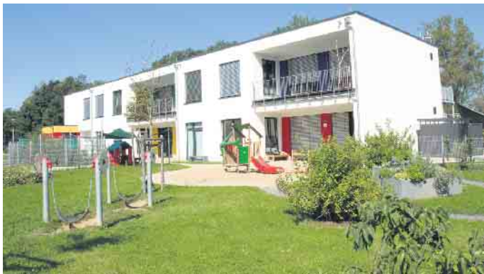
Familienzentrum Sonnenberg.

Die Familienzentren der Gemeinde Windeck laden in Kooperation mit dem Breitensportverein TV Rosbach 1965 e.V. zu einem zweiwöchigen Elternkurs rund um das Thema Psychomotorik und Bewegungsförderung ein. Erinnern Sie sich noch an Ihre „bewegte“ Kindheit? Wir helfen Ihnen gerne „auf die Sprünge“. Lassen Sie sich nochmals in Ihre eigene Kindheit mit all den Bewegungserfahrungen zurückversetzen und lernen Sie hierbei Ihren Körper von einer ganz neuen Seite kennen! Ziel dieser Kursreihe ist es, Ihnen den Ansatz der Psychomotorik durch das aktive „Selbsterleben & Selbst erfahren“ näher zu bringen und Sie an die Hand zunehmen auf dem Weg der Bewegungsförderung Ihrer Kinder. Die beste Bewegungsförderung beginnt nämlich mit einer kindgerechten Bewegungszeit in unserem Alltag! Der Dozent Lukas Niederhausen, Psychomotorik Trainer und Sozialpädagoge, arbeitet bereits seit vielen Jahren mit Kindern und Jugendlichen im Bewegungssektor und freut sich auf einen ereignisreichen Kurs! Teil 1 des Kurses findet am Montag, 15. April, von 18.30 bis 20.30 Uhr und Teil 2 am Montag, 22. April, von 18.30 bis 20.30 Uhr statt. Wir freuen uns Sie in der Turnhalle Rosbach der Gesamtschule am Standort Rosbach begrüßen zu dürfen.