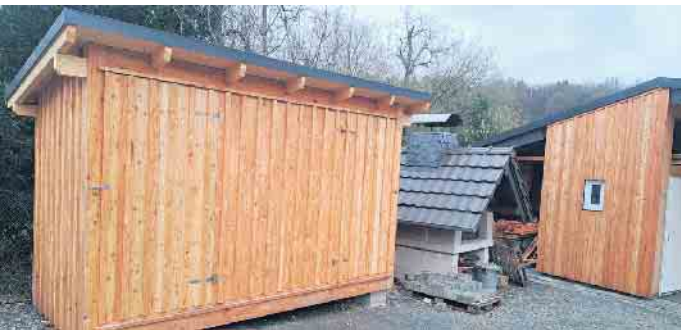
Der neue Lagerraum am Dreiseler Spielplatz

Der Frühling naht und bald werden die Kinder wieder mehr draußen spielen und herumtoben. Der neu gestaltete Dreiseler Spielplatz mit tollen neuen Spiel- und Klettergeräten dürfte nach der offiziellen Einweihung im letzten Herbst erst in den kommenden Wochen erstmals „richtig“ von den Kindern in Besitz genommen werden. Dabei gibt es dort nicht nur nagelneue Geräte, sondern seit Neuestem auch eine neu gestaltete Umgebung mit einem großen Geräteraum und einer weiteren kleineren Lagerhalle, beides sehr ansprechend gestaltet. Ermöglicht wurden die Umbauten neben - wie üblich - zahlreichen ehrenamtlichen Arbeits-einsätzen auch durch eine großzügige öffentliche Förderung durch die LAG Region Bergisch-Sieg e.V. unter der Federführung und Beratung durch Herrn Florian Grünhäuser. Jung und Alt in Dreisel und auswärtige Gäste freuen sich über einen nun noch schöneren Treffpunkt zum Spielen, Klönen, Feiern - kurzum für ein gutes dörfliches Miteinander.