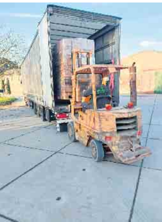
Verladung der vollen Kartonnagen Richtung Ukraine

Sammlung des Wachses biegt auf die Zielgerade