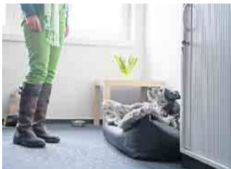
Kollege auf vier Pfoten: Hunde im Büro werden von vielen Unternehmen akzeptiert. Wichtig sind jedoch klare Regeln.

und verschiedene Hunde aufeinandertreffen. Dazu zählen Aspekte wie Gesundheit, Sozialverträglichkeit und Grundgehorsam. Engelhardt hält dazu, unter anderem bei „Das Futterhaus“, Bürohundeproofungen ab. Bei seiner Arbeit achtet der Hundetrainer vor allem auf die Bindung zwischen Mensch und Tier. Der Hund soll aufmerksam bei seinem Menschen sein und Grundkommandos wie „Sitz“, „Bleib“, „Platz“ und