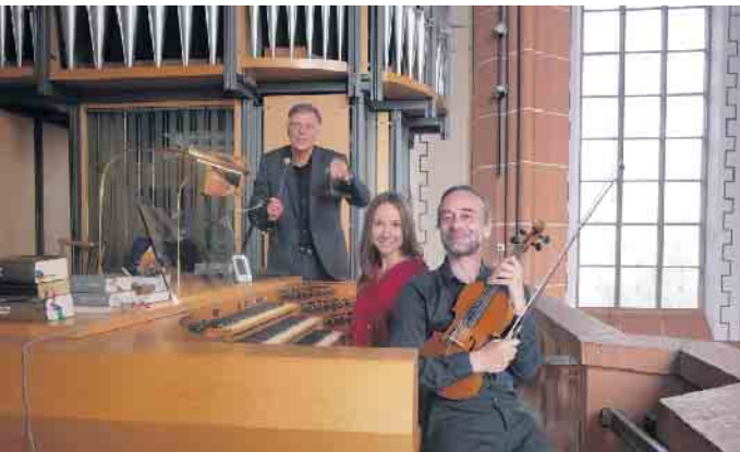
trio contemporaneo.

Trio Contemporaneo spielt geistliche Werke von Bach, Liszt und eigene Werke