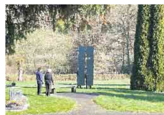
Standortauswahl für das neue Metallkreuz