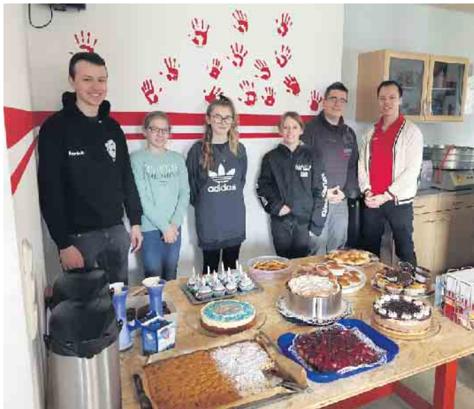
Rosbacher Minis am Kuchenbuffet