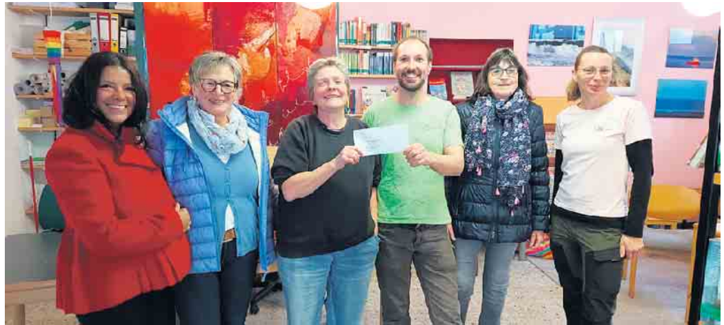
Spendenübergabe Bücherei Herchen

Deshalb hat der Vorstand der FU-Windeck beschlossen diese