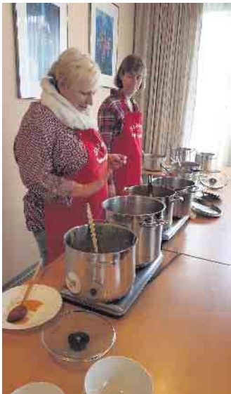
Eifrige Helfer bei der Ausgabe der Suppen