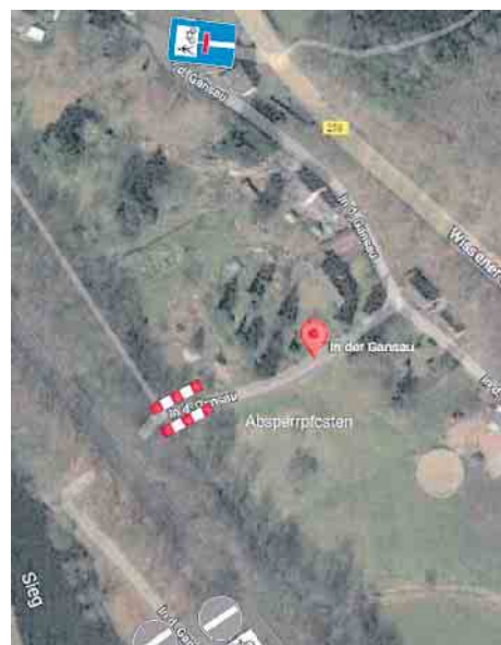
In der Gansau

Die Umsetzung der Maßnahme erfolgt voraussichtlich Anfang/Mitte März.