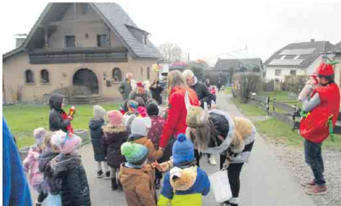
Freudig zogen die Abenteurer durch die bunt geschmückte Straße.

Endlich konnte die Kita Abenteuerland so richtig Karneval feiern. Mit selbst zusammengestelltem Buffet, Musik, Luftballons, Kamelle, Karnevalsspaziergang und das Beste: Die Eltern konnten mitfeiern. Das war ein riesen Spaß. Spiele und Tanz in der Gruppe und in der Turnhalle ließen die fröhlichen Superhelden, Katzen, Prinzessinnen, Bären, Regenbogenmädchen, Einhörner, Cowboys und viele anderen strahlen. Wie im letzten Jahr gab es einen