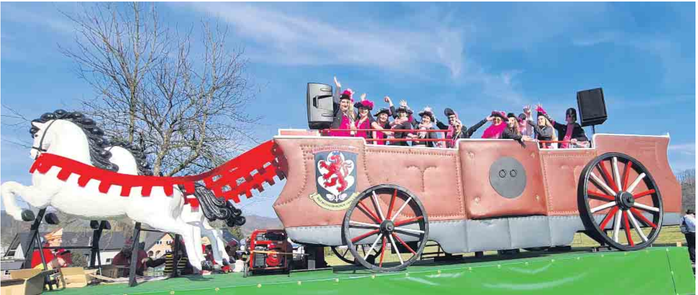
Festwagen der KG Rot-Weiss Herchen 1994 e.V. mit der Tanzgruppe Flamingos

Die KG Rot-Weiss Herchen 1994 e.V. blickt auf eine fantastische Session 2022 / 2023 zurück.