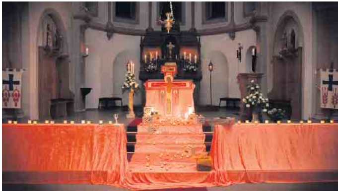
Taize in einer ganz besonderen Stimmung