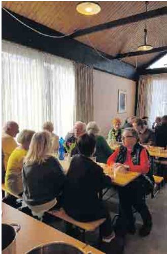
Intensiver Austausch unter den Gästen