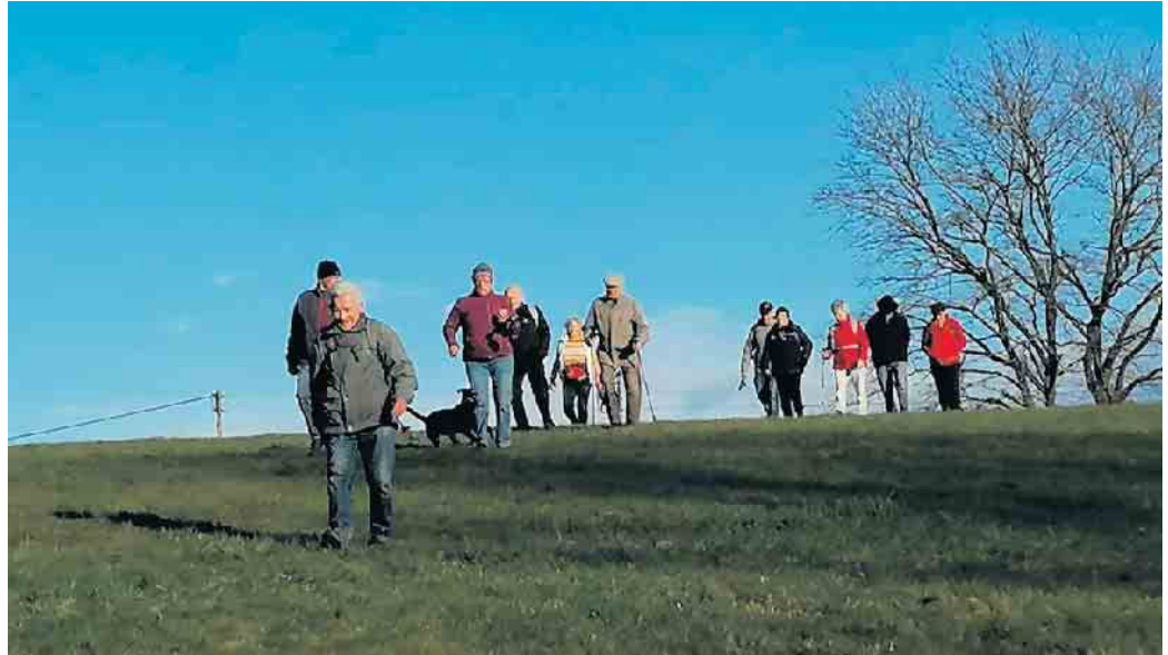
Wanderbild von März 2022

Wir bitten um verbindliche Anmeldung bei Meggie Patt (017652065183) bis zum 15. März.