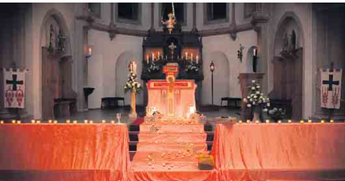
Die besondere Atmosphäre von Taizé