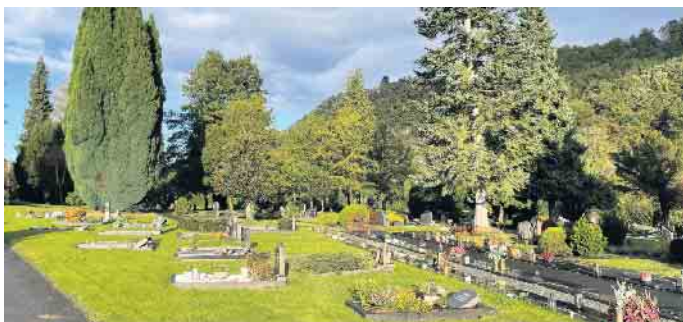
Friedhof im Herbst

Tag auch bei kleineren Arbeiten an einer Grabstätte helfen. Kommen Sie einfach dazu. Hier die weiteren Termine: 6. April, 4. Mai, 1. Juni. Aktuelle Informationen finden Sie immer unter www.friedhofsverein-rosbach.de . Der Vorstand