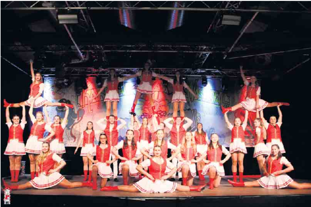
Rote Funken der KG Schladern 2025

„Schladern Alaaf“ - Diese Worte werden schon bald wieder am Wasserfall in Schladern zu hören sein, wenn am 23. Februar der Damenelferrat in die Kabelmetallhalle schreitet und unsere Damensitzung eröffnet. Wer noch keine Karte hat, sollte nun schnell sein und sich eine der letzten Plätze über die Homepage von Kabelmetal für unsere Sitzung sichern. Euch erwartet ein buntes Programm mit viel Musik und Tanz. Schon eine Woche später geht es dann weiter mit unserem Platzkonzert, dem karnevalistischen Frühshoppen auf dem Bahnhofplatz. Beginn am 2. März ist natürlich, wie sollte es auch anders sein um 11.11 Uhr. Beachtet bitte, dass der Parkplatz neben dem Bahnhofsgelände daher bereits ab Freitagabend gesperrt wird. Wir freuen uns auf viele Karnevalsfreunde und wünschen euch noch eine gute Session. Der Vorstand