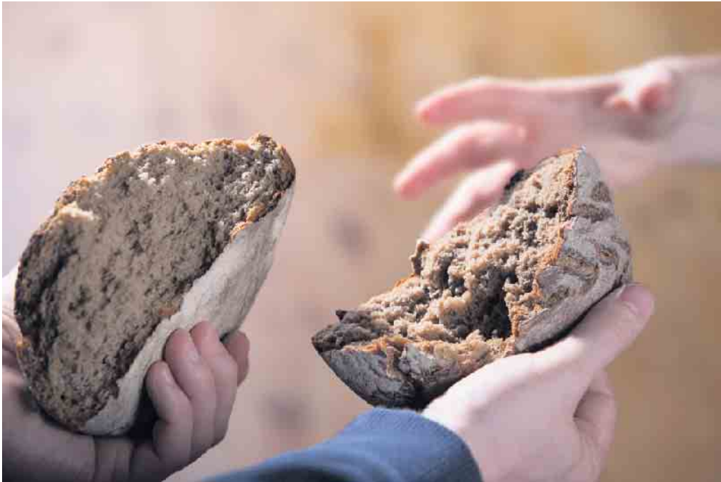
Gebrochenes Brot in Anlehnung an die „Semmelsegnung“ in Attendorn