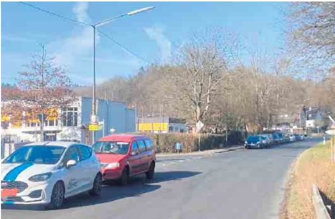
Unüberschaubare Verkehrssituation durch mangelnde Parkplatzlösung

wachs steigt auch der Bedarf an Lehrkräften und Betreuungspersonal, von denen viele mit dem Auto anreisen. Die Folge ist eine chaotische und gefährliche Parksituation entlang der K55 und in den umliegenden Straßen. Besonders für Kinder, aber auch für andere Verkehrsteilnehmer entstehen täglich unübersichtliche und potenziell riskante Situationen. Die SPD Windeck fordert daher die Gemeindeverwaltung auf, beim Rhein-Sieg-Kreis auf eine Verkehrs- und Parkplatzlösung zu drängen. „Es ist Aufgabe des Bau-