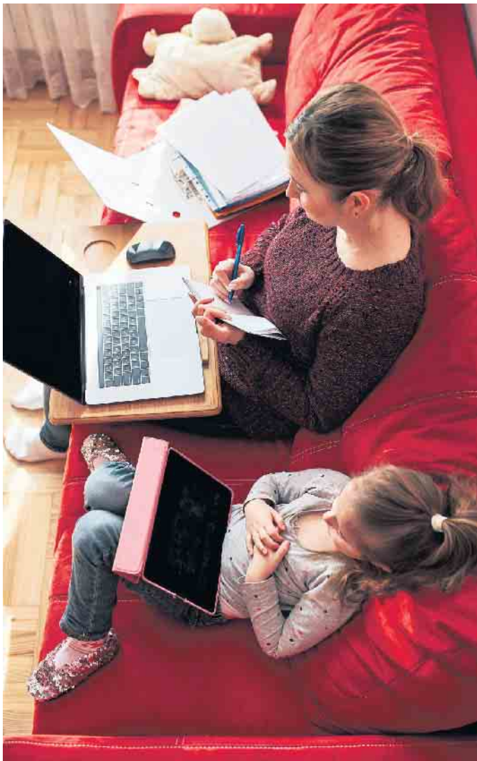
Mobiles Arbeiten kann bequem, aber gleichzeitig auch belastend sein.