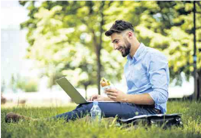
Bei jüngeren Mitarbeitern mit hoher digitaler Affinität hat vor allem das mobile Arbeiten stark an Beliebtheit gewonnen.