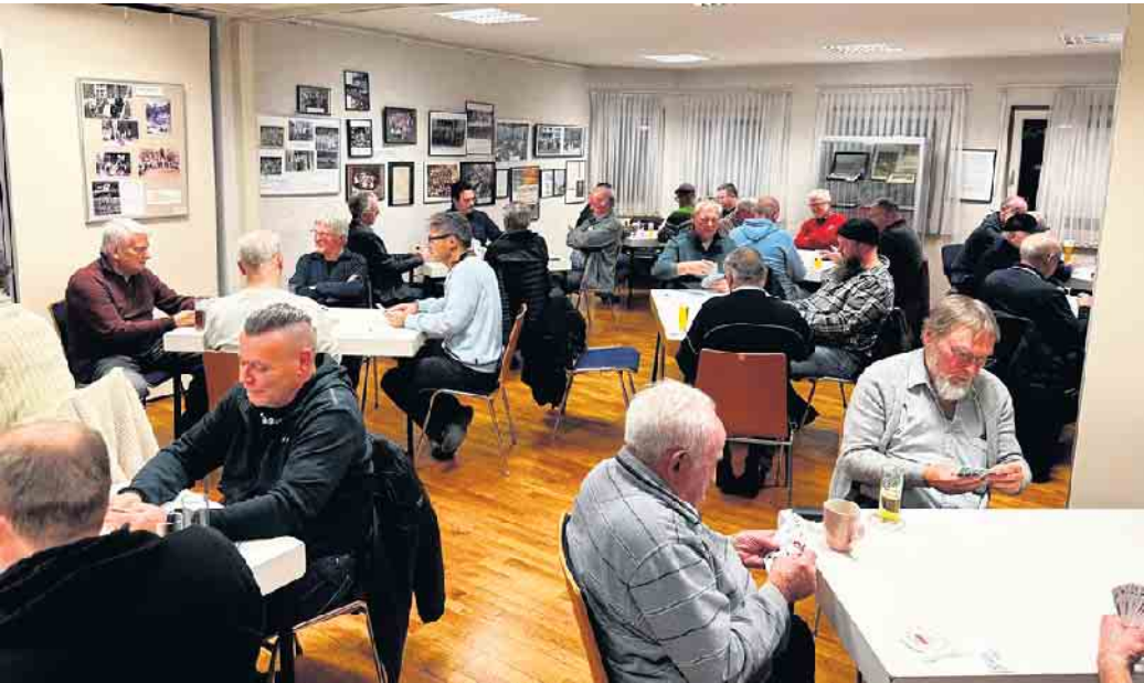
Skatturnier im vollen Gange