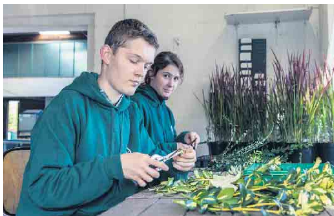
Abwechslungsreich und wichtig für die Zukunft: Ausbildung zum Baumschulgärtner.