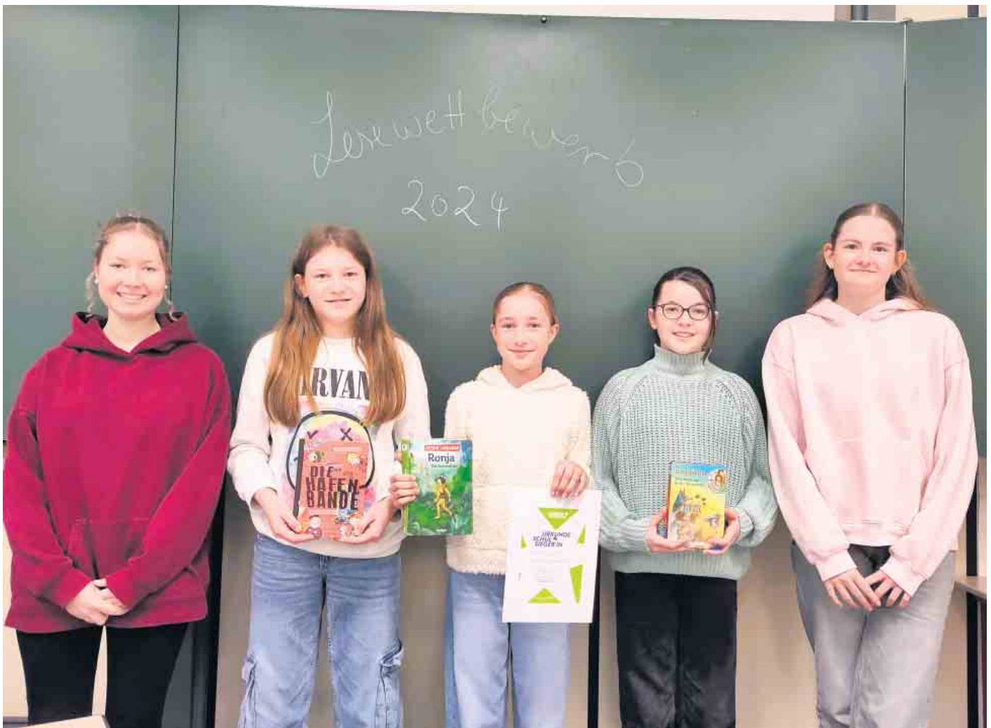
Die Siegerinnen und SV-Vertreterinnen des Vorlesewettbewerbes 2024 der Stufe 6.