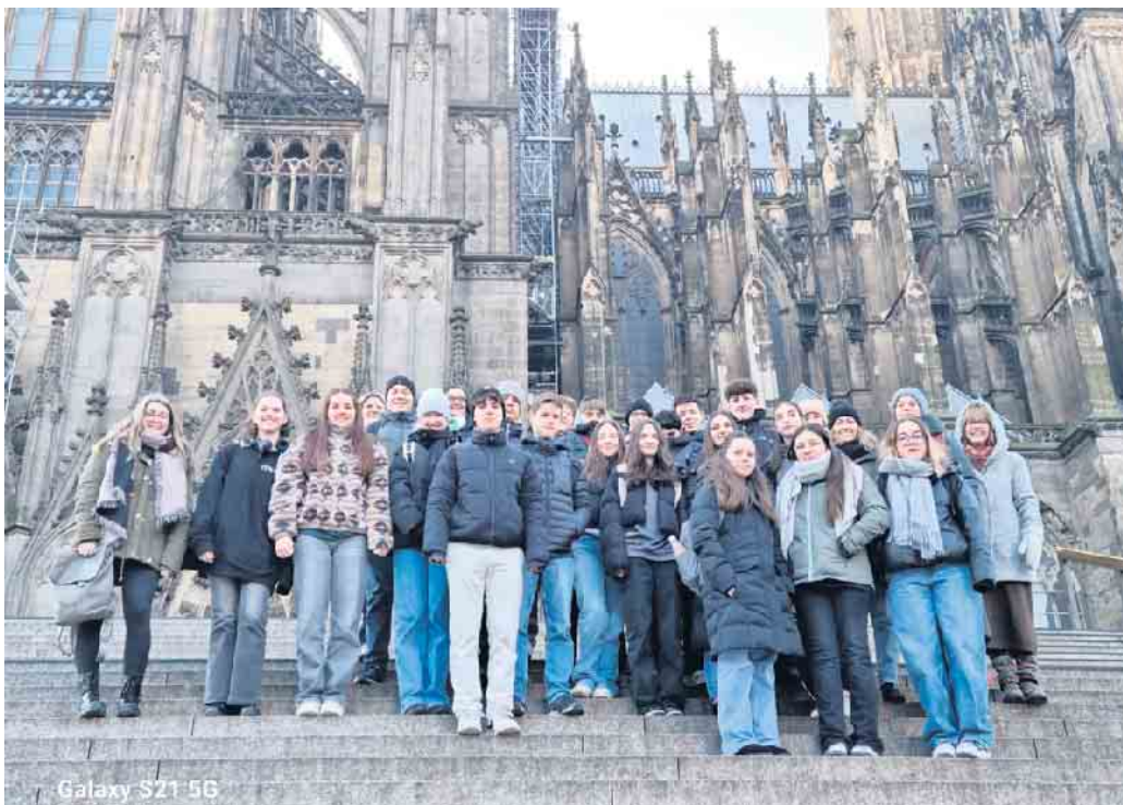
Die Schüleraustausch-Gruppe vor der imposanten Kulisse des Kölner Domes.

Vom 10. bis 12. Januar hatten wir zum ersten Mal Besuch aus unserer Partnerschule in Bel Val / Luxemburg.