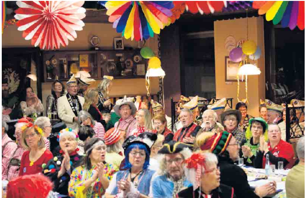
Herzliche Einladung zum Mitsingabend

Und wenn Sie Interesse haben, uns bei einer Chorprobe zu besuchen, wir proben immer freitags, 18 Uhr, im Sängenheim, Parkstraße 12, in Eitorf. Weitere Informationen auch unter www.eitorfer-gesangsverein.de