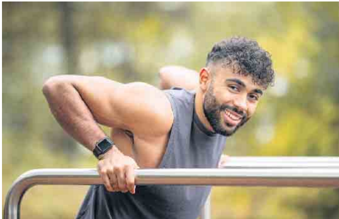
Wer Spaß an Fitness hat, kann in diesem Bereich mit einem dualen Studium auch seine berufliche Zukunft gestalten.

orientiert. Digitalisierung des Sport-, Fitness- und Gesundheitsmarktes Neben den Leistungen des zweiten Gesundheitsmarktes haben auch digitale Dienste und Apps für das individuelle Training sowie Wearables immer mehr an Bedeutung gewonnen. Ausgaben für Aktivitäten in den Bereichen Sport, Fitness und Gesundheit