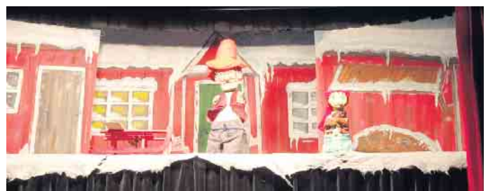
Pettersson und Findus (v.l.n.r.)

liebervoll inszenierte und ge- staltete Bühnenbild mit Licht- und Soundeffekten bei. Insgesamt vier Mal wurde, passend zur Jah- reszeit, das Stück „Pettersson kriegt Weihnachtsbesuch“ von der Puppenbühne Barbarella auf- geführt. Tagelang war es nämlich bei Pettersson und Findus so kalt, dass die beiden ihre Nasen nicht vor die Türe strecken wollten. Und jetzt, als es endlich ein bisschen wärmer wird, verstaucht sich der alte Pettersson bei einer rasanten Schlittenfahrt den Fuß. Doch morgen ist schon Heiligabend. Wie sollen die beiden den jetzt noch einen Weihnachtsbaum, Stock- fisch, Fleischklößen und Pfeffer- kuchen herbekommen? Zum Glück naht nachbarschaftliche Hilfe.... Getreu dem Motto: „Wenn jeder ein bisschen gibt, kann großes Glück entstehen. Auch wenn der Weihnachtsbaum