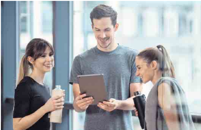
Fitnessstudios leisten einen wichtigen Beitrag zur Gesundheitsversorgung. Auch hier werden dringend Fachkräfte gesucht.

Im Bereich Gesundheit, Fitness und Sport werden dringend Fachkräfte gesucht