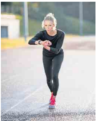
Immer mehr Menschen halten sich mit Sport fit und nutzen dabei auch sogenannte Wearables wie eine Fitnessuhr.

vielfältigen Gesundheitseffekten profitieren können. Studieren und Geld verdienen Doch um in der Bevölkerung Bewegungsmangel, Fehlernährung und Übergewicht reduzieren zu können, werden dringend Spezialisten benötigt, die gesundheitsfördernde Interventionsmaßnahmen entwickeln. Für angehende Fachkräfte bietet sich etwa ein duales Bachelor-Studium im Bereich Gesundheitsmanagement an der Deutschen Hochschule für Prävention und Gesundheitsmanagement (DHfPG) an. Dabei kann man das Studium mit einer beruflichen Tätigkeit kombinieren. Mehr Infos auch zu den Bachelor-of-Arts-Studiengängen Fitnessökonomie, Sportökonomie, Gesundheitsmanagement, Fitnesstraining und Ernährungsberatung gibt es unter www.studieren-mit-gehalt.de . Der Start ist jederzeit möglich, die Präsenzphasen können an einem der elf Studienzentren in Deutschland, Österreich und der Schweiz oder in digitaler Form absolviert werden. Dazu erhalten die Studierenden eine Vergütung, die sich in der Regel an den Gehältern von Auszubildenden