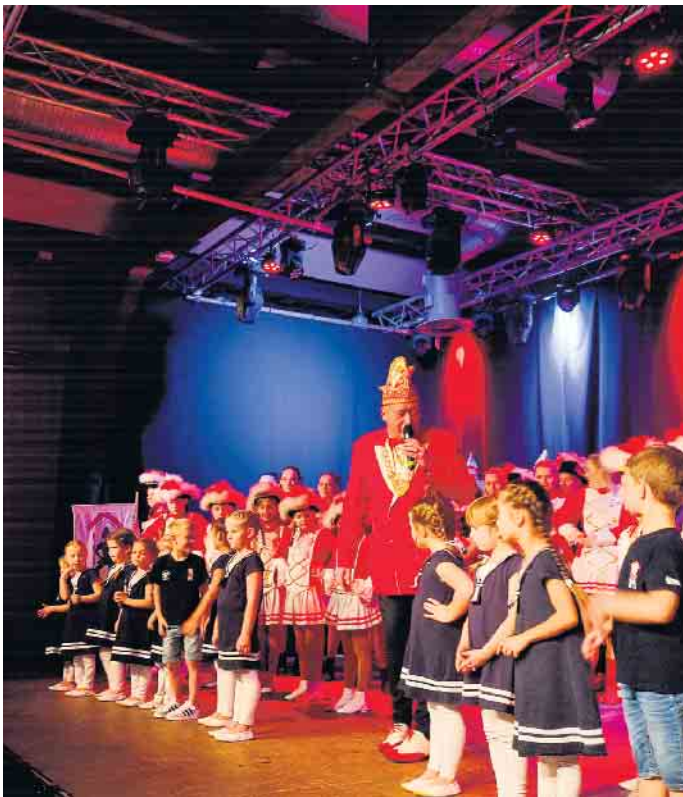
KG Schladern lädt zum Tanztreffen ein

Gleich zu Beginn des neuen Jahres, nämlich am 7. Januar, laden wir alle ganz herzlich zu unserem Tanztreffen in die Hallen von Kabelmetal ein. Los geht es ab 11.11