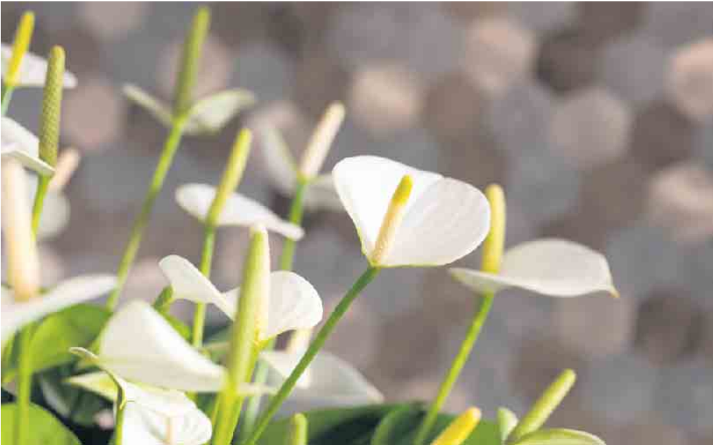
Die Hochblätter der Anthurien sorgen in der dunklen Jahreszeit für helle Reflexe in der Wohnung.

Anthurien haben als Zimmerpflanzen keine Blühsaison. Sie zeigen ihre Hochblätter bei guter Pflege und richtigem Standort mehrere Monate lang und entwickeln immer wieder neue. Doch gerade