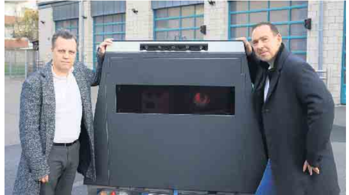
Euskirchens Bürgermeister Sascha Reichelt und Dino Steuer, Bürgermeister Weilerswist, stellen den gemeinsamen Blitz vor.

Die Anschaffung erfolgt im Leasingmodell, um flexibel auf Vandalismus-Schäden reagieren zu können. Die Kosten tragen beide Kommunen anteilig (Euskirchen \frac{3}{4} und Weilerswist \frac{1}{4} ). Der Blitz-