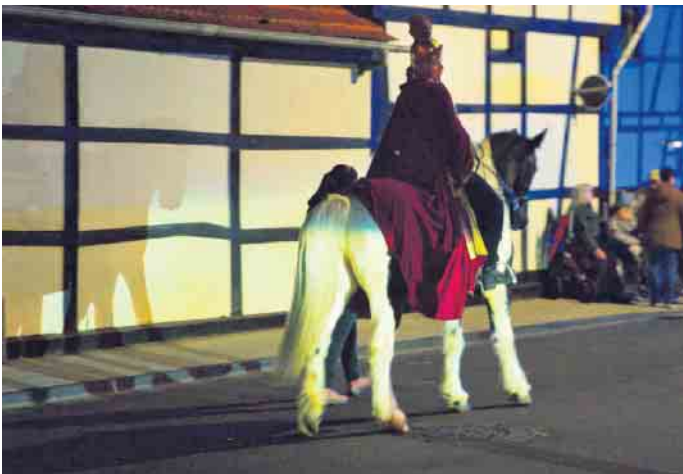
St. Martin(a) vor den schönen Fachwerkhäuschen in Müggenhausen

Ein herzliches Dankeschön gilt der Feuerwehr, die mit viel Einsatz für