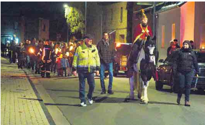
Laternenzug auf der Rheinbacher Straße

bares Zeichen für Gemeinschaft und Zusammenhalt. Er hat uns gezeigt, wie wertvoll es ist, wenn Jung und Alt gemeinsam feiern und Erinnerungen schaffen. Denn wer erinnert sich nicht gerne an die selbst erlebten Martinszüge, die Basteleien im Vorfeld und an die ein oder andere verunglückte Laterne als Kind? (Text: S. Jäckel)