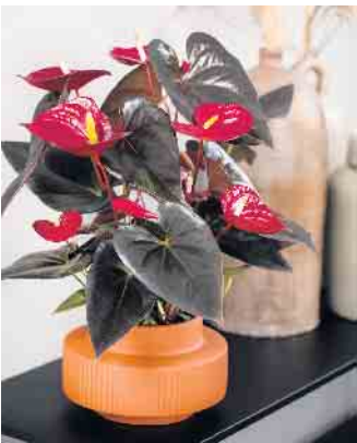
Ausreichend Licht und im Idealfall 18 bis 25 Grad Celsius, dann fühlen sich die Anthurien im Topf rundum wohl.

Anthurien haben als Zimmerpflanzen keine Blühsaison. Sie zeigen ihre Hochblätter bei guter Pflege und richtigem Standort mehrere Monate lang und entwickeln immer wieder neue. Doch gerade