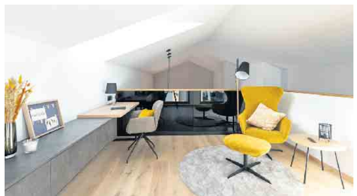
Ein multifunktionaler Arbeits- und Rückzugsort bietet sich etwa auf einer Galerie über dem offenen Küchen-, Ess- und Wohnbereich.