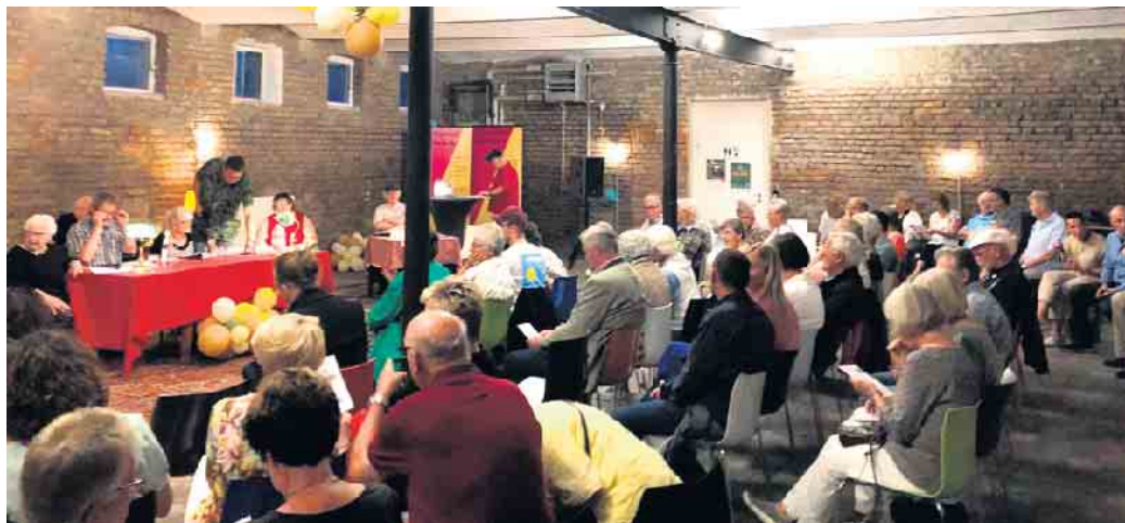
Im Kulturhof Velbrück

Mir macht die Arbeit für den gemeinnützigen Kulturhof Velbrück e.V. Spaß, weil ich selber große Freude an Konzerten, Schreibwerkstätten, Vorträgen, Literatur, Hoffesten und anderen kulturellen Events habe. Es macht Freude, wenn man mit dem eigenen Engagement etwas bewegen kann, und das Interesse anderer wecken kann. Ich habe die Erfahrung gemacht, dass Kultur im weitesten Sinne zunächst als abgehoben, anstrengend betrachtet wird. Aber die meisten, die bei einem Konzert oder einer Lesung in unserem „Alten Kuhstall“ waren, waren hinterher begeistert: die