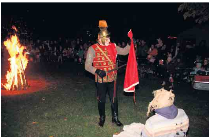
Am Ende des Zug Weges kehrte man zurück zur Einrichtung, wo am Martinsfeuer der Heilige Martin seinen Mantel mit dem armen Bettler teilte

So feiert die Kindertageseinrichtung Spatzennest