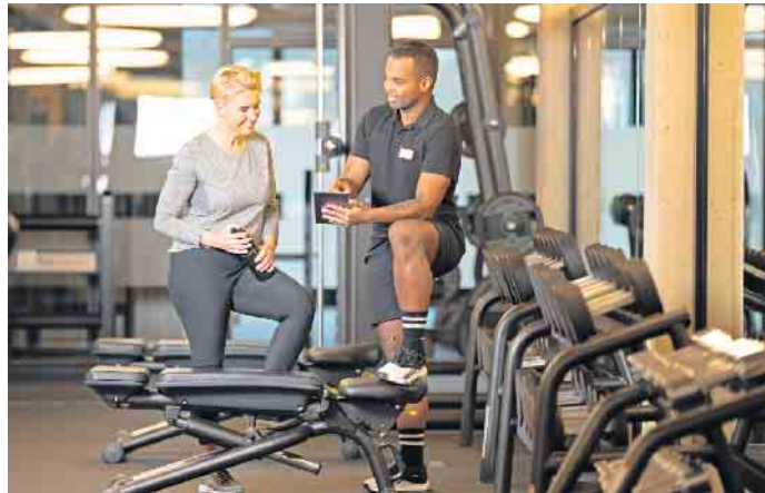
Wer trainiert, möchte dabei gut betreut sein: Fachkräften bieten sich in der Fitness- und Gesundheitsbranche sehr gute berufliche Perspektiven.

heitstraining muss eine bedarfsgerechte und fundierte Betreuung aller Mitglieder, die in Fitness- und Gesundheitsanlagen trainieren, sichergestellt sein. Entsprechend groß ist das Potenzial für gut ausgebildete Fachkräfte. Qualifizieren können sich künftige Fitness- und Gesundheitsexperten beispielsweise an der staatlich anerkannten Deutschen Hochschule für Prävention und Gesundheitsmanagement (DHfPG). Diese bietet sieben duale Bachelor-Studiengänge, vier Master-Studiengänge, ein Graduiertenprogramm sowie über 100 Hochschulweiterbildungen in den Bereichen Prävention, Gesundheit, Ernährung, Fitness, Sport und Informatik an. Zudem können sich Interessierte in Lehrgängen