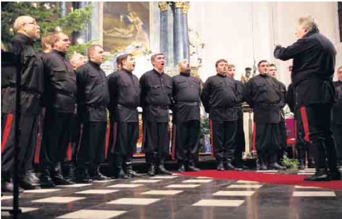
Firma Michael Fey, Post, Buch- und Schreibwarenhandel, Kölner Straße 79-81 in Weilerswist, zum Preis von 25 Euro.

Unterstützung kommen würden. Und bedanken sich jetzt schon sehr herzlich dafür“. Schon beim ersten Weihnachtskonzert im Jahre 1999 begeisterte und überzeugte der Don-Kosaken-Chor restlos und eroberte die Herzen aller Zuhörer im gesanglichen Sturm mit großer Einfühlsamkeit und Inbrunst. Der renommierte Chor singt unerreicht klassische sakrale Werke, Volksweisen und Weihnachtslieder in der Klangpracht, Präzision und Perfektion getreu des ehemaligen Chores von Serge Jaroff. Karten gibt es jetzt schon bei der