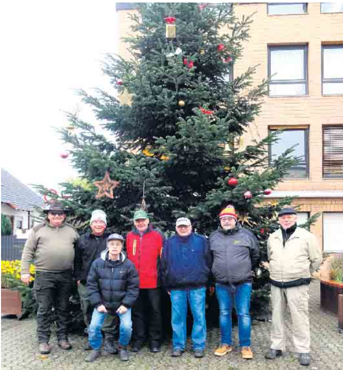
Es ist vollbracht - die Baumstubser