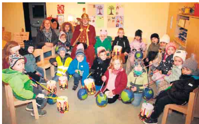
Den Spatzen war die Freude über das Fest sichtlich ins Gesicht geschrieben

Nachdem sich alle Kinder in ihren Gruppen gesammelt hatte, stattete der Sankt Martin jeder Gruppe einen Besuch ab. Ein Laternenumzug mit Sankt Martin hoch zu Ross, einem Tambourcorps und den Eltern dahinter fand anschließend statt. Am Ende des Zug Weges kehrte man zurück zur Einrichtung, wo am Martinsfeuer der Heilige Martin seinen Mantel mit dem armen Bettler teilte. Ganz zur Freude der Kinder verteilten in diesem Jahr der