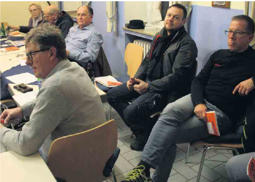
Auch die „Selbstvorsorge“ vor möglichen Katastrophen stieß auf das Interesse der Bürger:innen.