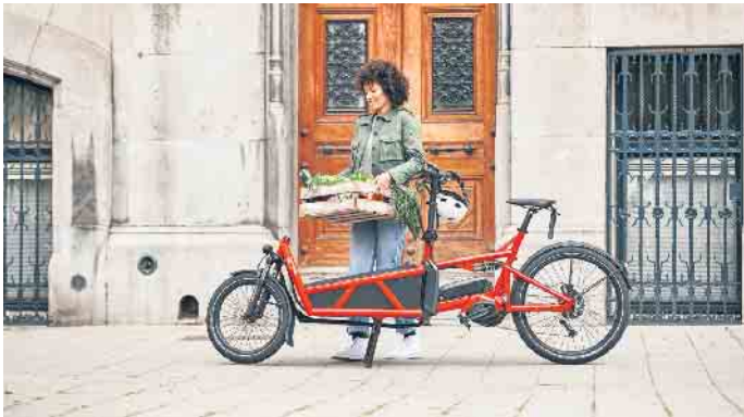
Lastenräder gehören in vielen Städten zum Alltagsbild. Mit elektrischer Unterstützung ermöglichen E-Cargobikes den bequemen Transport zum Beispiel von Wocheneinkäufen.

Wichtig ist gerade bei elektrischen Lastenrädern ein leistungsstarker Akku, um angesichts des Eigengewichts und der transportierten Lasten eine hohe Reichweite zu ermöglichen. Praktisch ist zudem die