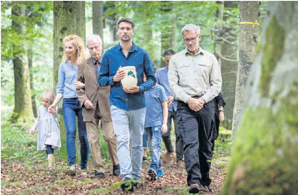
Urnenbeisetzungen sind in Deutschland die häufigsten Bestattungsarten.

Ohne Bestattungsunternehmen gibt es in Deutschland keine Beerdigung. Der Bestatter übernimmt unter anderem die Abholung des Verstorbenen, Versorgung und Bettung im Sarg, Überführung zum Krematorium und dann zur letzten Ruhestätte. Die Kosten sind direkt beim ausgewählten Anbieter zu erfragen. Für Urnenbeisetzungen, inzwischen die häufigste Form der Bestattung, ist die Kremierung Voraussetzung. Dessen Kosten werden oft über das gewählte Bestattungshaus abgerechnet. Wie hoch die Ausgaben für ein Urnengrab an sich ausfallen, hängt ebenfalls vom Individualfall ab. Beim Anbieter FriedWald beispielsweise kauft man entweder Grabrechte für eine Einzelruhestätte, das ist der Platz für die Urne unter einem