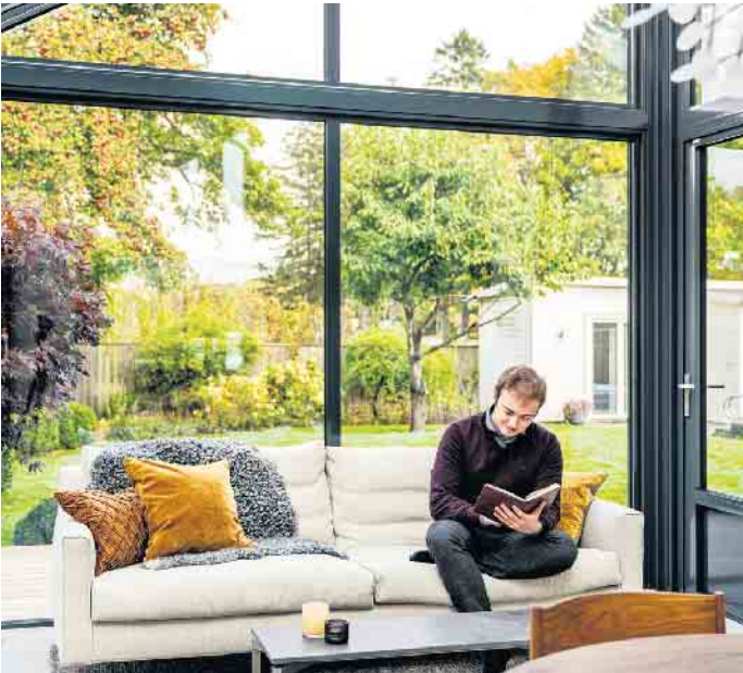
Die staatlich förderbaren Glasanbauten eignen sich als Vergrößerung des Wohnzimmers, des Esszimmers, als neue Wohnküche oder auch als Homeoffice.

Gegebenheiten und energetische Anforderungen zu berücksichtigen. So ist es zwingend notwendig, den Antrag für die Förderung vor dem Baubeginn zu stellen. Zu den weiteren Kriterien bei der Förderung über die BAFA gehört unter anderem, dass der Bauantrag des Bestandshauses älter als fünf Jahre sein muss. Eine Anforderung für die Förderung mittels Einkommensteuerbonus ist es wiederum, dass seit der Grundsteinlegung mehr als zehn Jahre vergangen sind. Mehr Licht und mehr Wohnqualität Die staatlich förderbaren Glasanbauten eignen sich als Vergrößerung des Wohnzimmers und Esszimmers, als Homeoffice oder