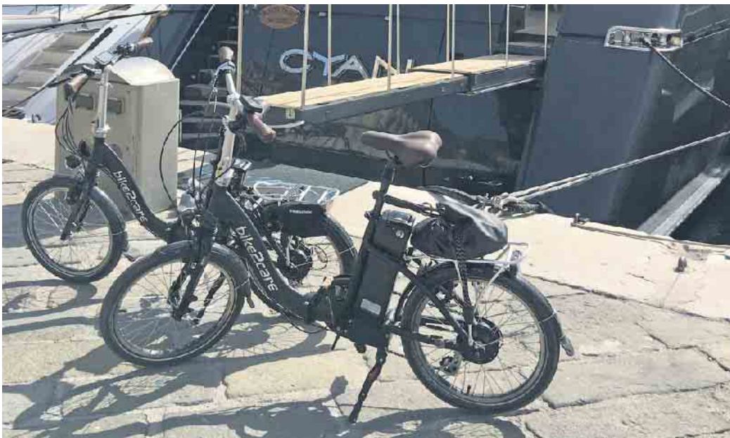
Im Urlaub sind die kompakten E-Falträder ideale Begleiter.

Es geht wieder dorthin, wo man die schönsten Wochen des Jahres am liebsten verbringen möchte: an Nord- und Ostsee, in die Alpen, die deutschen Mittelgebirge, an den Gardasee oder an die Küsten im Mittelmeerraum. Ein deutliches Plus an bequemer Mobilität vor Ort gewinnt, wer ein kompaktes E-Faltrad mit an Bord hat und am Urlaubsziel Ausflüge auf zwei Rädern unternehmen kann. Das gilt nicht nur, aber vor allem auch für Wohnmobilreisende.