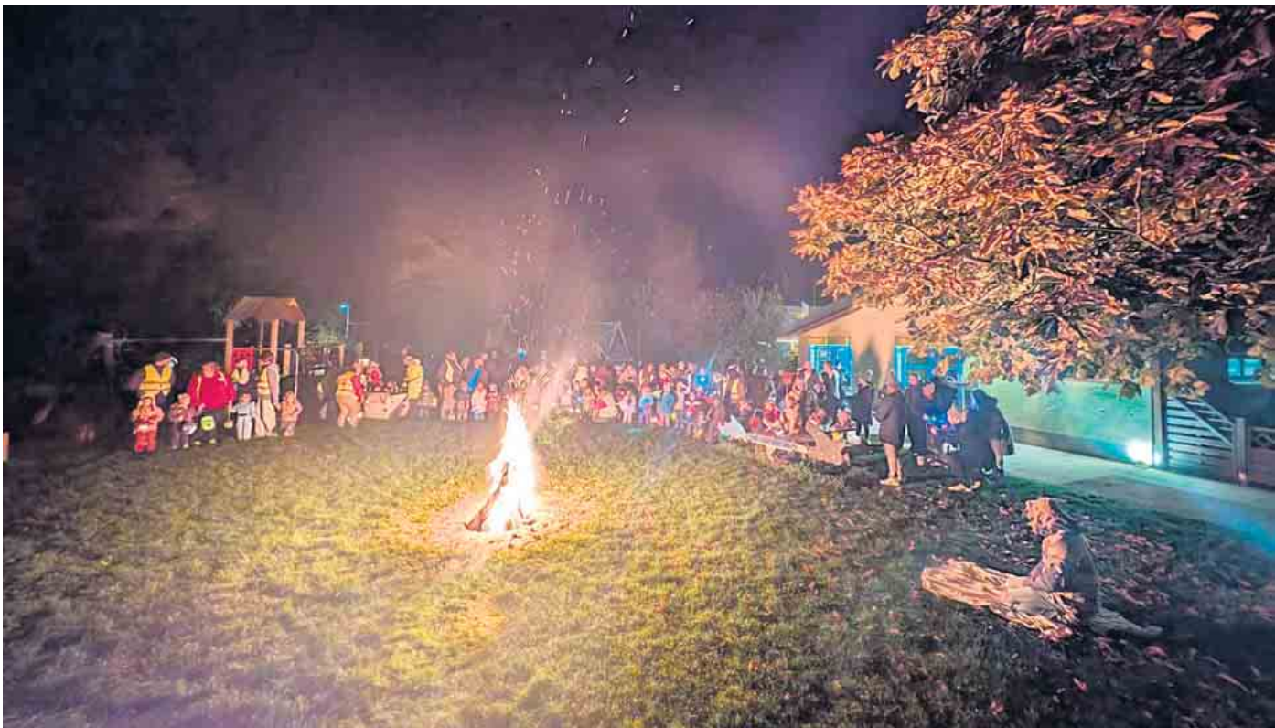
Am Ende des Zug Weges kehrte man zurück zur Einrichtung, wo am Martinsfeuer der Heilige Martin seinen Mantel mit dem armen Bettler teilte.