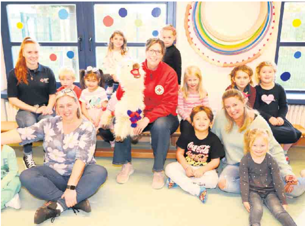
„Alpaka Indigo“ zu Gast im Spatzennest: Die „Kunti Buntis“ erleben spannende Projekttag zum Resilienz- Training

In der Zeit vom 22. bis 25. Oktober fand in der DRK Kita „Spatzennest“ in Großvernich die erste Indigo-Projektwoche, ermöglicht durch das Deutsche Rote Kreuz im Kreis Euskirchen, statt. Dieses Resilienz-Training für Vorschulkin- der wurde vom Deutschen Roten Kreuz Landesverband Rheinland- Pfalz e.V. entwickelt und ist ein zentraler Bestandteil der präven- tiven Bildungsarbeit. Das Indigo- Projekt, das sich durch eine spie- lerische und kindgerechte Ver- mittlung von emotionaler Stärke und Bewältigungsstrategien aus- zeichnet, hat zum Ziel, die Psy- choedukation bereits im Vorschul- alter zu fördern. Gerade nach den verheerenden Ereignissen der Flut- katastrophe 2021 im Kreis Eus- kirchen wird deutlich, wie wichtig es ist, Kinder frühzeitig auf mög- liche Krisen vorzubereiten und ih- nen zu zeigen, wie sie mit ihren Emotionen und Belastungen um- gehen können. Das „Indigo“-Pro- jekt setzt als Bestandteil der DRK Flutlotsenstelle „Perspektiven nach der Flut“, die direkt nach der Flutkatastrophe ins Leben ge- rufen wurde, einen besonderen Schwerpunkt auf die Förderung der psychischen Widerstandskraft (Resilienz) bei Kindern. Durch ge- zielte Psychoedukation lernen die Vorschulkinder, dass Krisen wie Naturkatastrophen zwar nicht immer verhindert werden können, aber ihre emotionalen Reaktionen darauf beeinflusst werden können. Das Programm stärkt ihr Vertrau- en in die eigenen Fähigkeiten, ihre