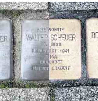
Stolperstein vor und nach Reinigung