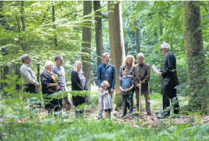
Die Beisetzungsfeiern in einem Friedhofswald sind individuell gestaltbar.

buntes Laub und im Winter die Schneedecke. Die Bäume jedoch können mit einer Namenstafel zum Andenken versehen werden. Hierfür fallen zwischen 30 und 125 Euro an. (DJD)