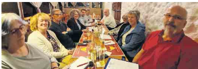
Der Einladung „Auf ein Kölsch“ waren interessierte Bürger:innen aus Weilerswist gefolgt.