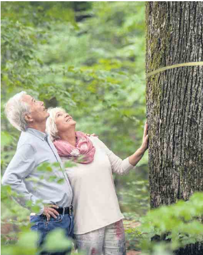
In einem Friedhofswald kann man einen Platz unter einem Baum oder einen ganzen Baum für die Familie kaufen.

selbst ausgesuchten Baum; oder alternativ für einen ganzen Baum, unter dem mehrere Familienmitglieder oder Freunde beerdigt werden können. Unter www.friedwald.de finden Interessierte eine konkrete Kostenaufstellung. Die Grabrechte für einen einzelnen Platz kann man ab 590 Euro erwerben, die für einen Baum ab 2.890 Euro. In beiden Fällen ist im Preis das Nutzungsrecht, der Eintrag im Baumregister sowie eine Urkunde als Grabnachweis enthalten.