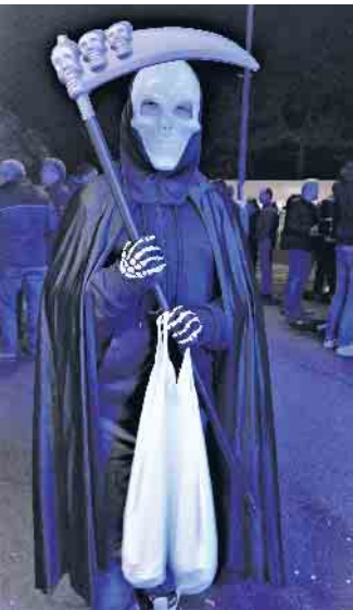
Halloween in Lommezem