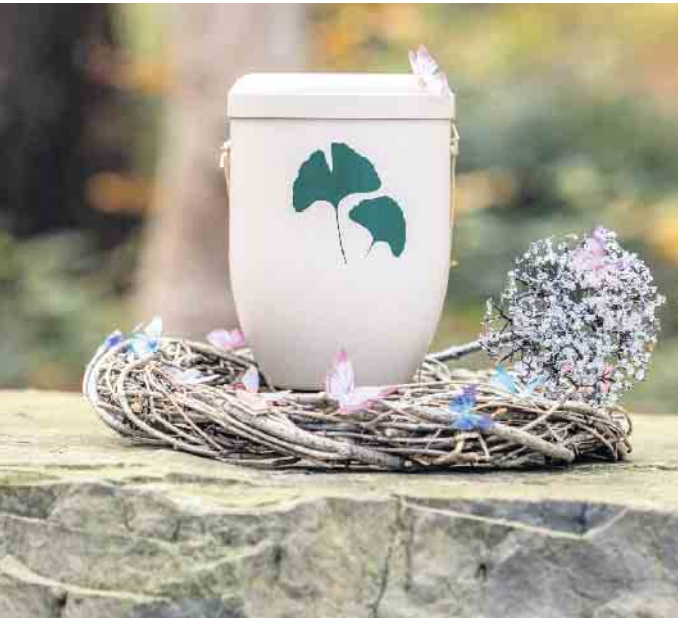
In einer biologisch abbaubaren Urne geht die Asche des Verstorbenen irgendwann in den Waldboden über - eine schöne Vorstellung für viele Naturverbundene.