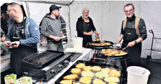
Reibekuchen... soweit das Auge reicht