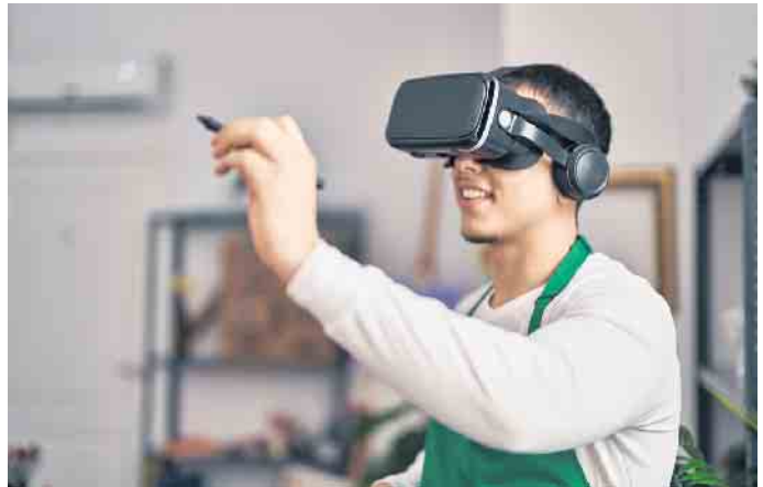
Bei der Gewinnung von Azubis setzt die Glasindustrie modernste Technologien ein. Mittels VR-Brille können Interessierte virtuell in den Beruf hineinschnuppern.