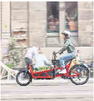
Die Kids zur Kita bringen oder den Einkauf nach Hause transportieren: E-Cargobikes sind eine nachhaltige, umweltfreundliche und kostengünstige Alternative zum Auto.

sind dabei die Reichweiten-Hinweise, die automatisch berechnen, ob das Wunschziel mit elektrischer Unterstützung noch bequem erreicht werden kann. (djd)