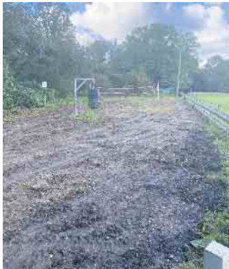
Eine Wildschweinhorde verwüstete das zuvor wiederhergestellte Volleyballfeld.