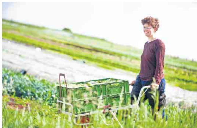
Zu den wichtigsten Werten in der ökologischen Landwirtschaft gehört der verantwortungsvolle Umgang mit der Natur.

Der Bio-Boom in Deutschland ist ungebrochen: Mit fast 15 Milliarden Euro Umsatz erreichte er im vergangenen Jahr einen neuen Rekordwert, meldet das Statistikportal Statista. Zu den wichtigsten Gründen für den Kauf von Bioprodukten nannten die Befragten den Wunsch nach artgerechter Tierhaltung (96 Prozent), nach möglichst naturbelassenen Lebensmitteln (96 Prozent) und regionaler Herkunft (93 Prozent).