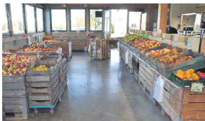
Äpfel, Äpfel, Äpfel in bester Qualität sind das Herzstück des Hofladens.

trieb trotzdem eine gute Ernte einfahren.