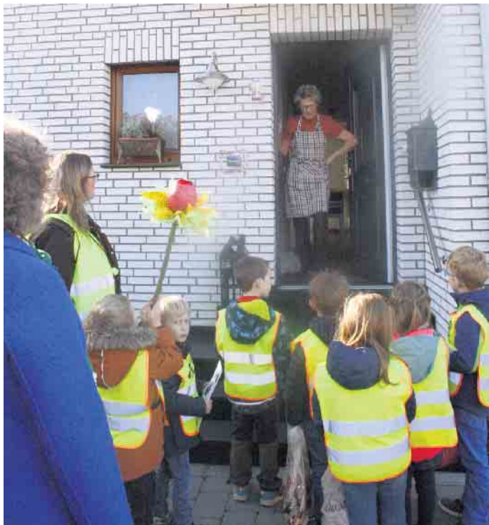
Die Senioren freuten sich auch in diesem Jahr wieder sehr über den Besuch der Kta-Kinder zum Martinsfest.