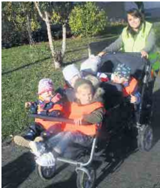
Auch die Kleinsten der DRK-Kita waren beim Wecken-Verteilen mit dabei - zu Fuß oder im Bollerwagen. Sie erfreuten die Senioren aber nicht nur mit dem süßen Gebäck, sondern auch mit einem Martinslied.

Kita-Kinder bei den ersten Hausbesuchen begleitete. Doch zunächst mussten die Wecken gekauft werden. In der Lommersumer Bäckerei Halbekann war man schon gut vorbereitet und die Kinder schnell mit Tüten voller Martinswecken ausgestattet. Dann konnte es endlich losgehen und gebannt warteten die Kinder an der Haustür auf die erste Seniorin, die sie mit dem frischen Backwerk, zuvor aber auch mit einem Martinslied erfreuten. Dass diese