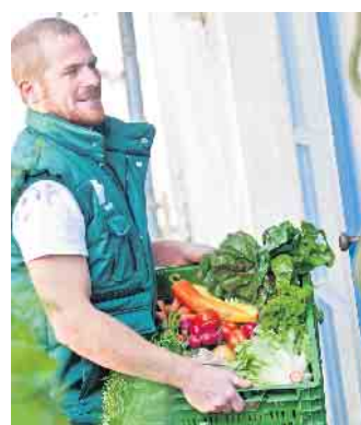
Vom Feld an die Haustür: Bio-Erzeugnisse kauft man am besten bei regionalen Anbietern.

Wertschätzung: Eine liebevoll zusammengestellte Gemüsebox macht nicht nur satt. Sie vermittelt auch den Wert von Lebensmitteln - anders als kiloweise in Plastik verpackte Waren aus dem Supermarkt. Geschmack: Obst und Gemüse aus regionalem Öko-Anbau haben keine lange Lagerzeit und kurze Transportwege. Das macht sich nicht nur beim Geschmack bemerkbar, sondern auch beim Vitamingehalt. (djd)