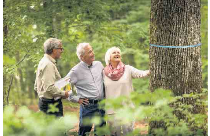
Ein freier Baum, der als Ruhestätte infrage kommt, ist mit einem farbigen Band markiert.

Kostenlose Waldführungen informieren über mögliche Arten einer Grabstätte