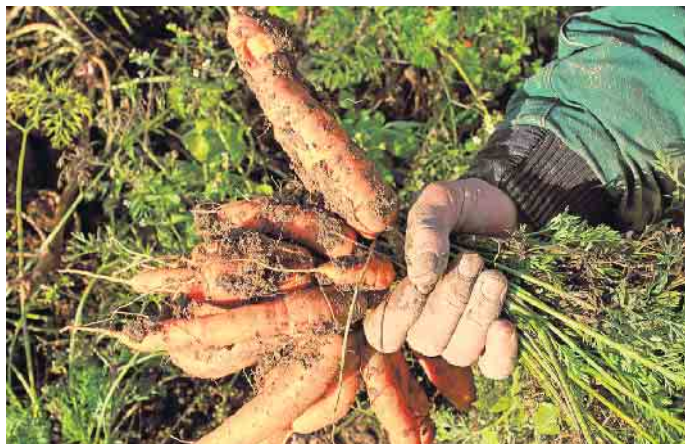
Regionales Bio-Gemüse: knackfrisch und ohne Umweg zum Kunden.

Diese Standards machen Bio-Lebensmittel ökologisch, fair und enkeltauglich