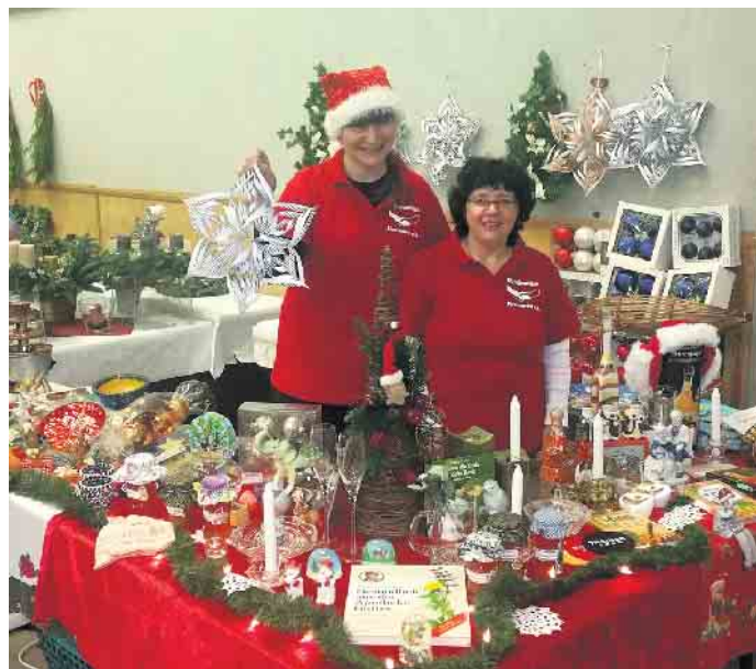
Die fleißigen Helfer