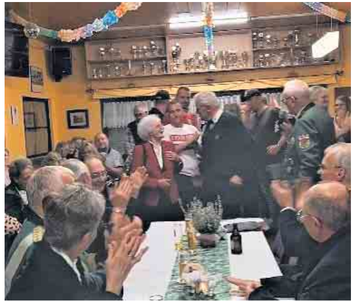
Verleihung des Jubelordens