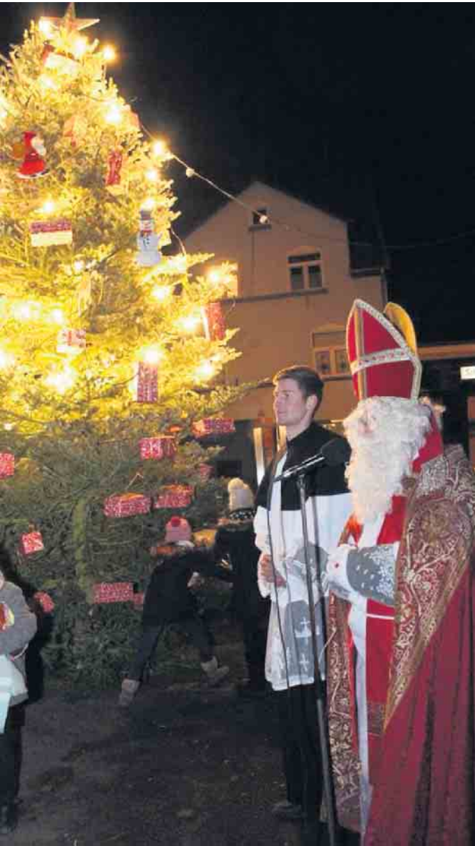
Der Nikolaus wird am 26. November wieder vor dem Weihnachtsbaum von Lommersum erwartet.

Pünktlich zum ersten Advent wird in Lommersum ab dem 26. November wieder der Weihnachtsbaum auf dem Kaiser-Wilhelm-Platz erstrahlen. Dazu lädt die Lommersumer Löschgruppe wieder alle Lommersumer Bürgerinnen und Bürger und insbesondere die Kinder herzlich ein. Die traditionelle Weihnachtsbaumaufstellung beginnt am 26. November um 17 Uhr auf dem Kaiser-Wilhelm-Platz. Bei heißen und kalten Getränken sind die Kinder dazu aufgerufen, den Baum gemeinsam mit den Feuerwehrleuten zu schmücken, bevor der Nikolaus die Kinder gegen 18 Uhr besuchen wird. Er wird von seiner Geschichte erzählen und allen Kindern auch ein kleines Geschenk mitbringen. Während des ganzen Abends wird die Feuerwehr ihre Fahrzeuge für Klein und Groß ausstellen. Die Löschgruppe Lommersum freut sich über zahlreiche Besucherinnen und Besucher.