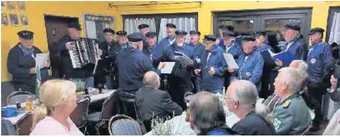
Auftritt Shanty Chor