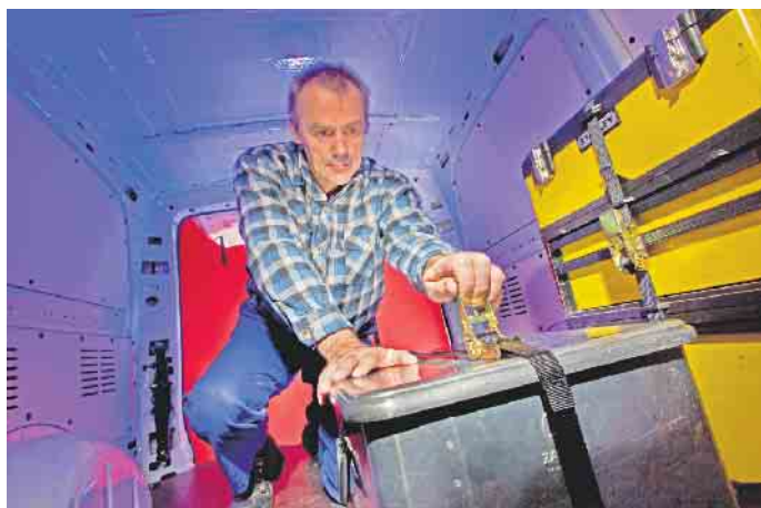
Fest verzurt: Vor Fahrtantritt muss der Fahrzeugführer die Ladungssicherung kontrollieren. Dabei ist es egal, ob es sich um Baustellen- Utensilien oder das Urlaubsgepäck handelt.

Transport ihrer Geräte steigen immer mehr Unternehmen auf Elektrofahrzeuge um. Der leise, emissionsfreie Antrieb ist gerade in Ballungsräumen ein Gewinn für Mensch und Umwelt. Allerdings bringt die neue Technologie auch neue Gefährdungen mit sich. So sollte auch im Umgang mit Hochvolt-Komponenten die Sicherheit stets Vorrang haben. Dazu bietet die Berufsgenossenschaft ebenfalls Informationen und eine Beratung an. (djd)