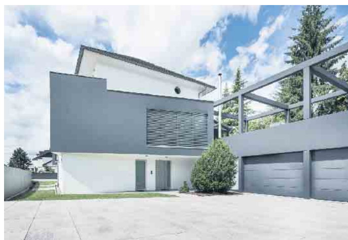
schützende Funktion - sie bildet gleichzeitig das Gesicht des Eigenheims.

stets ein Naturmaterial: Lehm, der entweder zu Klinkern gepresst oder zu Ziegeln geformt und anschließend gebrannt wird. (djd)