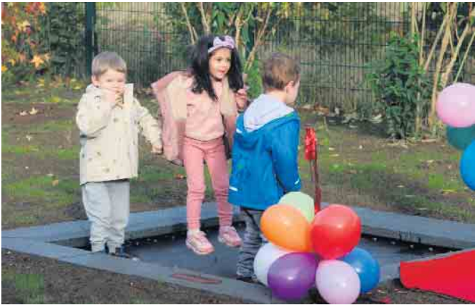
Nach der offiziellen Eröffnung nutzten alle die Möglichkeit das neue Trampolin auszuprobieren.

Bekanntermaßen gelten Ziegen und Zicken als beachtliche Sprung- und Kletterkünstler. Doch nun können deren Nachwuchs, die Kinder des Spatzennestes, nun fleißig üben. FH