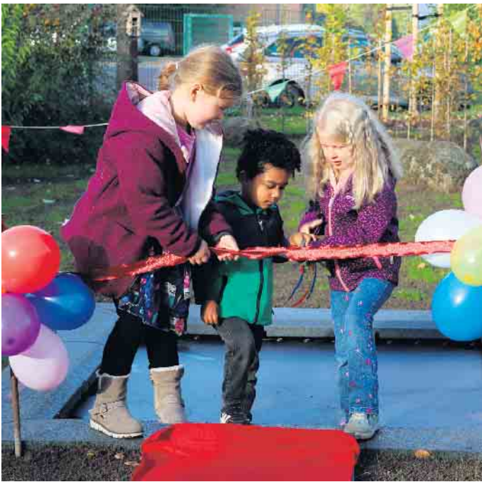
Feierliches Durchtrennen des roten Bandes.