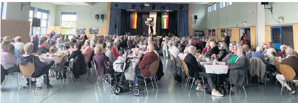
Rund 290 Seniorinnen und Senioren trafen sich im Weilerswister Forum zu einem meist karnevalistischen Nachmittag.

Einen turbulenten Nachmittag verlebten die rund 290 Bürgerinnen und Bürger, die sich zum Seniorennachmittag in Weilerswist angemeldet hatten. Zum abwechslungsreichen Programm servierten die Helferinnen und Helfer aus den Vereinen der Dorfvereinsgemeinschaft Kaffee und Kaltgetränke. Zuvor hatten sie Brötchen und Kuchen auf den festlich eingedeckten Tischen verteilt. Den Auftakt des Programms bestritt die Garde des TUS Vernich, die mit 50 Tänzerinnen auf die Bühne ins Forum der Gesamtschule einzog. Karnevalistisch ging es