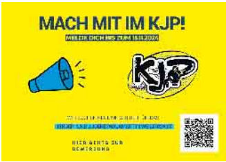
Abbildung: Gemeinde Weilerswist

Kitas und Schulen geholfen werden. Dem Einsatz des Kinder- Jugendparlaments ist ebenso der Pumptrack zu verdanken. Bewerbungen für das Mitwirken im Kinder- und Jugendparlament können bis zum 15. November 2024 an die E-Mail-Adresse KJP@weilerswist.de gesendet werden, oder direkt in den Briefkasten am Rathaus eingeworfen werden. Der Bewerbungsbogen kann im Jugendzentrum abgeholt