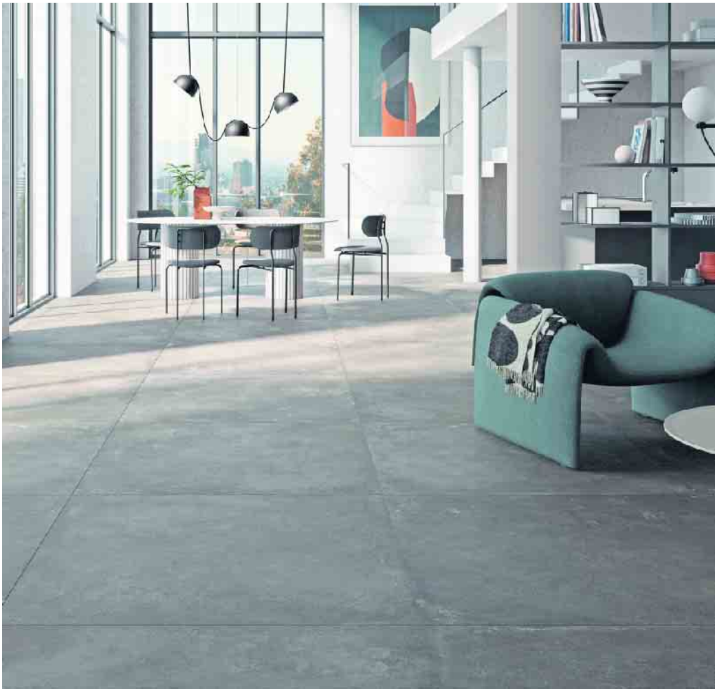
XXL-Fliesen im trendigen Estrich-Look schaffen Großzügigkeit in offenen Wohnkonzepten.