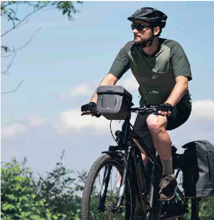
Gute Lenkertaschen zeichnen sich dadurch aus, dass sie mit einem Befestigungssystem, wie etwa Klickfix, ausgestattet sind.

verhaltens sollen schwere Lasten möglichst tief und mittig am Rad platziert werden. Lenker und Sattelstütze eignen sich daher eher für leichteres Gepäck, während schwerere Lasten gut am Gepäckträger aufgehoben sind. Taschen, Boxen und Körbe können seitlich und oben auf Gepäckträgern befestigt werden, die sich aber erheblich in ihren Maßen unterscheiden können und teilweise auch integrierte Akkus aufweisen. Die universellen Adapter von Klickfix machen es den Radlern aber einfach, denn sie lassen sich an fast jede Gegebenheit anpassen. Auch für den Lenker sind diverse Adapterlösungen erhältlich, die mit den unterschiedlichen E-Bike-Displays harmonisieren. (akz-o)