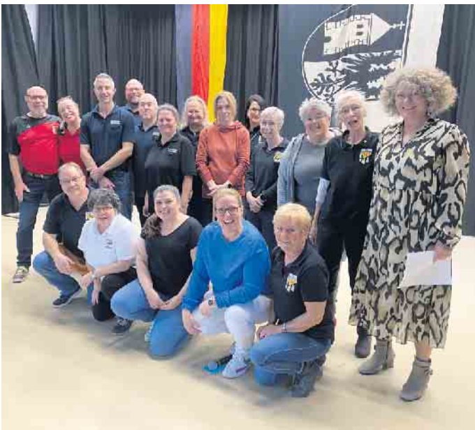
Bühne frei für die Helferinnen und Helfer aus den Vereinen. Sie bewirteten die Gäste unermüdlich mit Kaffee und Kaltgetränken.