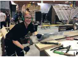
Im Dachdeckerhandwerk ist nicht mehr nur reine Muskelkraft gefragt. Dafür aber vielseitige Fähigkeiten, die den Beruf zunehmend für Frauen interessant machen.

Traditionelle Männerberufe werden zunehmend auch für Frauen interessant. Denn mittlerweile ist nicht mehr reine Muskelkraft gefragt. Zum Beispiel im Dachdeckerhandwerk: Dachziegel werden nicht mehr nach oben geschleppt, dafür gib es Lastenaufzüge, mittlerweile auch für sperrige Photovoltaik-Anlagen. Für erste Dach-Begutachtungen werden Drohnen losgeschickt, Materialien werden in kleinere Pakete gepackt, damit sie weniger wiegen. Dafür ist es ein unglaublich vielseitiger Beruf: Fassaden und Dächer werden gedämmt, mit ganz unterschiedlichen Materialien und Verfahren. Bei Sanierungen wird auch mal ein Dach komplett neu eingedeckt, zum Beispiel mit Schiefer, Dachziegeln, Holzschindeln oder auch Metall. Im Norden Deutschlands gibt es wunderschöne Reetdächer. Für mehr Licht sorgen neue Dachfenster und wenn Bauherren selbsterzeugten Strom nutzen wollen, dann installieren Dachdeckerinnen und Dachdecker Photovoltaik-Anlagen oder planen auch mal ein Gründach. Damit ist das Dachdeckerhandwerk ein Beruf, der wichtig ist, um das Klima zu schützen. Der Beruf erfordert Köpfchen, Kreativität und Geschick, vor allem aber wird Teamgeist großgeschrieben. Reinschnuppern kostet nichts Aber da alle Theorie grau ist, sollten junge Frauen, die sich generell fürs Handwerk interessieren, einfach mal in einen Dachdeckerbetrieb reinschnuppern. Betriebe, die Praktika und Ausbildungsplätze anbieten, sind auf dieser Webseite zu finden: