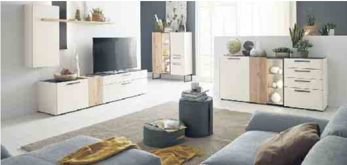
Mit Stauraum allein ist es bei Schränken nicht getan, denn sie sollen dauerhaft schön und sicher sein.

Hierauf sollten Endverbraucher beim Möbelkauf achten