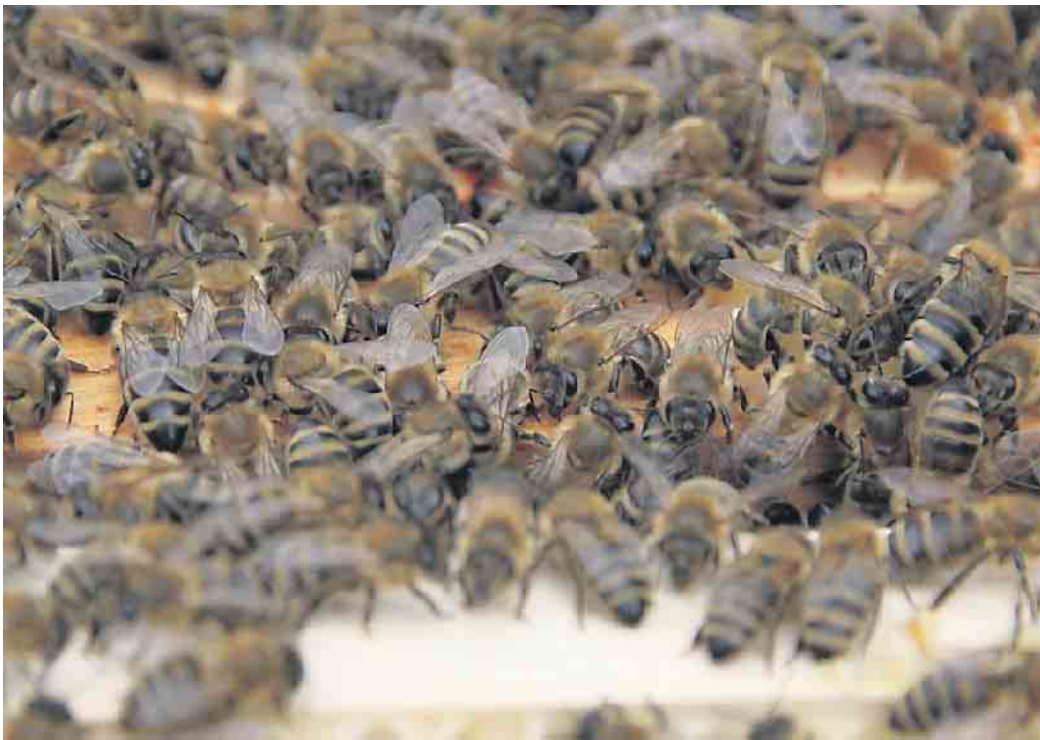
Honigbienen auf Wabe