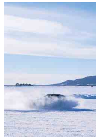
Elektronische Schutzengel unterstützen Autofahrer auch auf schneebedeckten Fahrbahnen.

Bremsweg dann fünfmal so lang sein wie auf trockenen Straßen. Deshalb ist neben den elektronischen Fahrsicherheitssystemen immer noch der Mensch am Steuer gefragt, der kühlen Kopf bewahren und das Fahrverhalten anpassen sollte. (djd)