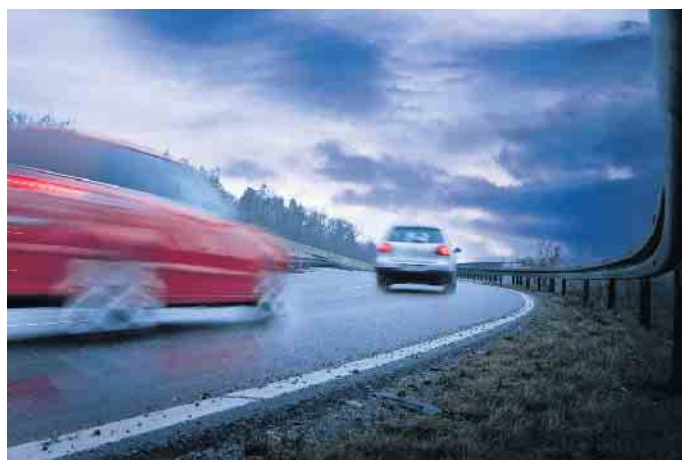
Sicher ans Ziel kommen, auch bei kritischen Witterungsbedingungen: Das eigene Fahrverhalten trägt ebenso dazu bei wie verschiedene Sicherheitssysteme im Fahrzeug.

Zusätzlich haben die meisten Autos heute elektronische Schutzengel an Bord. Sie helfen dabei, das Fahrzeug in der Spur zu halten und bei Bedarf sicher abzubremsen. Das von Bosch entwickelte elektronische Stabilitätsprogramm ESP etwa unterstützt den Fahrer in nahezu allen kritischen Fahrsituationen. Es umfasst die Funktionen des Antiblockiersystems (ABS) und der Antriebsschlupfregelung (ASR), erkennt aber auch Schleuderbewegungen und wirkt diesen aktiv entgegen. Dazu vergleicht das Steuergerät 25 Mal pro Sekunde die tatsächliche Bewegung des Fahrzeugs mit der gewünschten Fahrtrichtung und hilft, es selbst