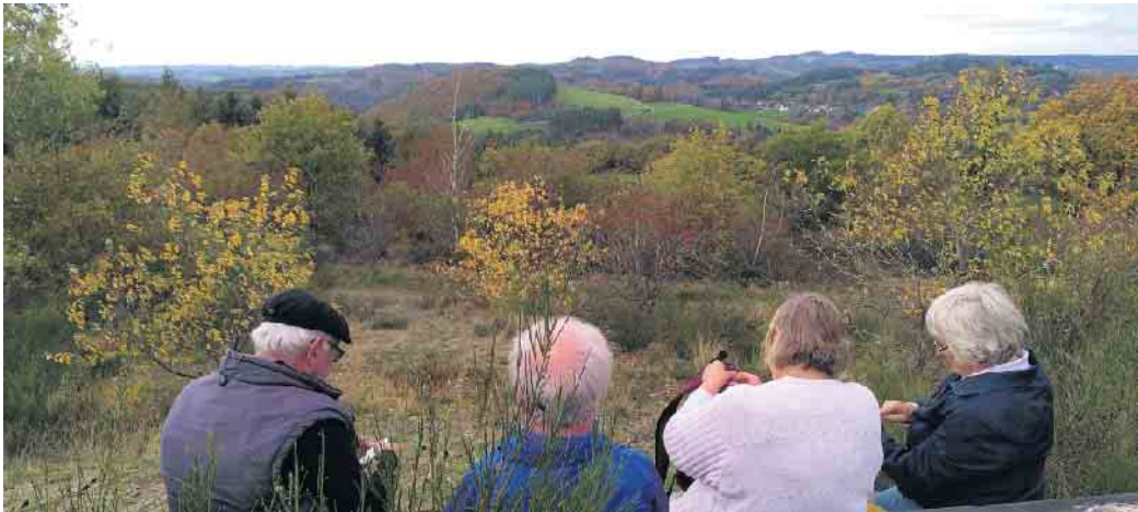
Wanderpause auf der Linder Höhe