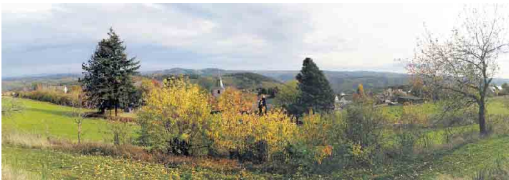
Panoramablick über Lind