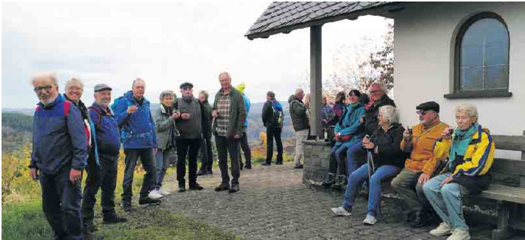
An der Krippenkapelle bei Lind

Es war ungewöhnlich warm am Sonntag, 23. Oktober, und am Ende kam auch noch die Sonne raus: ideales Wanderwetter rund um den kleinen, etwas abseits der Ahr gelegenen Ort. Pünktlich um 10 Uhr waren 27 Wanderinteressierte am Rathaus, wo der Bus schon wartete. Angekommen an der Schwanert-Hütte ging es dann los, je nach Geschmack auf eine kürzere und einer längere gemütliche Runde rund um Lind. Natürlich war für ausreichend Wanderproviand gesorgt: viele hatten für die Pausen leckere kleine Snacks mitgebracht, und für Wein und Wasser war auch gesorgt. Nach der Rückkehr zum Ausgangspunkt ging es dann nach Insul ins Landhotel Ewerz, das nach der Zerstörung durch die Flutkatastrophe 2021 gerade wieder - komplett modernisiert - neu eröffnet worden war. Hier konnten sich alle bei vorzüglichen Gerichten nochmal in lockerer Runde über die herrliche Wanderung austauschen, bevor es dann am späten Nachmittag wieder zurück ging.