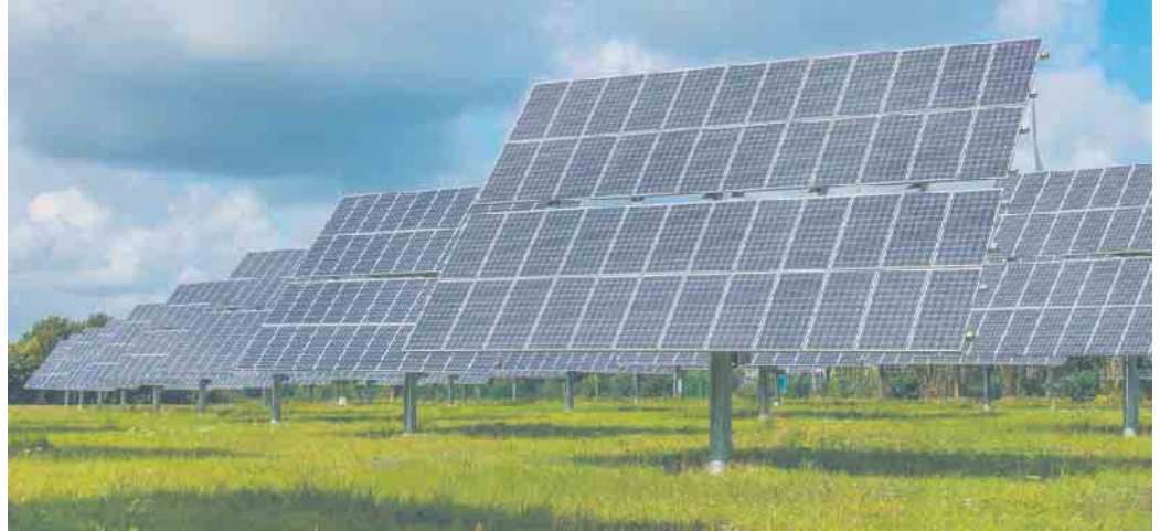
Die Technik der Photovoltaikanlagen hat sich in den letzten Jahren enorm weiterentwickelt. Ob horizontal oder vertikal, hier gibt es viele Möglichkeiten zu Anpassung an die Bedürfnisse.

Beide Änderungen sind mit der Zweckbestimmung Photovoltaik versehen. Eine andere Nutzung dieser Flächen, die sich im Bereich östlich der Autobahn 1, angrenzend an die Ortslage Neuheim befinden, ist damit ausgeschlossen. Mit den Ratsbeschlüssen wurden die planungsrechtlichen Vorausset-