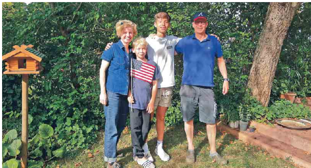
Gastfamilien schenken Austauschschüler/innen ein Zuhause auf Zeit.

sieht. Interessierte Familien finden unter www.experiment-ev.de/gastfamilie-werden ausführlichere Informationen. (akz-o)