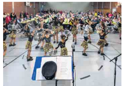
Die „Dancing Cheer Minis“ begeisterten ihr Publikum.