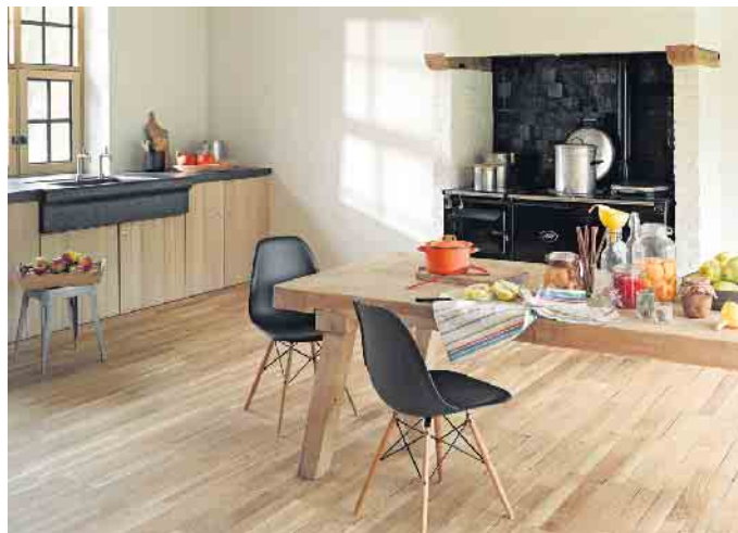
Wichtig sind Filzgleiter unter den Möbeln, um das Parkett vor Kratzern zu schützen.

um das Holz zu schützen. Stärker beanspruchte Laufwege brauchen trotz guter Pflege irgendwann eine Aufarbeitung. Bei geöltem Holz reicht eine partielle Auffrischung, bei lackiertem Holz muss die gesamte Fläche geschliffen und neu versiegelt werden. So ist der Lieblingsboden immer noch schön, wenn die Einrichtung