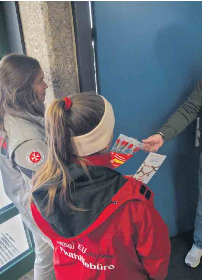
Die Johanniter geben in Weilerswist Tipps zu staatlichen Wiederaufbauhilfen, zu Spendengeldern oder zur psychosozialen Unterstützung.

Mobile Helferteams der Hilfsorganisationen Johanniter, Arbeiter-Samariter-Bund und Caritas sind wieder vor Ort, um beim Wiederaufbau, mit Spendengeldern und sonstigen Unterstützungsmaßnahmen zu helfen. Die mobile Hochwasserhilfe der drei Hilfsorganisationen Arbeiter-Samariter-Bund (ASB), Caritas und Johanniter sind bald in Weilerswist unterwegs. Sie informieren, welche weiteren Hilfen vor Ort angeboten werden. Gerade denen, die beim Wiederaufbau langsam kraftlos werden, soll durch diese Aktion geholfen werden. Die Hilfsorganisationen beschränken sich dabei nicht nur auf Informationen zur Antragstellung der staatlichen Wiederaufbauhilfe. Sie bieten auch