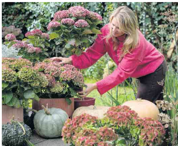
Auf der Terrasse oder vor dem Hauseingang machen sich Hortensien in Töpfen gut, kombiniert mit verschiedenen farbigen Kürbissen.