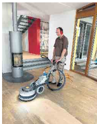
Nach einem Abschiff glänzt Parkett wieder wie neu. So kann es viele Jahrzehnte verwendet werden.

Um Kratzer auf dem Parkett zu vermeiden, sollten Tische und Stühle, Sessel und Sofas Filzgleiter erhalten. So lassen sie sich verrücken, ohne dass der Holzboden Schaden nimmt. Entsteht doch einmal eine Delle oder ein Kratzer, sollte diese Stelle repariert werden - nicht nur um die Optik zu bewahren, sondern auch