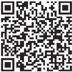
QR-Code zum Formular.

Bitte beachten Sie: Der Verbrauch ist jährlich zu melden. Bei Fragen hilft das Steueramt gerne weiter: 02254 / 9600-444 steueramt@weilerswist.de