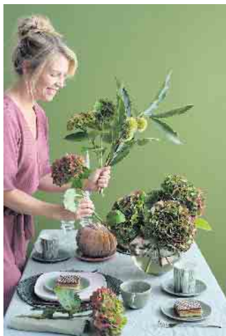
Für die Erntedanktafel kann man aus der Fülle der Natur schöpfen.