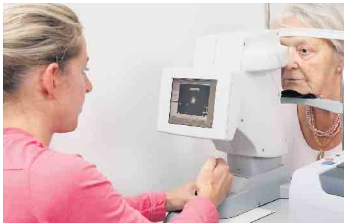
Das Auge wird eingehend untersucht und vermessen.

Kostenfreier Leistungsscheck Ihrer Augen in der „Woche des Sehens“