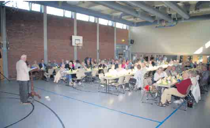
Zum Seniorenachmittag in Lommersum kamen 130 Teilnehmerinnen und Teilnehmer aus Bodenheim, Hausweiler, Derkum, Ottenheim sowie Lommersum und erlebten einen kurzweiligen Nachmittag.

Seniorinnen und Senioren trafen sich in Lommersum