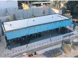
Poolbau mit Präzision.

Als Handwerker ist man derzeit in vielen Branchen gefragt - auch und ganz besonders in der Schwimmbadbranche. Hier gibt es nicht nur sichere Arbeitsplätze und faire Bezahlung, sondern etwas, das andere Wirtschaftszweige nicht bieten können: Arbeiten mit Urlaubsfeeling.