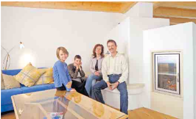
Wohlfühlklima fürs Familienheim: Der Traditionswerkstoff Lehmputz lässt sich als Trockenbausystem spielend leicht verarbeiten.

Trockenbausystemen. Auf vorgefertigten Plattenelementen aus Holzweichfaser ist der Lehm bereits mit einer Gewebearmierung aufgebracht. Die Platten können ohne umfangreiche Vorarbeiten und ohne den Einsatz größerer Wassermengen verbaut werden. Unter www.naturbo.de gibt es dazu mehr Infos und Verarbeitungstipps. Auf Holzständer oder Holzplatten erfolgt die Befestigung durch Verschrauben, auf Mauerwerk oder Gipsbauplatten lassen sich die Elemente verkleben. Auch Innen- und Trennwände können mit entsprechenden Ständerkonstruktionen erstellt werden. Die schnelle und einfache Verarbeitung spart Geld, Zeit und Material. Passende Lehm-Plattenelemente für fast jeden Einsatz