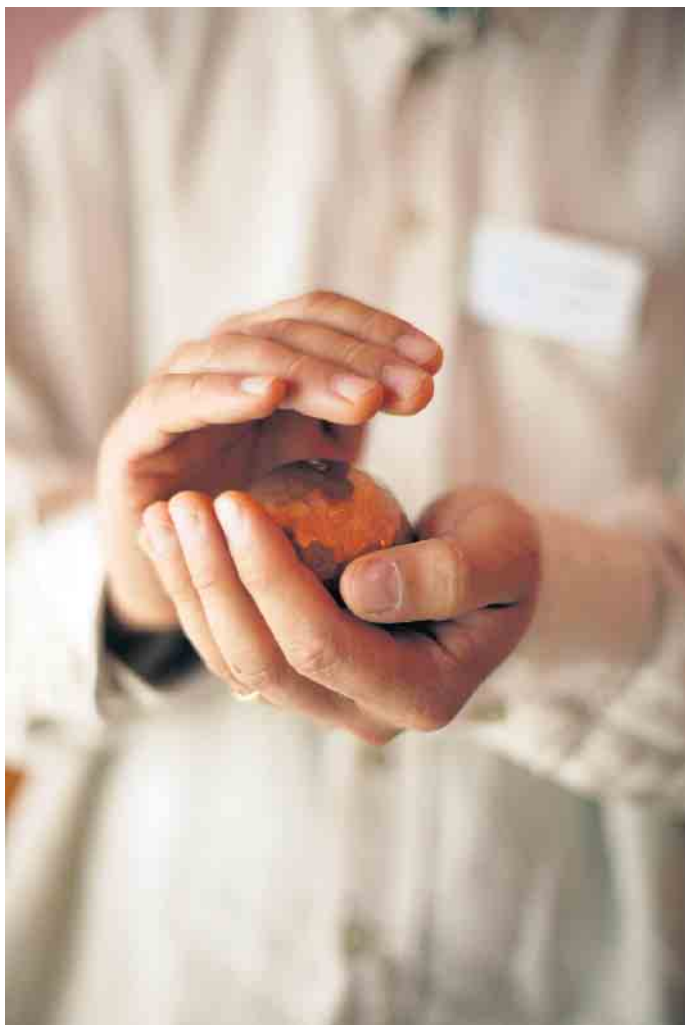
Die eigenen Bedürfnisse wahrnehmen - das unterstützt den Heilprozess.

Wie man mit gezielter Bewegungstherapie wieder zu Kräften kommt