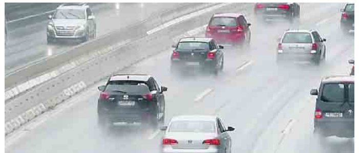
Starkregen kann zur echten Gefahr für Autofahrer werden.

Bei Sichtweiten von unter 50 Metern müssen Autofahrer auch bei Starkregen die Nebelschlussleuchte einschalten. Die maximale Höchstgeschwindigkeit beträgt auch auf Autobahnen dann nur noch 50 km/h. „Wir raten dazu, bei solch