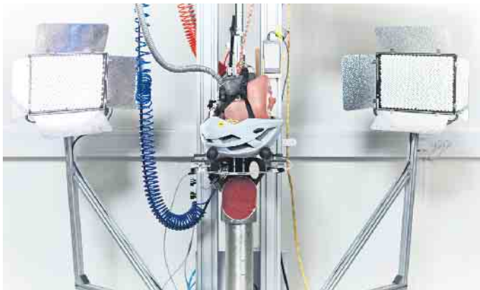
Helme werden in der Regel nur darauf geprüft, ob sie einem geraden Aufprall standhalten. Meist erfolgt der Aufprall jedoch schräg, was gefährliche Rotationsbewegungen verursachen kann.

Rotationsbewegungen auf den Kopf zu verringern. Das System ist unter anderem auch in Ski-, Reit- und Motorradhelme integriert. Unter www.mipsprotection.com gibt es weitere Infos.