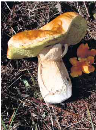
Steinpilz. Foto: © Wald und Holz NRW behörde des Kreises Euskirchen, Tel.: 02251 / 15 -964. Informationen zu den Themen Pilze sammeln und Waldsperrungen in der Region finden Sie auf den Internetseiten des Kreises Euskirchen, www.kreis-euskirchen.de und des Landesbetriebes Wald und Holz NRW, www.wald-und-holz.nrw.de .

nungswidrigkeiten dar, die durch Bußgelder geahndet werden können. Während der Herbstmonate überschneidet sich die Pilzsaison oftmals mit der Brunft des Rotwildes. Als Teil der Lebensgemeinschaft Wald ist auf das Wild beim Betreten des Waldes besonders Rücksicht zu nehmen. Damit das Wild während der Brunft möglichst ungestört bleibt, werden bestimmte Waldflächen für einen befristeten Zeitraum gesperrt. Die betroffenen Flächen werden durch entsprechende Beschilderung abgegrenzt bzw. deutlich kenntlich gemacht und sind somit für Waldbesucher - einschließlich Pilzsammler - nicht zugänglich. Vertreter der Unteren Naturschutzbehörde und des Regionalforstamtes werden während der Pilzsaison Kontrollen in den betroffenen Gebieten durchführen. Bei Fragen wenden Sie sich bitte an das zuständige Forstamt, Tel.: 02486 / 8010 -0 oder die Untere Naturschutz-