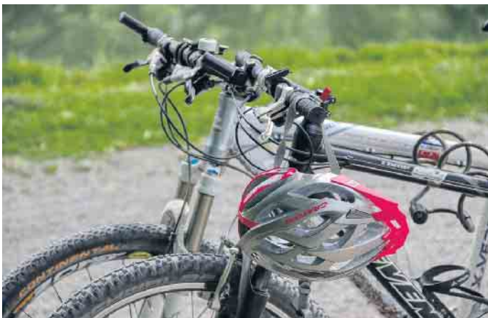
Wer sein Fahrrad auf der Anhängerkupplung seines Autos transportieren will, sollte deren Eignung überprüfen.

Denn bisher fehlt eine gesetzliche Vorschrift, diese Prüfung durchzuführen. Für die Genehmigung einer Anhängerkupplung reicht die Erfüllung der UN Reg. 55. Diese regelt jedoch nur die Bestimmungen für Kupplungen zum Ziehen von Anhängern. Ob eine ab Werk verbaute Anhängerkupplung auch für die Montage eines Fahrradträgers geeignet ist, steht meist in der Betriebsanleitung des Autos oder der Nachrüst-Anhängerkupplung. Der ADAC rät: Bei Nachrüstung einer Anhängerkupplung sollte man sich von der Werkstatt schriftlich bestätigen lassen, dass sie für die Nutzung mit Fahrradträgern freigegeben ist. Kaufinteressenten sollten besonders auf den D-Wert achten: In der