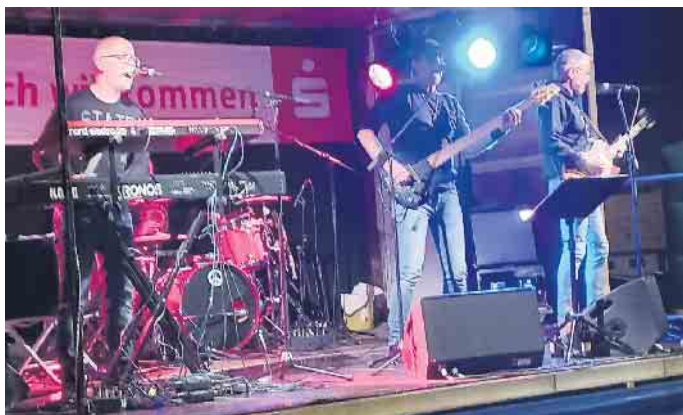
Das Stimmungs-Highlight: Die Männer von Flake