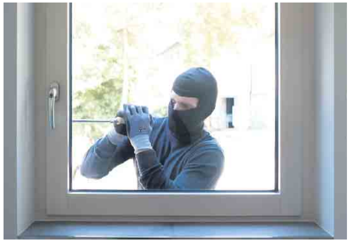
Den Einbruchversuch wirksam verhindern.

Sensoren melden offene Fenster Allzu gern verschaffen sich Einbrecher allerdings durch Zerstören des Fensterglases und einfachen