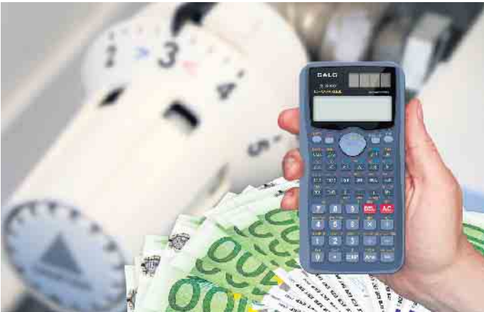
Die Energiekrise trifft nicht nur die privaten Haushalte. Auch viele Unternehmen treffen steigende Preise hart.