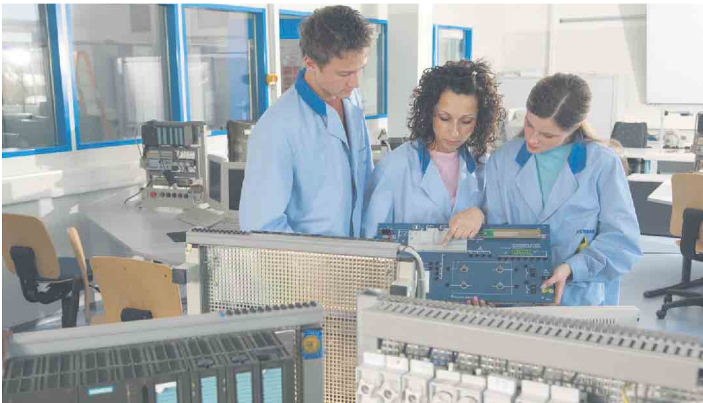
Während eines Praktikums gewinnt man Einblicke ins Berufsleben.