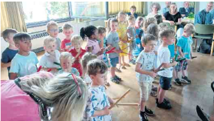
Die Kita-Kinder (Foto) und die Dritt- und Viertklässler aus Lommersum begeisterten die Seniorinnen und Senioren wieder mit ihren musikalischen Auftritten und Gedichten.