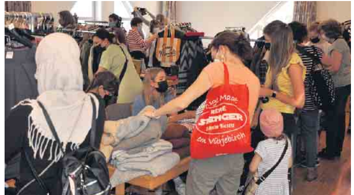
Das Flohmarkt-Team hofft am 22. Oktober auf einen genauso großen Zuspruch wie im Frühjahr.

Im Mittelpunkt beider Flohmärkte stehen Kleidung und Schuhe, aber auch Spielzeug, Bücher, Dekorationsartikel und viele andere Dinge wechseln den Besitzer. Allerdings ist Neuware verboten. „Wir haben einen ökologisch hohen Anspruch. Deshalb darf nur Gebrauchtes angeboten werden“ erläutert Scholten das Grundprinzip. Und Schumacher ergänzt: „Al-