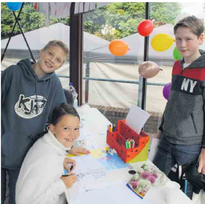
Die Mitglieder der Kinder- und Jugendparlaments der Gemeinde Weilerswist luden zu Mitmachaktionen im Haus Heskamp ein.

Kulinarisch unterstützt wurden die Veranstaltung an diesem Tag durch den Kesselhaus Foodtruck mit seinem Kesselfleisch, Currywurst und Pommes. Als „Durstlöcher“ boten die Mitglieder des Dorfverschönerungsvereins an ihrem Stand Bier und Softdrinks an.