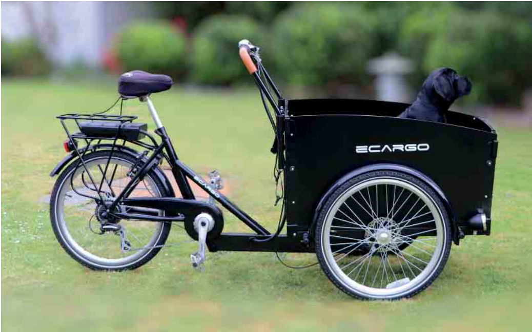
Grundsätzlich ist das Lastenrad eine sichere Methode, nicht nur Güter, sondern durchaus auch Kinder oder Tiere zu befördern.