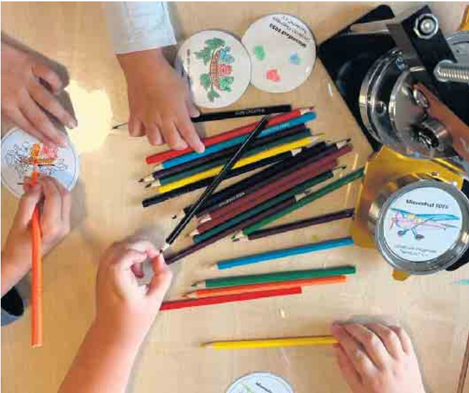
Gemeinsam für ein Miteinander: Die Groß-Vernicher Spatzen sorgten für eine abwechslungsreiche Kinderbelustigung beim Flugplatz-Wiesenfest in Weilerswist

Groß-Vernicher Spatzen sorgen für eine abwechslungsreiche Kinderbelustigung