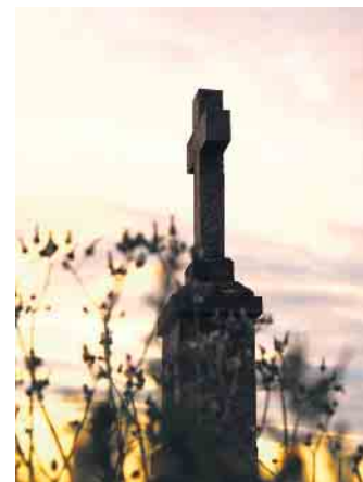
Wegekrenz Alte Römerstraße.

hergebracht werden über die Tafeln zu Hintergründen ihrer Entstehung oder Bedeutung. Gemeinsam kann entlang der Kreuze je nach Wetterlage gegangen, geradelt oder gefahren werden. An jedem Kreuz soll eine kleine Aktion stattfinden. Das können weitere Texte über die Kreuze, alte Fotos oder das Vortragen eines Gedichtes sein. Beteiligung