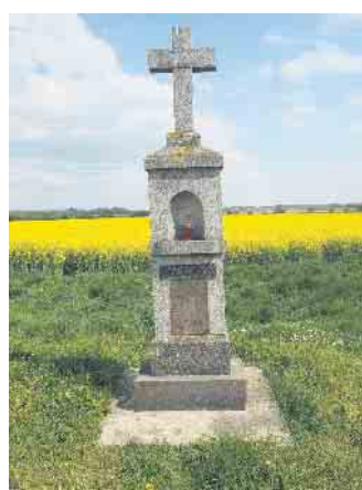
Wegekrenz Alte Römerstraße

In den drei Weilerswister Ortsteilen befinden sich acht Kreuze, die nun den Menschen etwas nä-