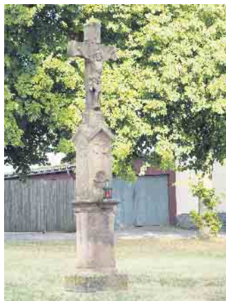
Wegekrenz in Neukirchen

Wegekreuze begegnen uns oft an Straßenkreuzungen, Feldwegen oder im Wald. Im Rheinland und Süden Deutschlands sind sie sehr häufig anzutreffen. Oft als Dank für Schutz vor Unheil gestiftet, prägen sie auch heute noch das Landschaftsbild. Diese Kleindenkmäler laden zum Innehalten und zur Andacht ein. Gedenkkreuze sind oft Erinnerung an Unglücke oder Verbrechen, während Wegekreuze, die Markierungen und Orientierung für Wallfahrer sind. Die meisten