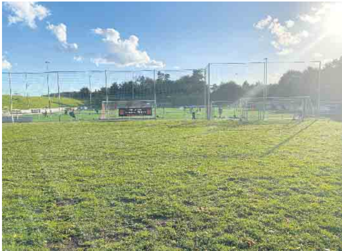
Ende des Jahres 2024 wird dort, wo jetzt noch grüne Wiese ist, ein Multifunktionsplatz für die Sportlerinnen und Sportler zur Verfügung stehen.