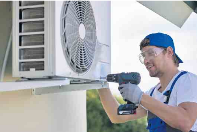
Beruf mit Zukunft: Der Anlagenmechaniker im SHK-Handwerk sorgt unter anderem dafür, dass die Dekarbonisierung im Gebäudebestand durch die Installation von umweltfreundlichen Heiztechniken vorangeht.

Unter www.die-badgestalter.de/jobs veröffentlichen die Unternehmen gemeinsam viele Infos zur Karriere im SHK-Handwerk sowie aktuelle Ausbildungs- und Jobangebote etwa für SHK-Anlagenmechaniker, kaufmännische Berufe, Fliesenleger oder Elektriker.