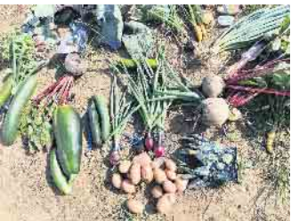
Bunte Vielfalt vom Gemeinschaftsacker: Zucchini, Möhren, Rote Bete, Zwiebeln und vieles mehr wurden gemeinsam geerntet.

Am Sonntag, den 21. September 2025, lädt die Gemeinde Weilerswist gemeinsam mit Acker e.V.