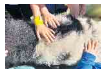
Streichleinheiten beim Ausflug zum Gertrudenhof: Die Kinder kamen den Tieren ganz nah und lernten viel über den Hof.

Im Herbst wird eine Qualitätsabfrage erfolgen und zum Ende des Jahres folgt die Abfrage zum Betreuungsbedarf in den Sommerferien 2026.