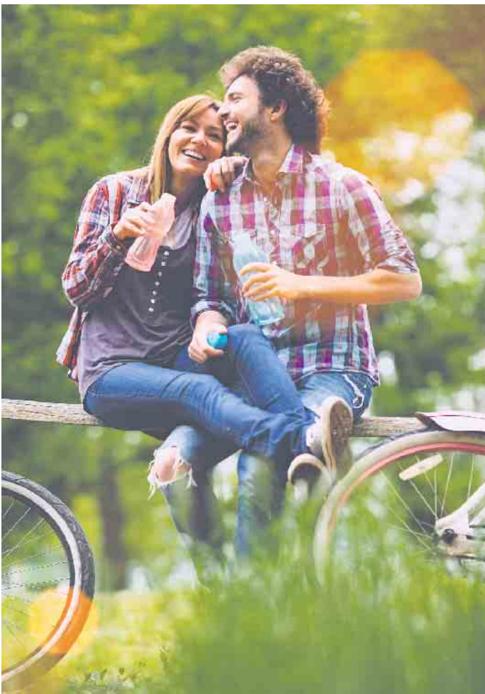
Wer mehr als eine Stunde mit dem Rad unterwegs ist, der sollte auf seinen Elektrolythaushalt achten. Am besten trinkt man alle 30 Minuten ein paar Schlucke.

Punkt ins Spiel, den man als „Otto-Normal-Radfahrer“ nicht unterschätzen sollte: das richtige Trinken während der Radtour. Wer mehr als eine Stunde mit dem Rad unterwegs ist - und das vor allen Dingen in der wärmeren Jahreszeit - der sollte auf seinen Elektrolythaushalt achten. Beim Sport ist der Bedarf an Elektrolyten wie Kalium, Natrium und Magnesium aufgrund des Schweißverlustes deutlich erhöht - die Broschüre „Sport treiben - Gesund bleiben“ unter www.vks-kalialisalz.de informiert dazu. Wie viel Schweiß und damit elektrolytische Salze ein Mensch verliert, ist individuell sehr unterschiedlich. Beeinflusst werden die Verluste durch Faktoren wie Belastungsintensität, Umge-