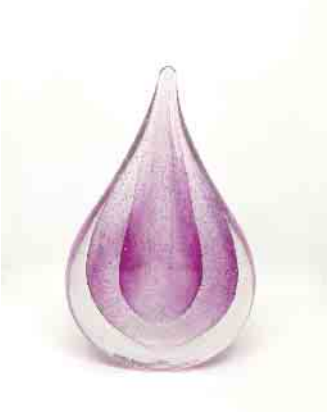
Schlicht und harmonisch: Der Tropfen zeichnet sich durch seine dezente Form aus.

Noch nicht so bekannt, aber immer beliebter sind persönliche Erinnerungsobjekte. Die sogenannte Kristallbestattung beispielsweise bietet den Hinterbliebenen eine Möglichkeit, Kristallkunstwerke als Erinnerungsstücke in der Hand halten, sie um den Hals tragen oder sie als Skulptur auf ein Fensterbrett im Wohnzimmer stellen zu können. Über die haptische Erfahrung ist das Gedenken an die verstorbene