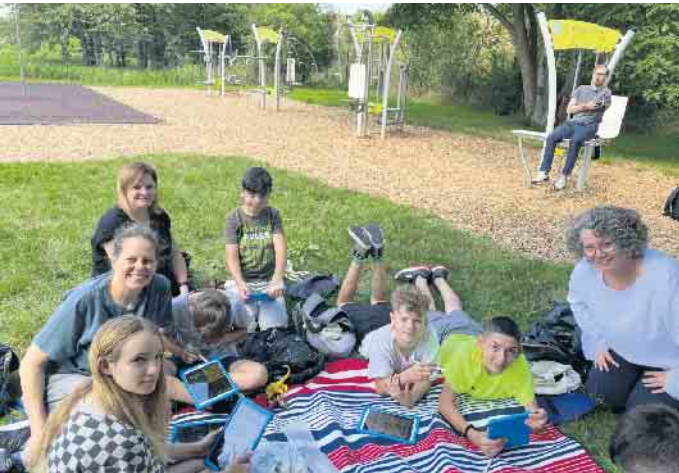
Nach der Fotosession suchten sich die Kinder ein schattiges Plätzchen, um ihre Comics kreativ zu erstellen.

anderen lesen, denn alle Comics werden in einem Heft zusammengefasst.