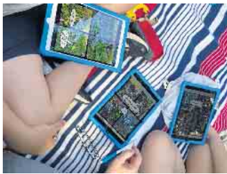
Auf Tablets erstellten die Kinder ihre ganz eigenen Comics.