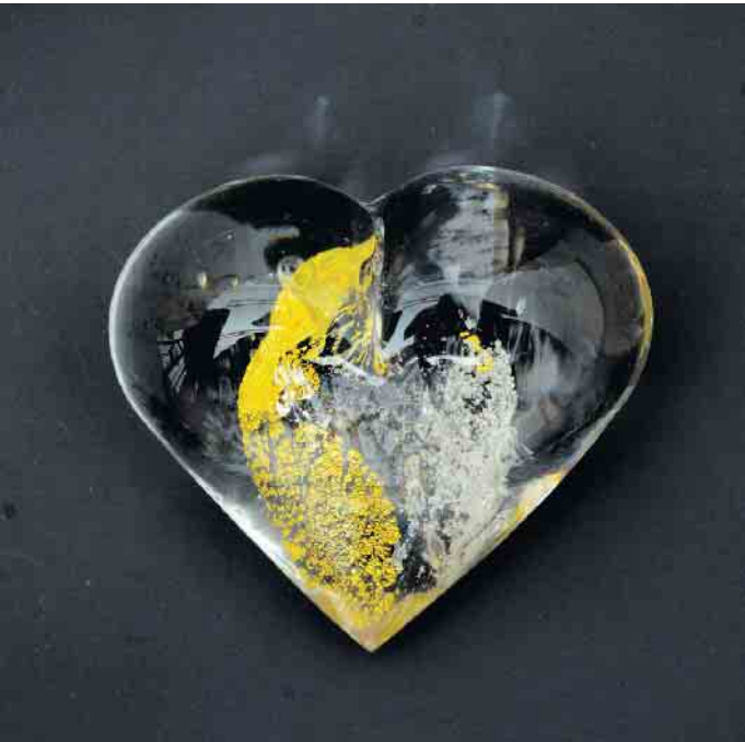
Vom Schweizer Glaskünstler Thomas Blank wurde ein goldenes Herz als Symbol ewiger Liebe entworfen.

Erinnerung für zu Hause: Kristallbestattungen als neue Form des Totengedenkens