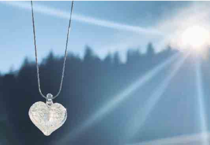
Der Herzanhänger ist zugleich ein Schmuckstück und ein Andenken.