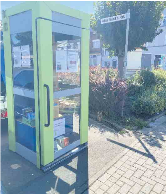
Die „Bücherzelle“ steht schon auf dem Kaiser-Wilhelm-Platz und wird gut genutzt.

38.000 Euro gab es aus dem Topf für „produktive Plätze im ländlichen Raum“. Wolfgang Nitz erklärt: „Das sind 70 Prozent der Gesamtsumme.“ Durch den Ratsbeschluss kommt der Rest des Geldes aus dem Haushalt der Gemeinde. Schon bald sollen Tisch und zwei Sitzbänke aufgestellt werden. Ganz in der Nähe des Bücherregals in der ehemaligen Telefonzelle. Die hatte die Dorfgemeinschaft geschenkt bekommen, in Steinfurt abgeholt und liebevoll restauriert. Ergänzt werden soll die „Lesecke“ durch einen Fahrradabstellplatz. Linksseitig von der Einfahrt auf den Platz soll die derzeitige „Schmuddelecke“ in ein kleines grünes Paradies verwandelt werden. „Vorgesehen sind auch zwei Fitnessgeräte, ein Trimm-Rad und ein Crosstrainer. Da die Glascontainer stehen bleiben, wird es dazu eine räumliche Trennung geben, höchstwahrscheinlich mit einer Hecke“, erläutert Wolfgang Nitz den Plan. Er glaubt nicht, dass die Aufwertung des Platzes schon am 31. Oktober 2024 zum Halloween-