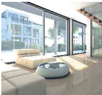
Gerade bei frei zugänglichen Terrassentüren bietet sich Sicherheitsglas besonders an.

Warum Sicherheitsglas auch zu Hause sinnvoll ist