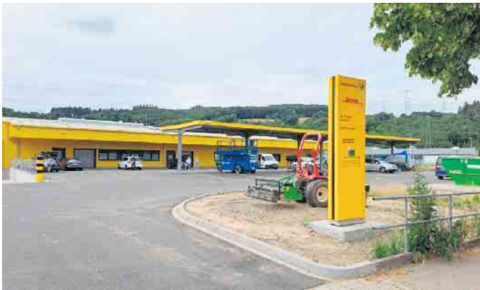
So wird der neue Zustellstützpunkt in der Bertha-Benz-Straße aussehen.

Eifeltor ab 2024 den neuen Zustellstützpunkt in Weilerswist ansteuern. Von dort aus brechen dann die Zustellerinnen und Zusteller auf in ihre 29 Verbundbezirke, das heißt die Kundinnen und Kunden erhalten Briefe und Pakete aus einer Hand. Die Menge der Sendungen, die in jeder Woche an die mehr als 18.000 Haushalte in Weilerswist und Swisttal zugestellt werden, beläuft sich auf mehr als 100.000 Briefe und knapp 15.000 Pakete.