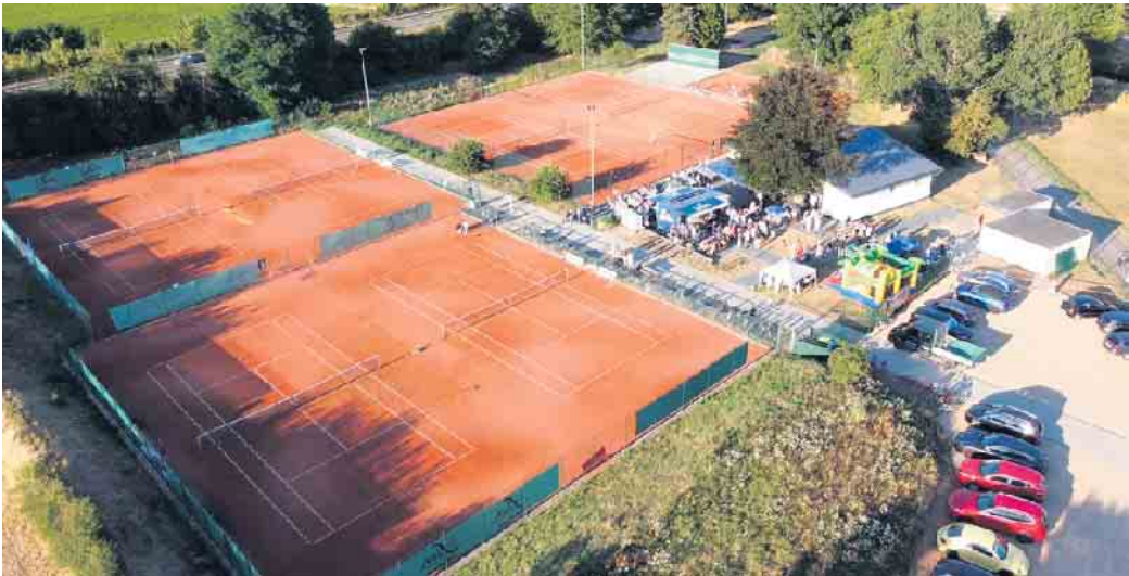
Tennisanlage des TC RW Weilerswist

Veranstaltung des Tennisclubs RW Weilerswist e.V. 1970