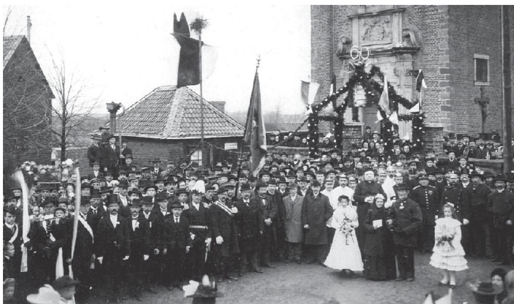
Das Foto einer Diamanthochzeit aus dem Jahre 1903 vor der Kirche in Vernich, die zum Anlass prächtig geschmückt war.