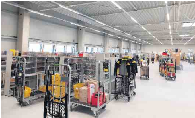
Modern und großräumig: Das Innere des Zustellstützpunktes.