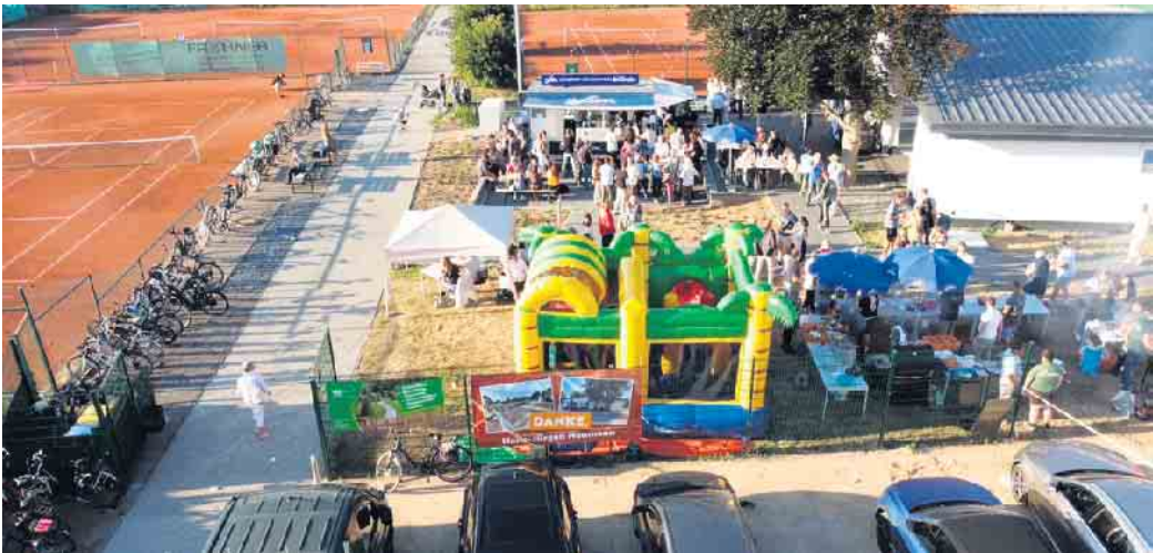
Eindruck vom Sommerfest 2022