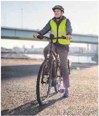
Jede fünfte Person über 55 Jahren besitzt einer Studie zufolge mittlerweile ein Pedelec.

überwiegend Situationen ein, in denen sie die Kontrolle über das Fahrzeug verlieren können, etwa witterungsbedingt auf rutschigen Straßen, durch Unterschätzung der Geschwindigkeit in Kurven und im Allgemeinen durch höhere Geschwindigkeiten, die dank der elektrischen Tretunterstützung mit einem Pedelec erreicht werden. (DJD)