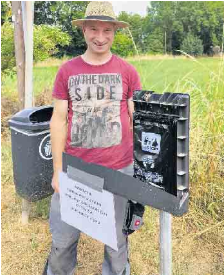
Ein Bauhofmitarbeiter entdeckte beim Entleeren der über 50 Dog-Stations im Gemeindegebiet ein kleines Wespennest.

Dass die „grünen Themen“ inzwischen auch immer mehr gelebt werden sieht man auch am Beispiel des Artenschutzes: Als ein Mitarbeiter des Bauhofes letzte Woche beim Nachfüllen von Hundekotbeuteln auf ein kleines Wespennest stieß (siehe Foto), wurde es nicht mit Insektiziden bekämpft, sondern, wie selbstverständlich, ein zertifizierter Fachberater für Hornissen-