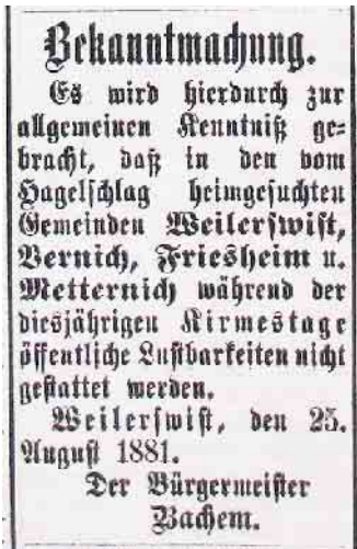
Zeitungsausschnitt aus dem Jahr 1881 zur Absage der Kirmes.

Das Bildarchiv umfasst zurzeit rund 200 Postkarten und 5800 Fotos von den Orten Lommersum, Metternich, Müggenhausen, Vernich und Weilerswist.