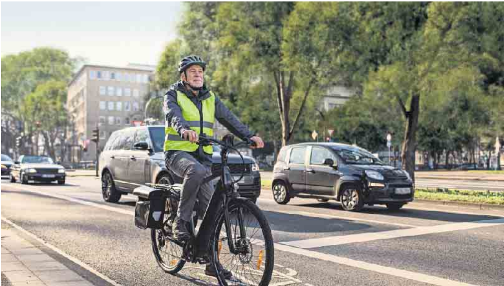
Die bundesweite Kampagne „Tour de Freude - sicher unterwegs mit dem Pedelec“ will Unfällen mit dem Pedelec vorbeugen.

Bundesweite Kampagne will Unfällen mit Elektrofahrrädern vorbeugen