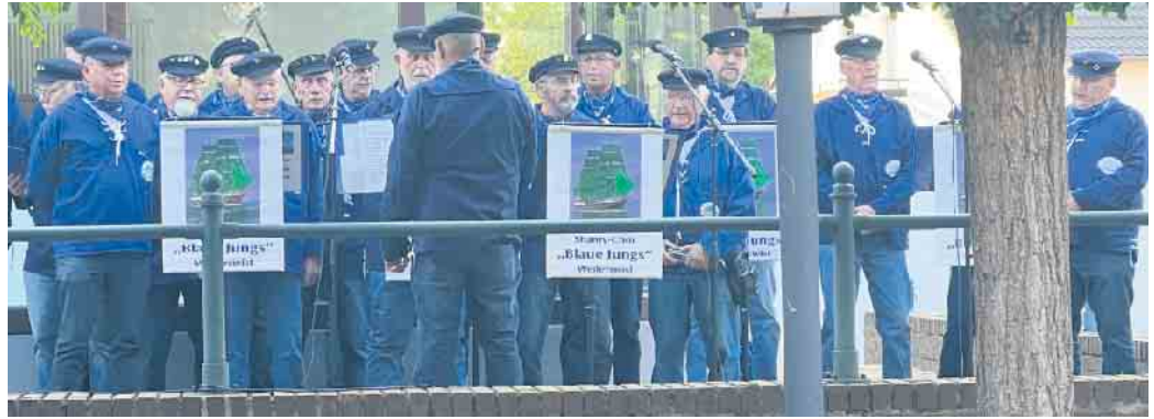
Der Shanty Chor „Blaue Jungs“ beteiligte sich an dem Gedenkkonzert ebenso wie das Tambourcorps Edelweiß Weilerswist von 1912