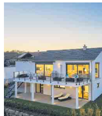
Keller werden heute zum Wohlfühlwohnen genutzt.

Die Kosten für ein unterkellertes Haus liegen ungefähr 20 Prozent höher als bei einem Haus ohne Keller. Die Wohnfläche vergrößert sich jedoch um beachtliche 40 Prozent. Je nach Topografie und Straßenführung kann der Keller mit ebenerdiger Anbindung zum hangseitigen Garten des Grundstücks ausgestattet sein. In einer Souterrainwohnung kann hier durch große Fenster und Türen reichlich Sonnenlicht ins Innere des Wohnbereichs strömen und eine barrierefreie Terrasse leicht zugänglich positioniert werden. Eine Alternative hierzu ist ein sogenannter Lichthof, der beispielsweise über eine Rampe barrierefrei erschlossen werden kann. In die bergseitigen Räume des Kellers können Sonnenlicht und frische Luft etwa durch Lichtschächte gelangen. Schlaf- und Badezimmer sind in diesem Bereich der Wohnung sinnvoll platziert und bleiben an heißen Sommertagen vergleichsweise kühl. GÜF/FT