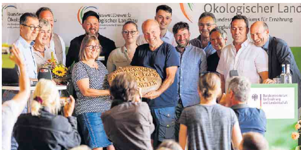
Große Freude herrschte bei der Delegation des Biohof Bursch bei der Preisverleihung.