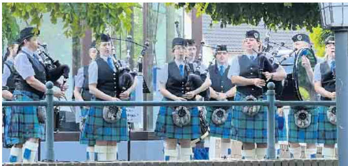
Die Dudelsack-Bläser und Trommler der 1st Thistle Highlanders Drums and Pipes spielten getragene Weisen für die Opfer der Flutkatastrophe