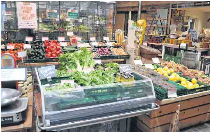
Immer frisch, knackig und schmackhaft - das vielfältige Gemüseangebot in bester Demeter-Qualität.