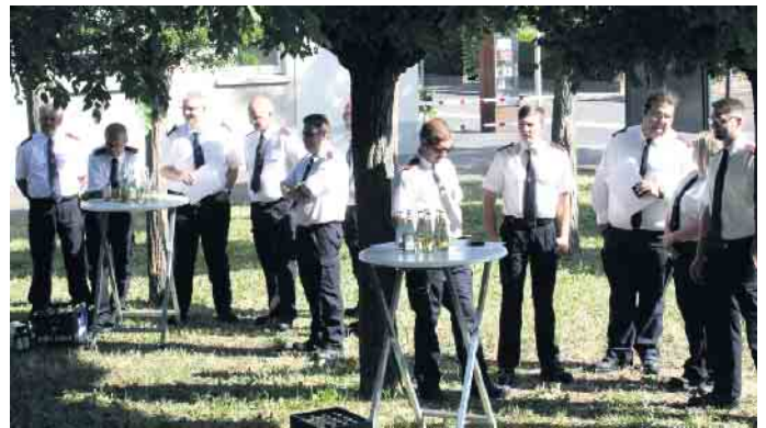
Im Hochzeitsgarten neben dem Rathaus hatten sich Feuerwehrfrauen- und -männer eingefunden, um ihre Verdienstmedaille in Empfang zu nehmen

phase unmittelbar nach der Flutkatastrophe, so Bürgermeisterin Horst in ihrer kurzen Ansprache, seien Aufgaben zu meistern gewesen, die sie sich so vorher nicht hätte vorstellen können. „In der dramatischen Situation waren die Kameradinnen und Kameraden der Freiwilligen Feuerwehr als erstes vor Ort. Vor allem Ihnen, Ihrem Einsatz und Ihrer Umsicht ist es zu verdanken, dass wir in unserer Gemeinde keine Todesopfer beklagen mussten und keine noch größeren Schäden entstanden.“ Genauso habe sie aber auch für die Rettungskräfte - aufgrund fehlender Erfahrung und dem kaum abzuschätzenden Risiko - gebangt, dass alle wieder heil aus den Einsätzen zurückkommen. Dafür dankte die Bürgermeisterin auch im Namen aller Bürgerinnen und Bürger - an diesem