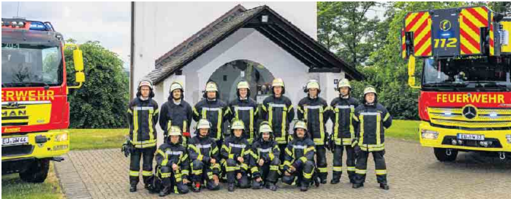
Auf eine fröhliche Feier mit vielen Weilerswister Bürger:innen freut sich die Löschgruppe Weilerswist bei ihrer „Summernight“ am 27. August.

Zu einer Summernight-Party lädt die Löschgruppe Weilerswist für Samstag, 27. August, ganz herzlich ein. Nachdem in den letzten beiden Jahren wegen Corona keine Veranstaltungen durchgeführt werden konnten, möchte die Löschgruppe in diesem Jahr mit der „Summernight“ wieder mit den Bürgern und Bürgerinnen von Weilerswist in Kontakt treten. Los geht es um 17 Uhr im Außenbereich der Feuerwache auf der Bonner Straße 33. Der Eintritt ist frei. Die musikalische Gestaltung übernimmt DJ PeteP. Neben kalten Getränken, Bier vom Fass und einer Cocktail-Bar wird die Löschgruppe auch einen Imbiss anbieten. Für die kleinen Besucher steht eine Hüpfburg bereit. Die Feuerwehrfrauen und -