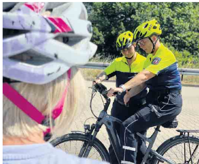
Kostenfreie Pedelec-Trainings für Seniorinnen und Senioren ab 65 Jahren - Polizei Euskirchen erweitert Angebot erstmals kreisweit.

Kreis Euskirchen (ots) Die Polizei Euskirchen bietet in diesem Sommer erstmals in dieser Anzahl und kreisweiten Verteilung kostenfreie Pedelec-Trainings für Seniorinnen und Senioren ab 65 Jahren an - sowohl im Nord- als auch im Südkreis. Ziel ist es, älteren Verkehrsteilnehmenden ein sicheres und selbstbewusstes Fahren mit dem Pedelec zu ermöglichen. Pedelecs erfreuen sich bei Jung und Alt wachsender Beliebtheit -