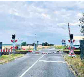
Am Bahnübergang Mehlemer Straße kam es zu sicherheitsrelevanten Störungen.

In den vergangenen Wochen kam es am Bahnübergang Mehlemer Straße wiederholt zu sicherheitsrelevanten Störungen. Der Gemeindeverwaltung wurde berichtet, dass sich die Schranken teilweise nicht ordnungsgemäß schlossen und Warnsignale ausblieben, obwohl sich ein Zug näherte. Die Deutsche Bahn wurde von Sei-