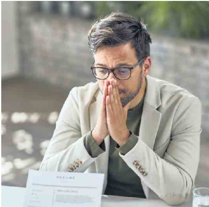
Schwindeln im Vorstellungsgespräch? Eher keine gute Idee. Besser ist es, seine Wissenslücken zuzugeben - oder sie vorab mit einer Weiterbil-

Arbeitgeber schätzen nicht nur Bewerber, die über fundierte Kenntnisse in Office-Anwendungen verfügen, sondern auch Ehrlichkeit und Offenheit. Eine Aussage wie „In Excel bin ich noch nicht so fit, aber ich mache gerade eine Weiterbildung“ wird von Arbeitgebern deutlich lieber gehört als der Satz „Da bin ich Profi“, der sich im Arbeitsalltag dann als falsch herausstellt. Hier gilt das Motto: Mut und Offenheit zur Wissenslücke - oder besser noch im Vorfeld Lücken schließen. (DJD)