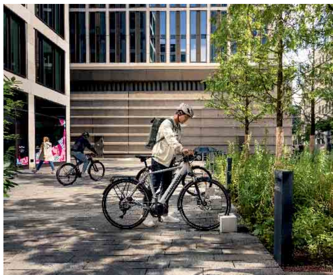
Sorgenfreier unterwegs: Mit einem digitalen Diebstahlschutz wird das Abstellen von E-Bikes noch sicherer.

Für ein sorgenfreieres Abstellen sorgt zusätzlich die Möglichkeit, jederzeit den Standort und den Sicherheitsstatus des E-Bikes zu überprüfen. Zusätzlich dient ein Sicherheitsfeature zum Deaktivieren der Motorunterstützung. Ob es aktiv und damit die Motorunterstützung deaktiviert ist, signalisieren kurze Töne, Lichter und Symbole auf der Bedieneinheit LED Remote, dem Display oder Smartphone. Unter www.bosch-ebike.com/de/produkte/ebike-protect gibt es weitere Tipps für einen wirksamen Diebstahlschutz fürs E-Bike. (DJD)