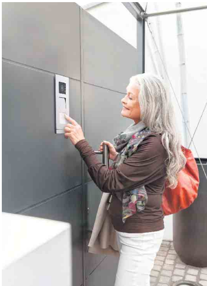
Viele Smart-Home-Funktionen können das Leben deutlich erleichtern und sicherer machen.

Die vorausschauende Planung und Installation durch einen Elektrofachbetrieb schafft gute Voraussetzungen, um eine Vielzahl von Komfort- und Sicherheitsfunktionen schnell einbauen und problemlos nachrüsten zu können. Durch Elektroinstallationsleerrohre lassen sich Elektro- und Kommunikationsleitungen jederzeit nachträglich einziehen. Eine hohe Anzahl von Steckdosen - auch in der Küche, im Bad oder an Treppen - erleichtert den Einbau von Assistenzsystemen wie Treppen- oder Wannenliften und anderen Vorrichtungen zur Höhenverstellung. Schalterdosen mit größeren Montagetiefen erlauben eine einfache Umrüstung von Schaltern auf automatisch schaltende Präsenz- oder Bewegungsmelder. (djd)