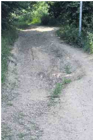
Diese Ausspülungen sind für Radfahrer teils gefährlich - sie sollen mit der Sanierung des Erfttradweges wieder in einem befahrbaren Zustand.

ein „Leuchtturm“ eingerichtet, an dem Sie ebenfalls alle wichtigen Informationen erhalten. Bitte achten Sie immer auch auf die Sirensignale, die Sie rechtzeitig auf Katastrophenlagen hinweisen. Die Funktion und Reichweite der hiesigen Sirenen sind durch die Sirenen-Warntage geprüft worden. Deren Reparatur, Ersatz- und Neubeschaffung wurden mit Fördermitteln veranlasst, beziehungsweise sind bereits geschehen. Die Bedeutung der Sirenen-Alarmtöne ist hier abrufbar: https://www.im.nrw/themen/gefahrenabwehr/warnung-und-sirenen/sirenen . Sollte es wieder zu einer Katastrophe wie im Juli 2021 kommen, ist zumindest nun die Kommunikation auf ein beruhigendes Level gehoben.