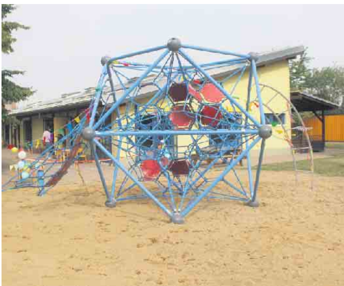
Das Spielgerät wurde in den letzten Wochen im Außenbereich der Einrichtung installiert