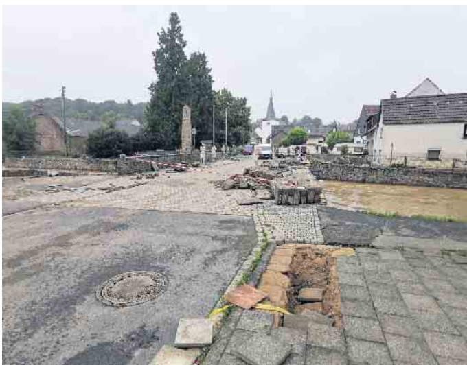
Die Brücke in der Bergstraße war schwer mitgenommen. Sie soll nach der Brücken-Sanierung in der Drei-Eichen-Straße ebenfalls wiederhergestellt werden.

Die Freiwillige Feuerwehr in Weilerswist bekam derweil ein neues Boot, das in Lommersum beheimatet ist. Es ist mit den Rettungsbooten der DLRG zu vergleichen und auch bei Niedrigwasser einsatzfähig. Zurzeit werden 16 Feuerwehrleute regelmäßig im Umgang mit dem Boot geschult. Die Schulungen finden, auch in Zusammenarbeit mit der DLRG, auf dem Zülpicher See und dem Rhein