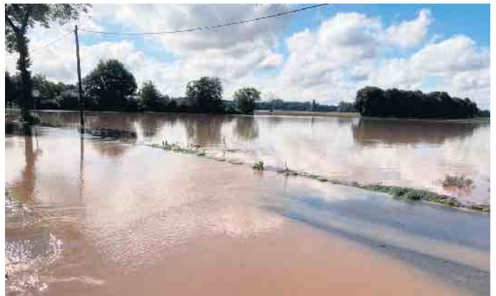
Vor zwei Jahren am 14./15. Juli 2021: Die Straßen waren überschwemmt. Aber noch viel schlimmer: Die Bürger:innen verloren ihre Wohnung, ihre Heimat!