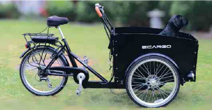
Grundsätzlich ist das Lastenrad eine sichere Methode, nicht nur Güter, sondern durchaus auch Kinder oder Tiere zu befördern.

Eines ist klar: Grundsätzlich ist das Lastenrad eine sichere Methode, nicht nur Güter, sondern durchaus auch Kinder oder Tiere zu befördern. Es gilt lediglich, wie bei jeder Teilnahme am Verkehr, Regeln zu beachten, bestimmte Sicherheitsmaßnahmen zu treffen und mit dem Transportmittel umgehen zu können. Experten empfehlen daher, sich als erstes mit dem neuen Rad vertraut zu machen: Wie verhält es sich auf der Straße, zum Beispiel beim Abbiegen oder bei der Auffahrt auf Erhöhungen? Eine Leerfahrt entwickelt ein besseres Gefühl für Fahren, Lenken und Bremsen. Welche Bestimmungen sieht die Straßenverkehrsordnung vor? Ein Cargo-Bike mit Elektroantrieb bis 25 Stundenkilometer wird wie ein Fahrrad behandelt und gehört daher auf den Radweg, sofern dessen Nutzung vorgeschrieben ist. Alle E-Modelle, die schneller fahren können, müssen auf der Straße fahren. Eine Ausnahme zum verpflichtenden Fahrradweg ist nur vorgesehen, wenn das Rad zu breit ist oder die Qualität des Weges nicht zumutbar. Außerdem dürfen Lastenradfahrer auf dem Gehweg fahren, wenn sie unter Achtjährige begleiten. Wie nehmen mich andere Verkehrsteilnehmer wahr? Hier gilt es die Sichtbarkeit zu überprüfen; Reflektoren an Rad und Kleidung oder Fahnen zum Beispiel sorgen für Aufmerksamkeit. Aber es geht auch um das eigene vorausschauende Fahren: Da sich der Lastenkorb gewöhnlich in der Front befindet, schiebt dieser sich in den Verkehr, bevor der Radler den richtigen Einblick hat.