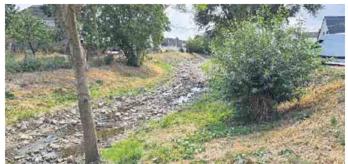
Ein Foto aus dem vergangenen Jahr, als die Erft stellenweise kaum noch Wasser führte. In diesem Sommer sieht es nicht viel besser aus.

Der Kreis weist deshalb im Interesse des Gewässerschutzes noch einmal auf die bestehende Rechtslage hin: Die Entnahme von Wasser aus oberirdischen Gewässern bedarf nach den geltenden gesetzlichen Bestimmungen grundsätzlich einer wasserrechtlichen Erlaubnis, die vorher zu beantragen ist. Die mechanische Wasserentnahme, also mittels Pumpe, aus Oberflächengewässern ist verboten und kann im Einzelfall mit einem Bußgeld von bis zu 50.000 Euro geahndet werden. Die Unte-