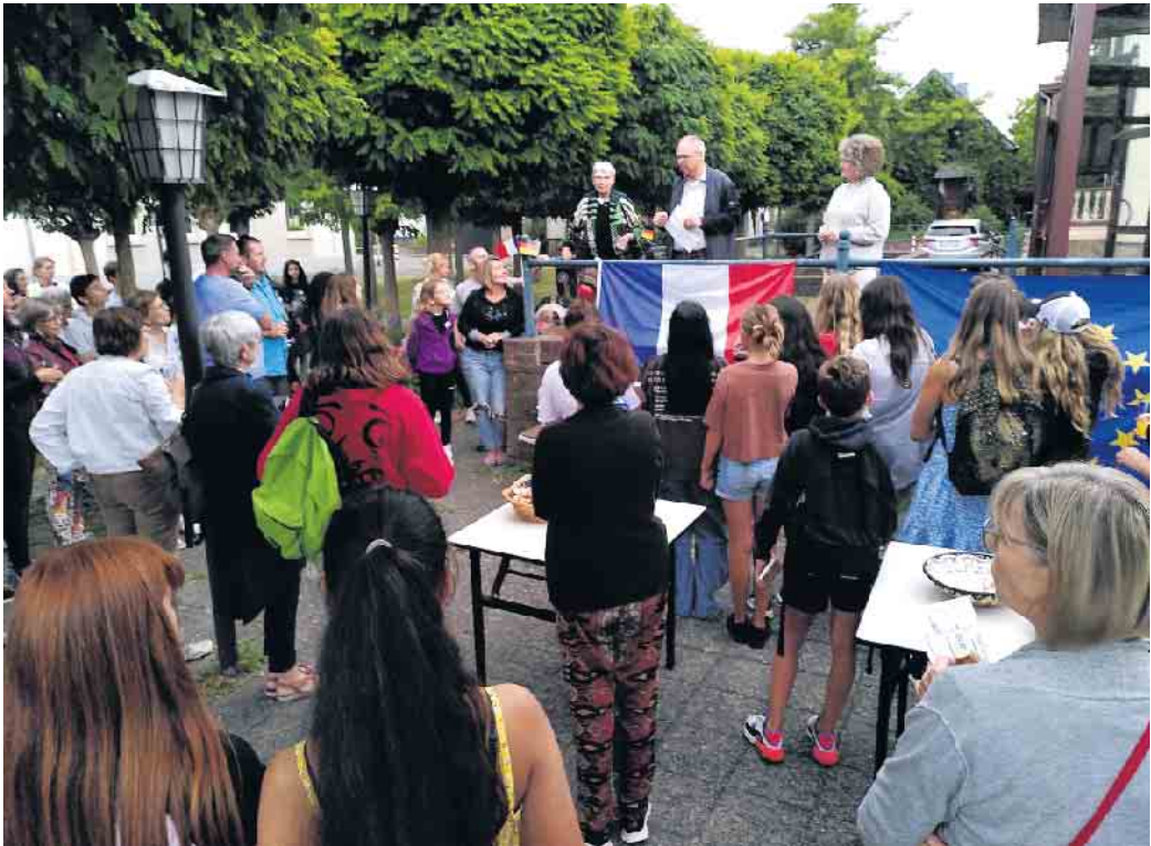
Begrüßung der Carqueiranner am Haus Heskamp

18 Schülerinnen und Schüler aus Carqueiranne zu Besuch