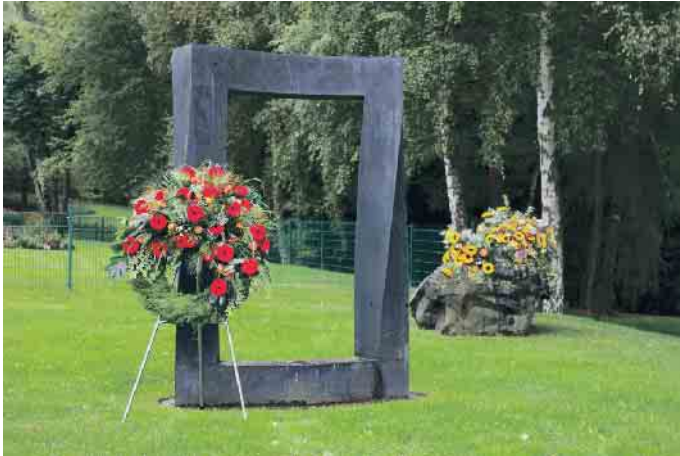
Tor zwischen den Welten.

Früher waren Krankheit, Sterben und Tod in der Großfamilie unter einem Dach vereint, genauso wie