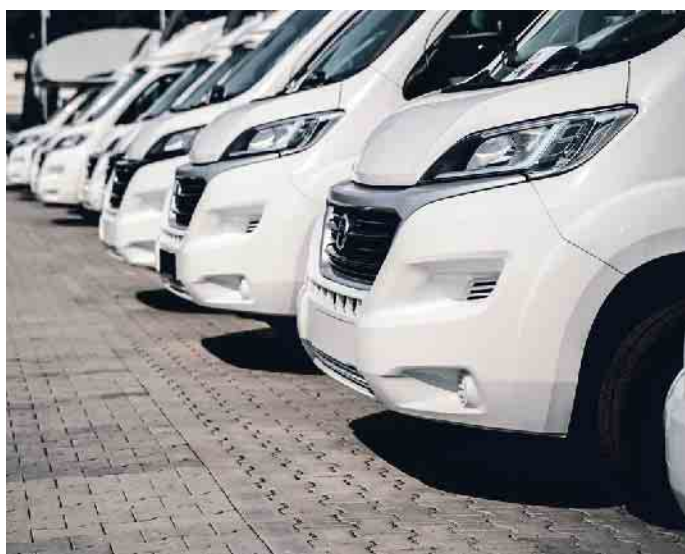
Wohnwagen sind aktuell sehr beliebt.

Innenräume werden zusätzlich zur sowieso fälligen Grundreinigung desinfiziert. Und eine solche Säuberung dauert deutlich länger und lohnt sich nur, wenn ein Fahrzeug über einen längeren Zeitraum am Stück vermietet wird. (mid/ak-o)