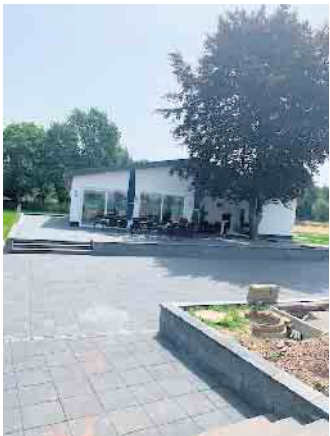
Das neu errichtete Clubhaus

Am Samstag, 6. August, feiert der Tennisverein TC RW Weilerswist e.V. 1970 die Wiedereröffnung der Anlage nach der katastrophalen Flut im Juli 2021. Die nahe der Erft gelegene Anlage wurde im letzten Jahr durch die Wassermassen nahezu komplett zerstört. Einige Tennisplätze konnten zwar mit viel Arbeit und Unterstützung der Mitglieder für den Spielbetrieb wiederhergestellt werden, die restlichen Plätze waren aber durch die Flut so schwer beschädigt, dass sie komplett neu aufgebaut werden mussten. Das Clubhaus war durch Unterspülung der Bodenplatte aus Beton und Abriss sämtlicher Zuleitungen nicht zu retten und musste vollständig abgerissen werden. Auch die Inneneinrichtung war durch Wasser unbrauchbar geworden. Die Planung und