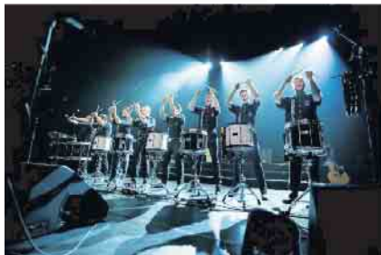
Die Drummerholics Spaß mit Trommel & Tempo