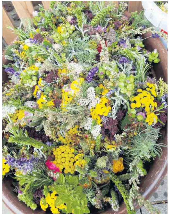
Fertig gebundene Sträuße.