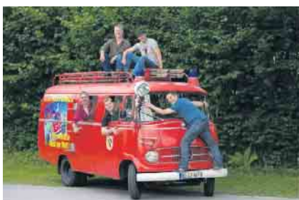
Die Street Kings Der Feuerwehr-Oldtimer mit Schwung und guter Laune