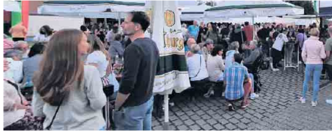
Am Festsamstag 2022

und fröhlicher Stimmung aus. Die Schützen möchten sich auch auf diesem Wege bei allen Helfern bedanken, die zahlreich dazu beigetragen haben, dass das