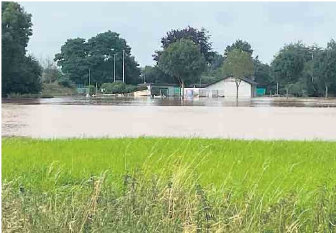
Das Clubhaus am Tag der Flut

Sommerfest am 6. August anlässlich der Wiedereröffnung der Anlage nach der Flut