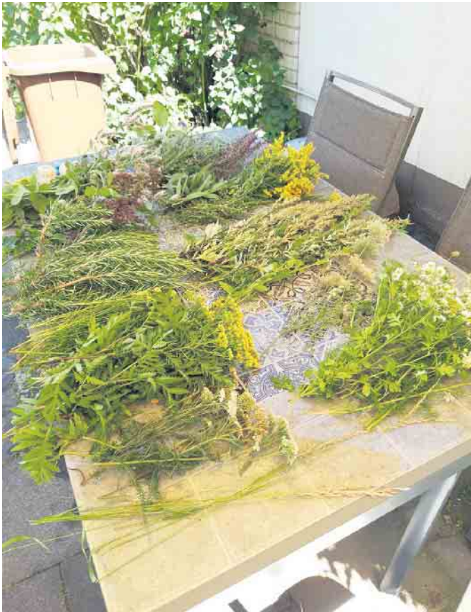
Unterschiedliche Kräuter.

Wir freuen uns auf eine rege Beteiligung.