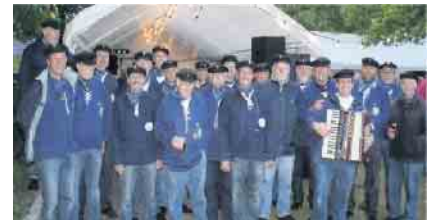
Die Blauen Jungs Weilerswist Stimmgewaltig, melodisch und zum Mitsingen