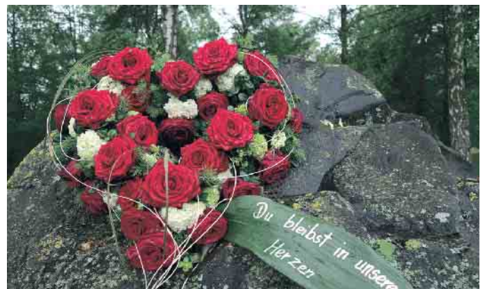
Gedenken Blumenherz.