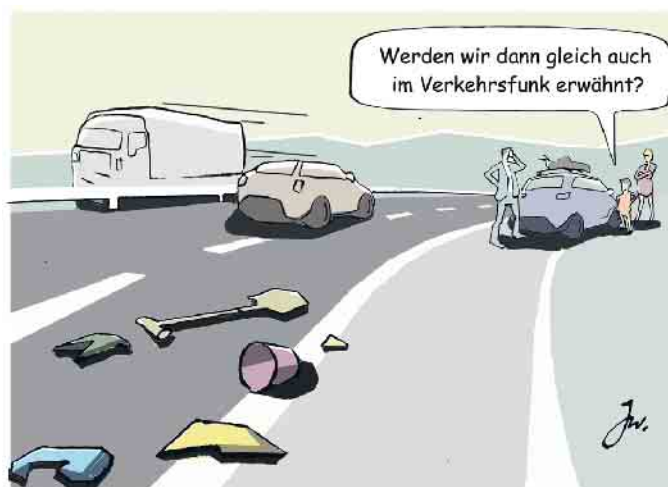
Kaum zu glauben, was so alles auf den Fahrbahnen herumliegt.