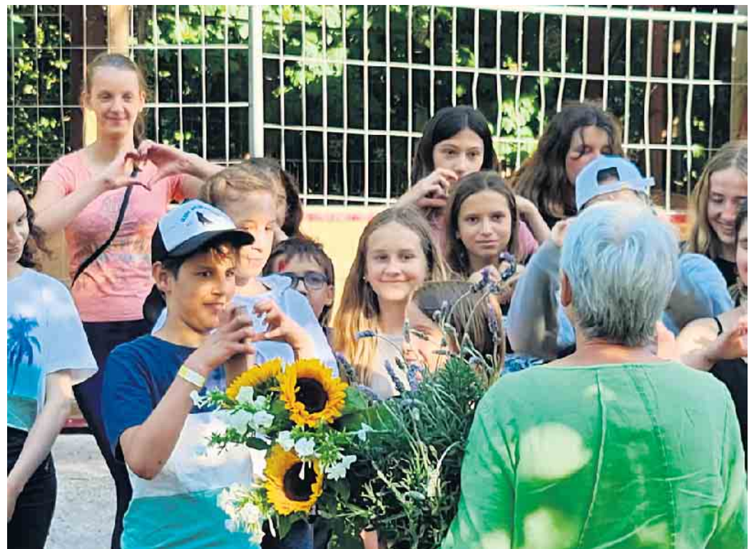
Abschiedsabend auf dem Boule-Platz

Herbst in Carqueiranne Wiedersehen feiern können - als Teilnehmer einer großen, vierzigköpfigen Delegation der der Weilerswister Partnerschaftsgesellschaft!