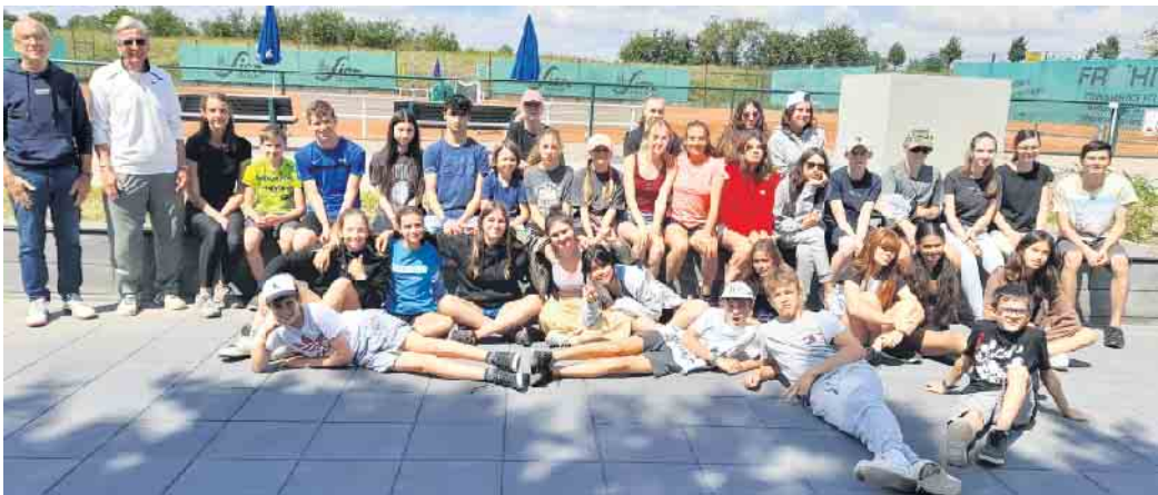
Besuch des Tennisclubs Rot-Weiß