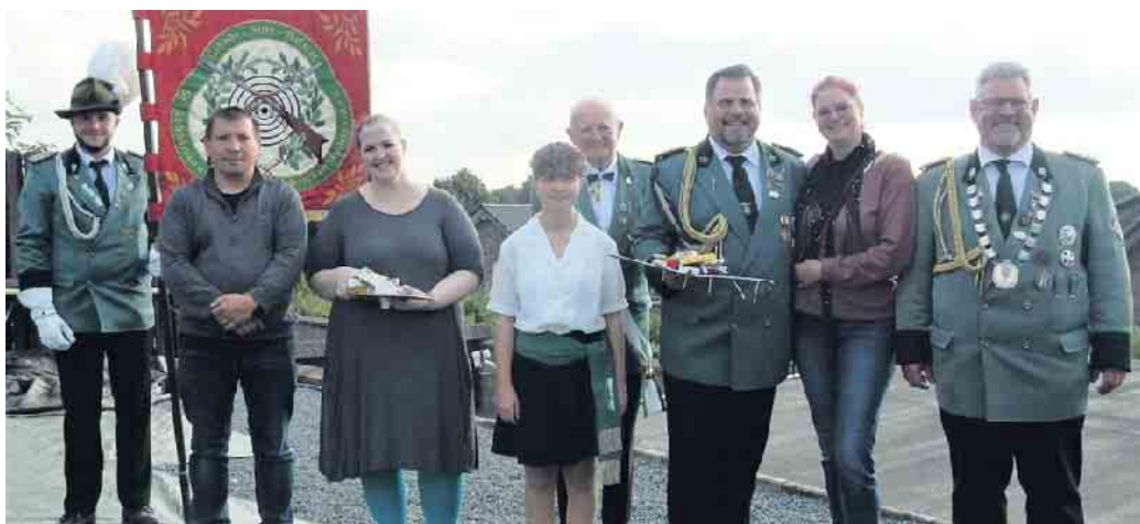
Die neuen Majestäten 2022

Am Montag trafen sich die Schützen um 10 Uhr am Schützenheim um gemütlich miteinander zu Frühstück, welches von den aktiven inaktiven Schützendamen zubereitet worden war. Gut gestärkt wurde im Anschluss auf den Höhepunkt des Festes am Nachmittag mit dem Ausschießen der neuen Majestäten hingearbeitet.