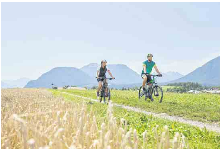
Nach längeren Ausflügen kennen die meisten Radlerinnen und Radler das Phänomen, dass Po, Rücken und Nacken immer wieder mal schmerzen. Mit der richtigen Einstellung des Bikes lässt sich das vermeiden.

1. Bei der Anschaffung eines neuen Rades nicht sparen Wer sein Fahrrad schmerzfrei nutzen will, sollte bei der Anschaffung nicht sparen, das gilt für „normale“ Räder ebenso wie für E-Bikes. Hochwertige Modelle haben ihren Preis - dafür kann man auch lange Freude an ihnen haben. Bei Billigmodellen ist der Ärger oft schon vorprogrammiert. Wer sich hauptsächlich für den Weg zur Arbeit, zum Einkauf oder für die Wochenendtour aufs Rad schwingt, ist mit einem Citybike gut ausgestattet. Wer komfortabel längere Strecken unterwegs sein möchte, für den ist ein Trekkingrad die beste Wahl. Sportler und Geländefahrer entscheiden sich für ein Mountainbike.