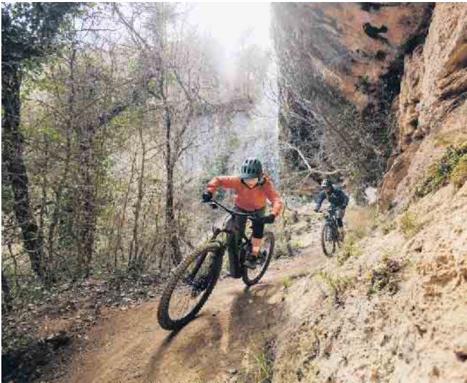
Das E-Bike ist das passende Trainingsgerät für alle, die gezielt ihre Fitness verbessern möchten.

wichtigsten Informationen zählen unter anderem Höhendaten, Leistungswerte, die Trittfrequenz und die Anzeige der verbrannten Kalorien. So sehen E-Biker, ob sie gerade über oder unter ihrer persönlichen Leistung und Trittfrequenz fahren und können auf diese Weise ihr Sportprogramm optimieren. Mit dem richtigen Training ist das E-Bike ein effektiver Fettverbrenner und Fitnessturbo. Wichtig dabei: Gerade Einsteiger sollten sich realistische Ziele setzen und sich zu Beginn nicht überfordern. Zudem sollten sich auch Sport-Enthusiasten zwischen jeder intensiven Einheit ein bis zwei Ruhetage zur Regeneration gönnen. Ein weiterer Tipp: E-Biken in der Gruppe macht noch mehr Spaß und fördert erfahrungsgemäß die persönliche Motivation. (DJD)