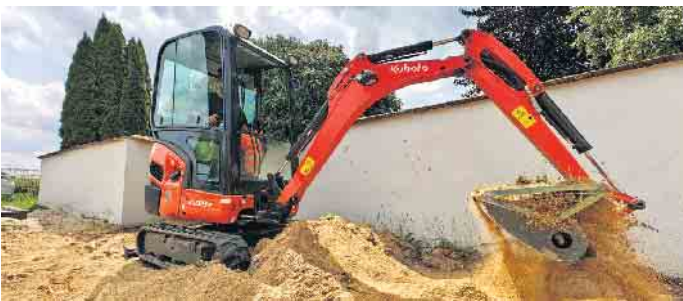
Mitarbeiter des Bauhofs lockerten den Sand auf den Spielplätzen mit „großen“ Baggern auf.

händisch. Das Auflockern des Sands, das unter anderem dem Fallschutz dient, übernahmen die Schaufelbagger. Früher wurde der Sand teilweise ausgetauscht, doch das ist nicht mehr zeitgemäß. Inzwischen ist bekannt, dass sich die Keimbelastung durch das biologische Gleichgewicht in der Ökologie selbst reguliert. Die Sonne tut ihr Übriges, da UV-Strahlen Mikroorganismen abtöten können.