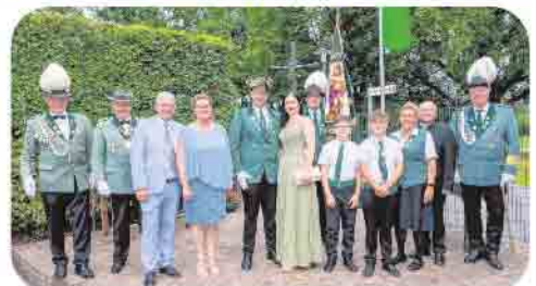
Majestäten 2024 - 2025