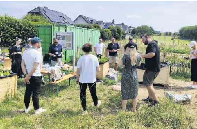
Nachhaltigkeit vor Ort erleben: Nachhaltigkeitsmanager:innen und Mitarbeitende der ZUG trafen sich am Weilerswister Gemeinschaftsacker.

Fachleute trafen sich auf dem Gemeinschaftsacker