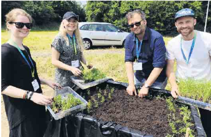
Gemeinsam bepflanzten die Nachhaltigkeitsmanager:innen ein neu angelegtes Hochbeet.