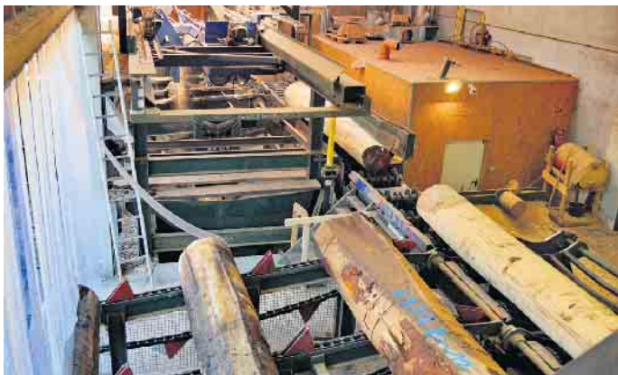
Furnierbäume bei der Verarbeitung.

Zülpich. Mit Furnier lassen sich kreative und individuelle Projekte aller Art verwirklichen. Die Basis dafür bilden speziell ausgesuchte Bäume, die mit viel Know-how zu dem edlen und natürlichen Material verarbeitet werden. Nur sehr wenige der gut 40.000 auf der Erde vorkommenden Holzarten lassen sich zu hochwertigem Furnier verarbeiten. „Rund 140 Arten kommen für die Herstellung in Frage und innerhalb dieser Arten gibt es nur wenige Exemplare, die mit innerer Schönheit punkten und sich damit für die Produktion von Furnieren eignen“, so der Forstwirt und Vorsitzende der Initiative Furnier + Natur (IFN), Axel Groh. Notwendig ist unter anderem ein ebenermäßiger Wuchs und der Stamm muss für eine perfekte Verarbeitung möglichst rund und kerzengerade sein. „Auch ein gleichmäßiges Rindenbild ist wich-