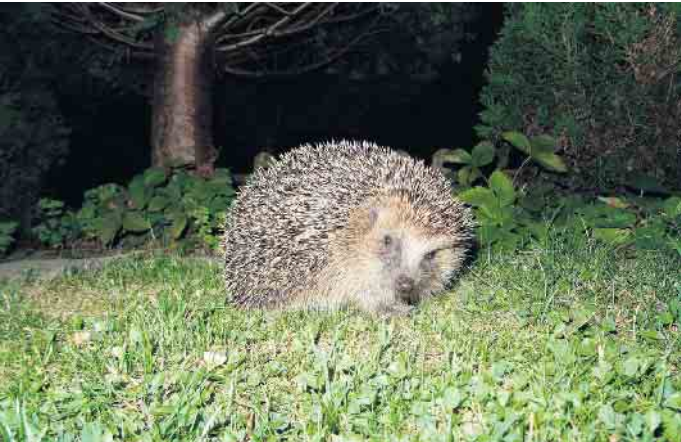
Igel sind dämmerungs- und nachtaktive Wildtiere für die nächtlich aktive Mähroboter eine große Gefahr bedeuten.

Appell an Gartenbesitzer: Tagsüber mähen, Wildtiere schützen