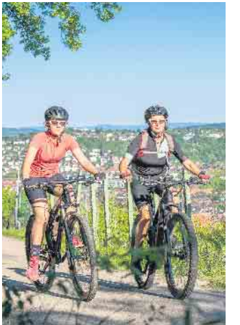
Im Jahr 2021 wurden in Deutschland zwei Millionen neue E-Bikes verkauft. Auch bei ihnen ist es wichtig, dass sie optimal auf die Nutzerinnen und Nutzer eingestellt sind.

messen und beraten“, rät der Experte. Unter www.die-sattelkompetenz.de gibt es ein bundesweites Verzeichnis der Fachhändler und Sanitätshäuser, die diesen Service anbieten. Diese stellen nicht nur neue Räder ein, auch mit einem gebrauchten Bike kann man das Fachgeschäft aufsuchen. (DJD)