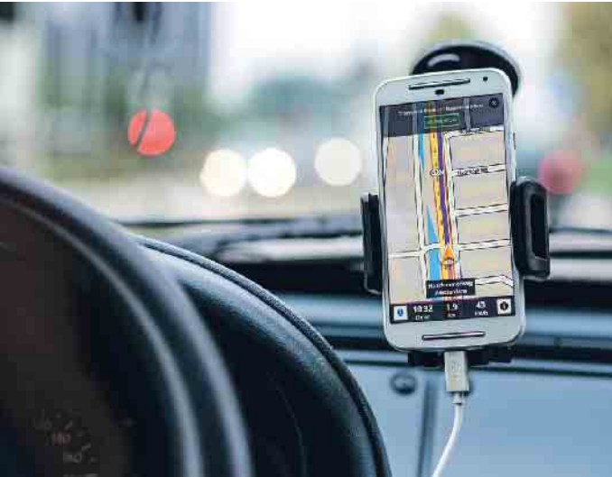
Immer mehr Menschen fühlen sich mit der Bedienung der Navigation überfordert.

Die integrierten Bildschirme für das Navigationssystem werden in Fahrzeugen immer größer. Statt nur die optimale Route vorzuschlagen, bieten sie ein komplettes Entertainmentsystem. Immer mehr Menschen fühlen sich mit der Bedienung überfordert. In einer Testreihe stellte die Dekra im kürzlich veröffentlichten Verkehrssicherheitsreport fest, dass die Probanden bei einem Fahrzeug mit Touchscreen im Durchschnitt deutlich mehr Zeit benötigten, um verschiedene Funktionen einzustellen, als im Vergleich bei einem Auto mit Knöpfen und Schaltern. Aus diesem Grund beleuchtet der ACE, Europas Mobilitätsbegleiter, die rechtliche Lage für die Verwendung von Navigationssystemen im Auto, auf dem Motorrad und dem Fahrrad. Dass die Nutzung des Handys am Steuer hierzulande verboten ist, ist inzwischen weithin bekannt. Doch wie verhält es sich mit überdimensionierten Touchscreens, die eher einem Tablet