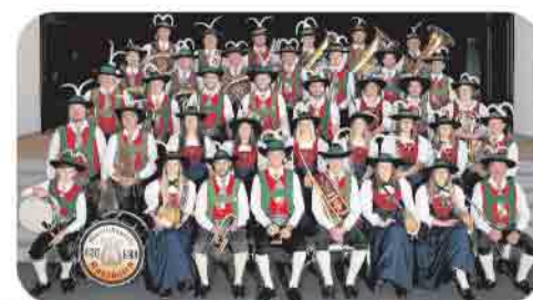
Musikkapelle Karrösten / Tirol