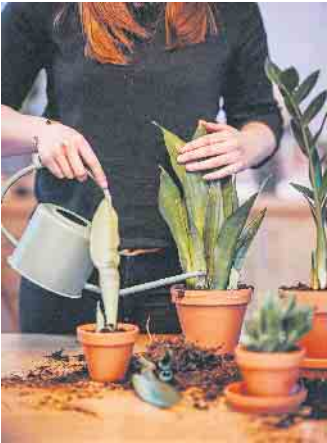
Beim Neupflanzen oder Umtopfen machen es sich Pflanzenfreunde mit hochwertigen Erden einfacher. Damit erhält das Grün direkt die richtigen Nährstoffe.

Ob für die Küche, das Homeoffice oder den Flur: Robuste und pflegeleichte Vertreter aus der Pflanzenwelt verschönern unterschiedlichste Bereiche in der Wohnung, ohne dabei viel Arbeit zu verursachen. Die Glücksfeder zum Beispiel wird ihrem Namen gerecht, denn sie macht auch Pflanzenfreunde mit wenig Erfahrung glücklich: Sie braucht nur wenig Wasser und gedeiht überall bei Zimmertemperatur. Während es das Einblatt eher schattig, mit stets leicht feuchter Pflanzenerde mag, bevorzugt der Bogenhanf eher helle und sonnige Plätzchen. Zu den pflegeleichten Pflanzen, die quasi eine Wachstumsgarantie aufweisen, gehören ebenso Klassiker wie die kräftig rankende Efeutute oder der Gummibaum. Wichtig ist in jedem Fall eine gute, lockere Erde, damit die Wurzeln dauerhaft Luft bekommen. Gleichzeitig sollte die Erde genügend Wasser speichern