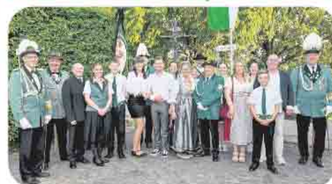
Majestäten 2023 - 2024