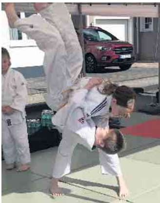
Großer Hüftwurf, O-Goshi, aus der Bewegung heraus.

Die Judoka des Judoclub Weilerswist haben den Gästen des Weilerswist Süd Festes ihren Sport näher gebracht. Jeder der wollte konnte auf der Matte ein Gefühl für unseren Sport bekommen, Tipps zum richtigen Fallen inklusive. Um 17.30 Uhr gab es dann eine Vorführung, bei der der Ablauf vom Angrüßen, den Fallübungen, über die Würfe und Haltegriffe, bis hin zum Stand- und Bodenrandori, gezeigt wurde. Wer das Gesehene mal selbst ausprobieren möchte und Interesse an unserem Sport gefunden hat, ist herzlich zu