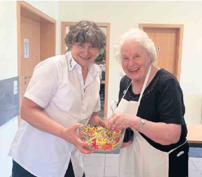
(WK) Mit einem herrlichen Kaiserwetter begann die AWO Weilerswist e. V. am Samstag, 11. Mai,