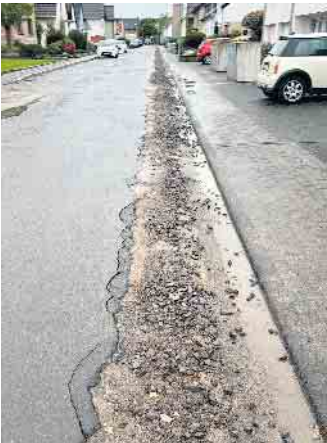
Die Zwischenverfüllung ist katastrophal.

Betroffene Bürger:innen sind aufgerufen, sich zu melden