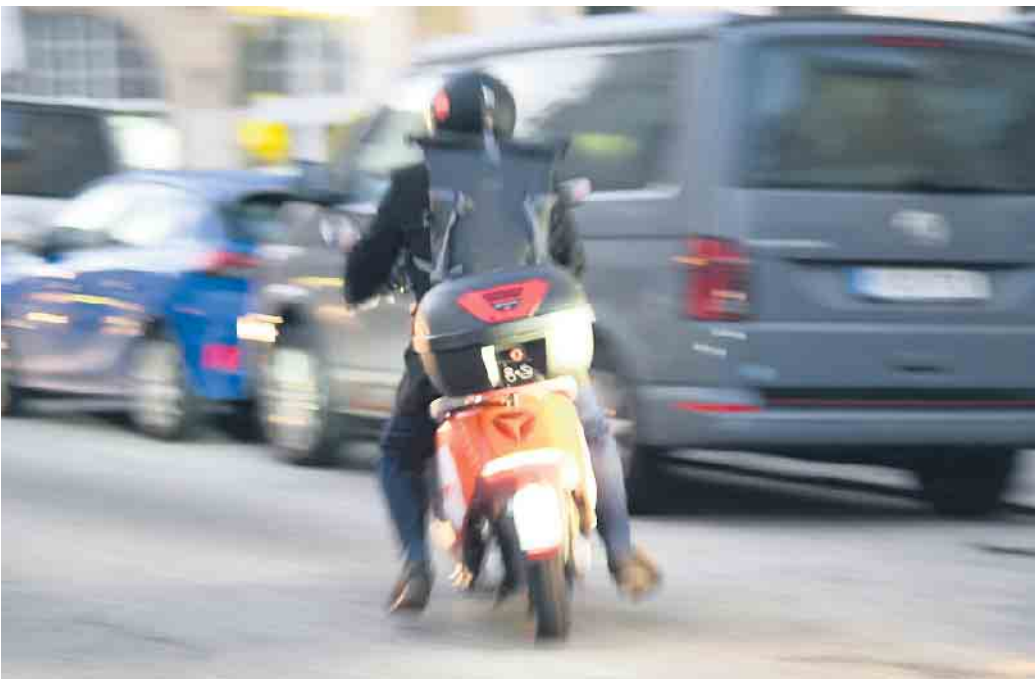
Kurvenfahren sollte man auf den Roller schon können.