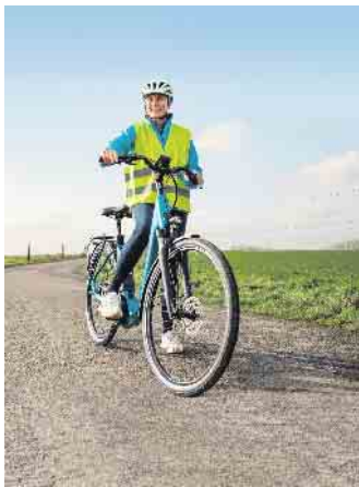
Pedelecs sind zu einer wichtigen Form der privaten Mobilität geworden, eine Kampagne will zu mehr Sicherheit auf den Elektrofahrrädern beitragen.

Mit der zunehmenden Verbreitung von Elektrofahrrädern stiegen in den vergangenen Jahren auch die Unfallzahlen: Im Jahr 2021 verunglückten laut Statistischem Bundesamt 17.045 Menschen auf einem Pedelec, 131 davon tödlich. Bezogen auf 1.000 Pedelec-Unfälle mit Personenschaden kamen im Jahr 2021 durchschnittlich 7,6 Fahrende ums Leben, bei einem herkömmlichen Fahrrad waren es 3,5. Auch in der aktuellen Umfrage schätzt mehr