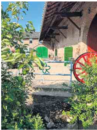
In Inneren des Kulturhofes

(WK) Der Kulturhof Velbrück hat in diesem Jahr einiges zu bieten. Hervorzuheben sind die mundart-