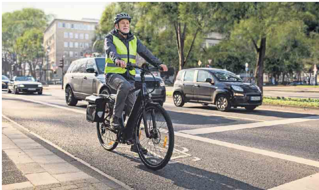
Die bundesweite Kampagne „Tour de Freude - sicher unterwegs mit dem Pedelec“ will Unfällen mit dem Pedelec vorbeugen.

Bundesweite Kampagne will Unfällen mit Elektrofahrrädern vorbeugen