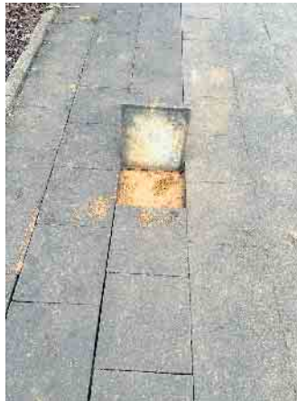
Es grenzt an Zauberei: ein „theoretisches“ Mörtelbett ganz ohne Zement.

Beschwerdemitteilungen: „Mehr als die Hälfte meiner Arbeitszeit verbringe ich seitdem mit der Sichtung und Beanstandung der Aufbrüche, die unsachgemäß verschlossen wurden. Als absehbar war, dass weitere Schäden hinzukommen, stoppte Martin Reichwaldt, Fachbereichsleiter Planen und Bauen, vorerst die Glasfaserverlegung: „Der Gemeinde ist es nicht erlaubt, den Firmen zu verbieten, Glasfaser zu verlegen. Sie ist ganz im Gegenteil verpflichtet, jedem der Glasfaser verlegen möchte, zu erlauben, dies auch zu tun. Die Gemeinde hat nur Einfluss darauf, dass baurechtliche Vorgaben eingehalten werden.