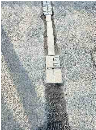
So sieht „Tetris“ im Straßenbau aus.