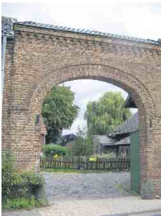
Eingang zum Kulturhof Velbrück in Metternich