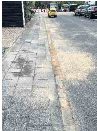
Auch das ist leider Alltag: Die Baustelle wurde alles andere als sauber hinterlassen.

Nur deshalb konnten wir eine Vereinbarung mit den Firmen und dem Kreis treffen, dass nun zuerst einmal alle vorhandenen Aufbrüche sachgerecht verschlossen werden.“ Alle Bürger:innen werden gebeten, vorhandene Schäden bei der Gemeinde zu melden. Dazu sagt Stephan Havenith: „Ich bin wirklich viel unterwegs, aber es ist nur dann zu schaffen, wenn alle an einem Strang ziehen. Deshalb bitte ich alle betroffenen Bürgerinnen und Bürger vorhandene Mängel bei der Gemeinde zu melden.“ Einen kleinen Lichtblick in Sachen Straßenschäden gibt es für