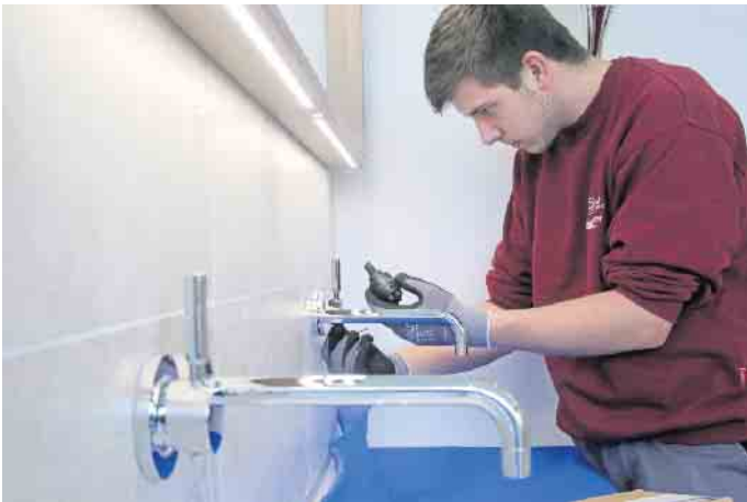
Berufsbilder in der SHK-Branche sind vielseitig und bieten sehr gute Entwicklungsperspektiven.

SHK-Betriebe bieten vielfältige Aus- und Weiterbildungsmöglichkeiten