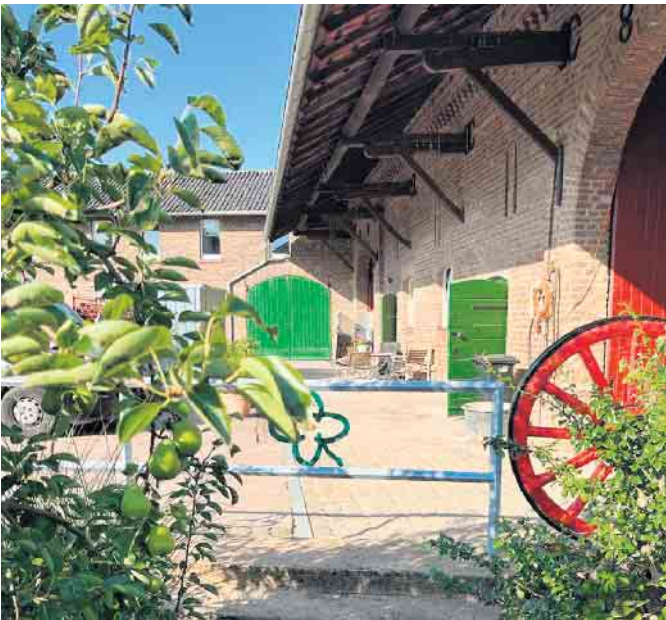
In Inneren des Kulturhofes