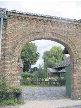
Eingang zum Kulturhof Velbrück in Metternich