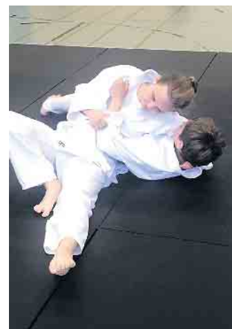
Haltegriff (Kesa-gatame) nach Wurftechnik links (O-soto-otoshi).

Ab sofort dürfen und müssen sie den weiß-gelben Gürtel (8. Kyu) tragen.