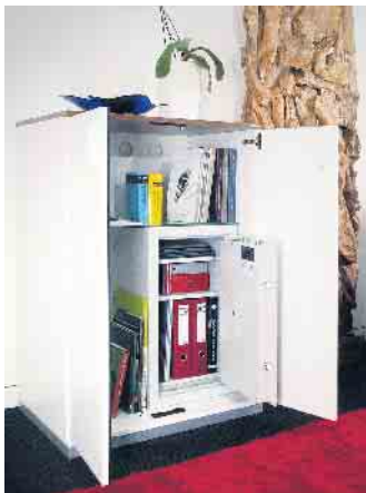
Schutz für alle Fälle: Wertschränke sind der passende Aufbewahrungsort für Schmuck, Uhren und Bargeld, aber auch für wichtige Dokumente.

vier- bis achtstelligen Code geöffnet werden. Alternativ lässt sich der Zugang mit dem persönlichen Fingerabdruck regeln, dafür eignen sich biometrische Verschlusssysteme. Beispielsweise unter www.hartmann-tresore.de gibt es einen Überblick zu den verschiedenen technischen Lösungen und weitere Tipps rund um den Kauf eines Wertschranks. Der klassische Look eines Tresors muss heute übrigens nicht mehr sein. Möbeltresore lassen sich unauffällig in Einbauschränke oder Sideboards integrieren. Alternativ sind auch Möbel erhältlich, die den Wertschrank komplett umrahmen und sich somit harmonisch in das Wohnumfeld einfügen. (djd)