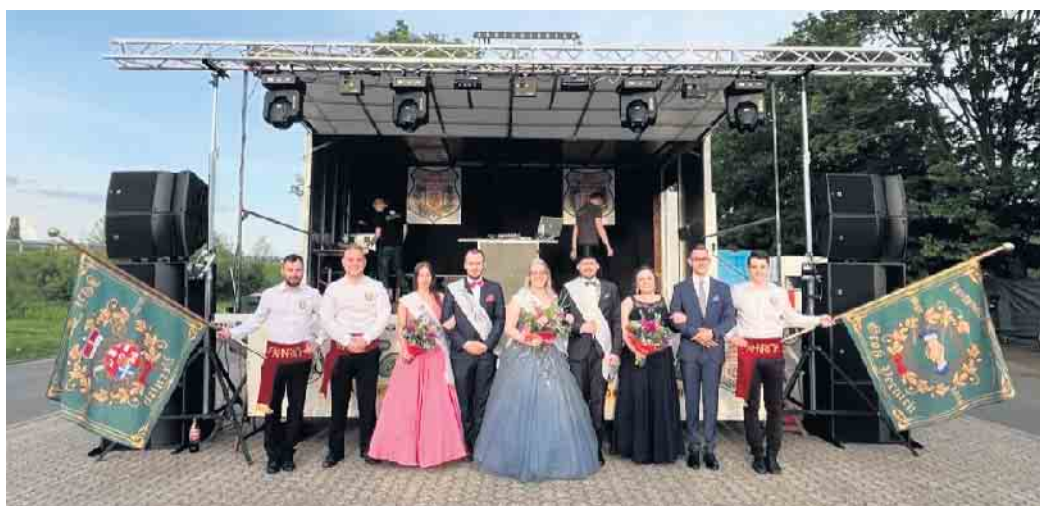
Das diesjährige Maipaar

Neben dem traditionellen Tanz in den Mai veranstaltet der JGV in diesem Jahr ein zweitägiges Junggesellenfest , am 26. und 27. Juli im Festzelt am Schützenplatz Vernich (am Klarenhof 100).