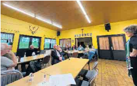
Im Schützenhaus in Lommersum fand die Veranstaltung „Auf ein Kölsch...“ für die Bewohner von Lommersum und Bodenheim statt.

wurde sich auf das gemeindeeigene Grundstück ortsauswärts Richtung Niederberg auf der Niederberger Straße geeinigt. Seitens der Verwaltung wird die Flächennutzungsplan-Änderung beantragt, um Planungs- und Baurecht zu bekommen. Die Dimensionierung des Feuerwehrgerätehauses wird festgelegt, wenn die Bedarfe aus dem Brandschutzbedarfsplan abgeleitet werden können. Die Grundschule in Lommersum platzt aus allen Nähten. Deshalb ist ein Erweiterungsbau notwendig. Die Bauvoranfrage beim Kreis wurde