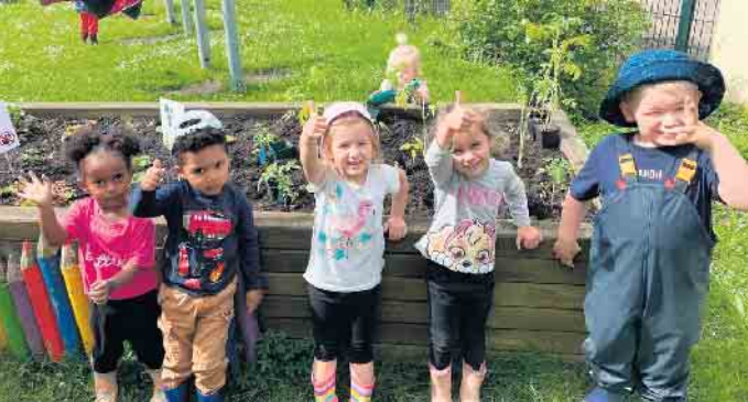
Essbare Gemeinde Weilerswist trifft Kita Spatzennest: Schnell wurden die Schaufeln geholt und die Gießkannen bereitgestellt. Gemeinsam legten die Spatzen Hand an und schon waren die Tomaten gepflanzt

Vor rund vier Jahren wurde der Förderverein „Essbare Gemeinde Weilerswist“ aus der Taufe gehoben. Entstanden ist die Idee im Rahmen des Leader-Projektes „Natürlich Dorf“. Der Förderverein hat sich das Thema Nachhaltigkeit auf die Fahnen geschrieben. Eines seiner Ziele ist es, Kulturlflächen im Ort, beispielsweise mit Obst und Gemüse zu bepflanzen. Das Thema „Essbare Gemeinde“ bezieht sich übrigens nicht nur auf Essen für Menschen, sondern auch auf Tiere und Insekten. Natürlich möchte man auch Lebensräume für Tiere schaffen und so