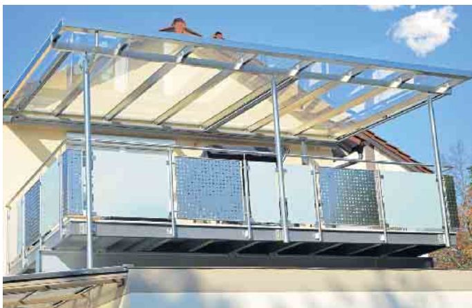
Terrassendächer sind vielseitig einsetzbar und bieten das besondere Etwas.

Wohnraum nutzen zu können, müssen die gesetzlichen Anforderungen bezüglich Wärmedämmung erfüllt sein - und damit ist auch das richtige Glas ganz besonders wichtig. Die Seitenwände sollten aus mindestens Zweifach-Wärmdämmglas bestehen, besser ist Dreifachglas. „Dreifachglas bietet eine noch bessere Wärmedämmung, was Sommer wie Winter für angenehme Temperaturen sorgt“, so der Hauptgeschäftsführer. „Im Dach ist Verbundsicherheitsglas vorgeschrieben - entweder als monolithisches