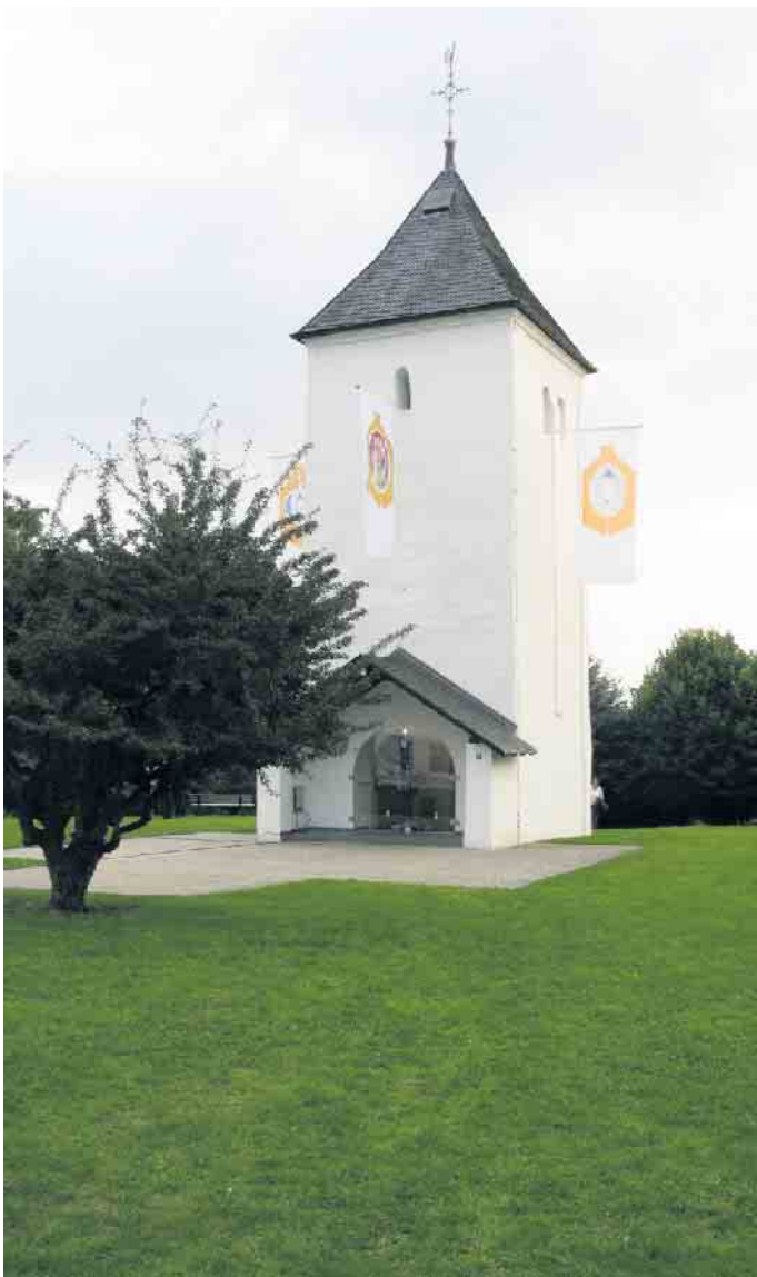
Der Swister Turm - Wahrzeichen für Weilerswist

Ab 13 Uhr startet das Unterhaltungsprogramm mit einem musikalischen Auftritt vom Wiede Duett. Ferner tritt der Tambourcorps Edelweiss und zusammen den „Dudelsackspieler“ auf. Auch die Dozenten - Band der Musikschule erfreut die Besucher mit einem „Mit-Sing-Konzert“ sowie ebenso unser Chanty-Chor. Zum Abschluss tritt Charlene de Verre auf. Am Abend dann ab 19 Uhr kann