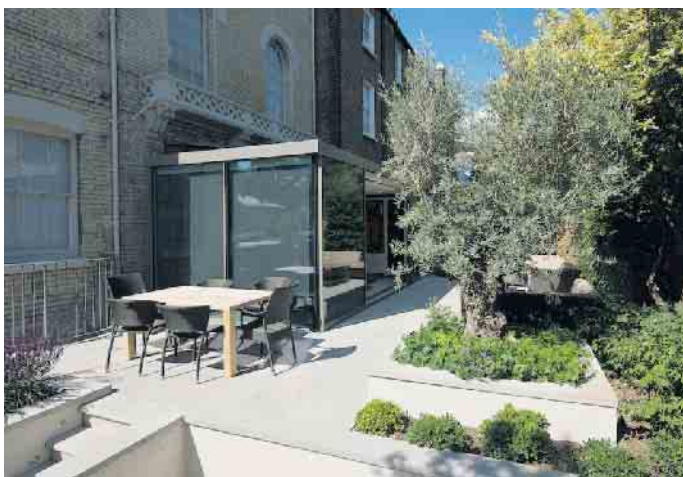
Ein Wintergarten macht auch außen einen guten Eindruck.

Glas oder als untere Scheibe eines Isolierglases.“ Und ob Terrassendach oder Wintergarten: Sorgen bezüglich der Reinigung des Glases sind generell unbegründet. Sowohl ein Terrassendach als auch die äußere Verglasung des Wintergartens kann mit natürlich reinigendem Glas ausgeführt werden: Regen und Sonne übernehmen dann die Säuberung. „Ab und zu den Wasserschlauch benutzen reicht schon und die Oberfläche erstrahlt in neuem Glanz“, erklärt Grönegras abschließend. (BF/FS)