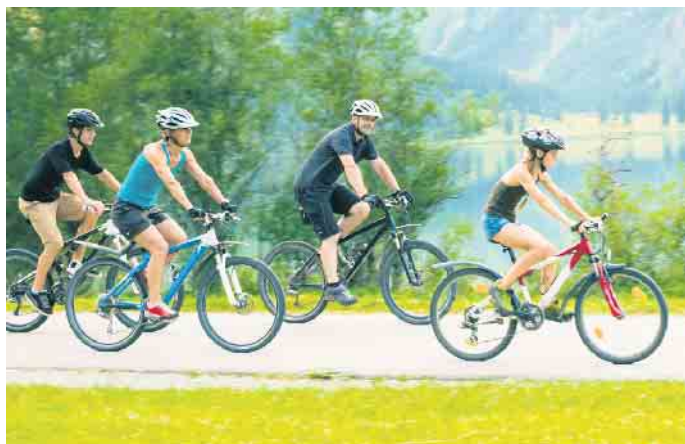
Wer komfortabel längere Strecken unterwegs sein möchte, sollte auf die richtige Einstellung des Bikes besonders achten.

gibt es ein bundesweites Verzeichnis der Fachhändler und Sanitätshäuser, die den Service des Bikefittings anbieten. Sie stellen nicht nur neue Räder optimal ein, auch mit einem gebrauchten Rad kann man das Fachgeschäft aufsuchen. (DJD)