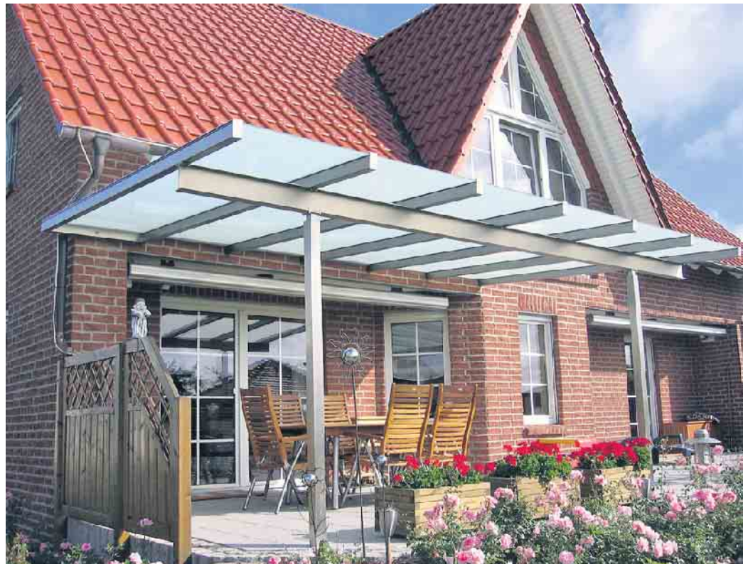
Terrassendächer sind vielseitig einsetzbar und bieten das besondere Etwas.