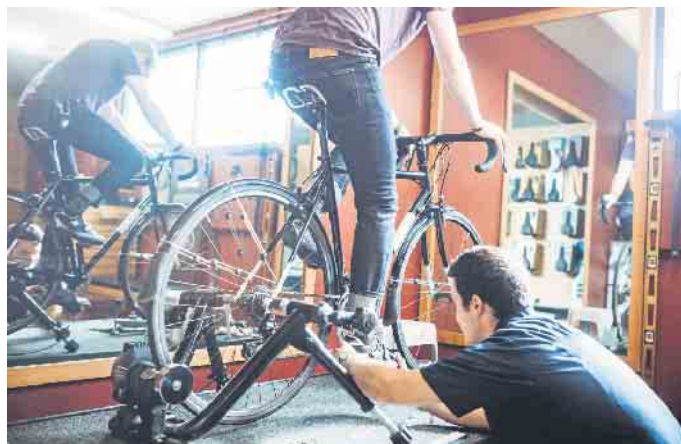
Bikefitting: Das Fahrrad wird im Fachhandel millimetergenau auf die Bedürfnisse und physiologischen Voraussetzungen des Fahrers oder der Fahrerin eingestellt.