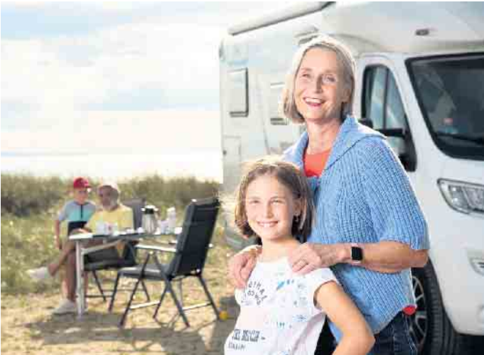
Campingurlaub ist in allen Generationen angesagt. Bevor es losgeht, sollte allerdings der Versicherungsschutz für das Wohnmobil überprüft werden.