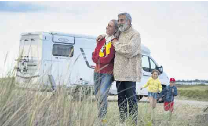
Wohnmobile benötigen wie jedes andere Kfz eine Haftpflichtversicherung, diese übernimmt aber lediglich Unfallschäden am fremden Fahrzeug. Darüber hinaus sollte eine Teilkasko- oder Vollkaskoversicherung abgeschlossen werden.