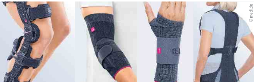
Direktversorgung von Bandagen und Orthesen