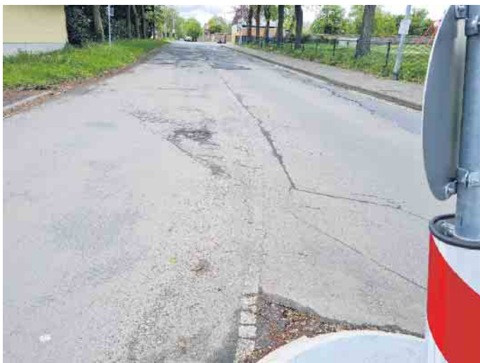
Es ist beschlossene Sache: Die Löwener Straße wird saniert.

arbeiten der K3, Rheinbacher Straße, Ortsdurchfahrt Müggenghausen, wird der K3-Abschnitt zwischen Vernich und Schwarzmaar saniert. Ebenfalls fest steht die Sanierung der K11, von der Kreuzung L181/Walramstraße in Lommersum bis zum Ortseingang Bodenheim. Baubeginn ist voraussichtlich 2026. Seitens Straßen-NRW läuft in Kooperation mit dem Ertfverband und der Gemeinde Weilerswist in Ottenheim und Derkum zunächst die Sanierung der Nebenstraßen und dann die Sanierung der L194 im laufenden Jahr. Zur Sanierung der L210 liegen keine Informationen vor. Dann war da noch der sehr kontrovers diskutierte Antrag der UWW, auf dem Friedhof Metternich anonyme Urnengräber und ein Kolumbarium einzurichten. Ein Kolumbarium beherbergt Ni-