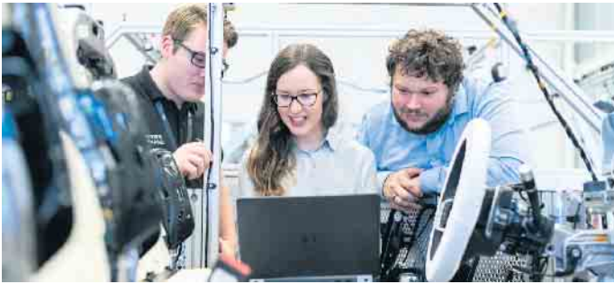
Berufe, die im Automotive-Bereich forschen, entwickeln oder testen, haben oft mit dem Rohstoff Kupfer oder mit Kupferlegierungen zu tun.

schonende Verfahren entwickelt werden. Gefragt sind natürlich auch Kaufleute im Vertrieb und der Kundenberatung. Einige Studiengänge wie die Angewandten Materialwissenschaften können als dualer Bildungsweg mit der Kombination aus Berufsausbildung im Unternehmen und Studium an einer Uni oder FH absolviert werden. (DJD)