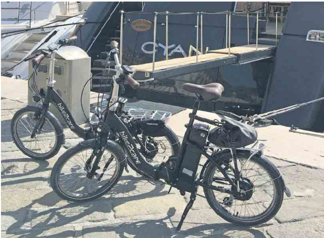
Im Urlaub sind die kompakten E-Falträder ideale Begleiter.

Auch in den deutschen Großstädten sind E-Falträder die perfekte Lösung für mobile Städter. Im Gegensatz zu Fahrrädern dürfen sie in Bussen und Bahnen überall mitgenommen werden, ein Extraticket ist ebenfalls nicht nötig. Zu Stoßzeiten sind öffentliche Verkehrsmittel ohnehin meist so voll, dass Fahrräder nur mit Mühe transportiert werden können, für das Faltrad findet man immer ein Plätzchen. Das gilt allerdings auch nur dann, wenn das Faltrad qualitativ hochwertig ist und entsprechend schnell und bequem klein gemacht werden kann. (djd)