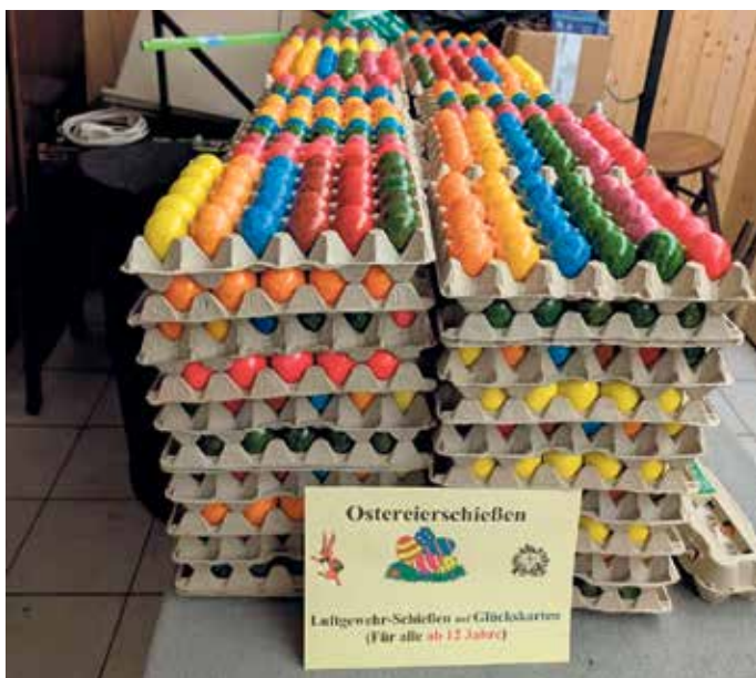
4.000 Eier wollen geschossen werden

Tolle Resonanz zum Ostereierschießen der Schützen