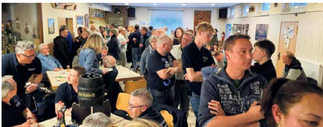
Großer Andrang am Schießstand

Die Eierversorgung für Ostern war damit auf jeden Fall für alle gesichert, wenn nicht in Teilen sogar übererfüllt. Für die Unter-Zwölfjährigen wurde dieses Jahr wieder ein Schnupperschießen mit dem Lasergewehr veranstaltet, in dem man eigentlich wie mit richtigen Gewehren schießt aber halt nur mit der sicheren Lasertechnik. Somit war für wirklich jeden die Möglichkeit gegeben, seine Schießkünste unter Beweis zu stellen. Dieses Jahr gab es noch für die besten drei Schützen einen Zusatzpreis, und zwar Freikarten für die Oldie Nacht in Kall, die von der Hilfsgruppe Eifel im Sommer durchgeführt wird. Die Schützen freuten sich auch sehr über die Teilnahme von einigen Dorfvereinen/Organisationen (Feuerwehr, Tambourcorps, DVV, JGV, Badminton Club, SSV, CDU usw.) und der befreundeten Schützenbruderschaft aus Vernich, die an diesem Abend ebenfalls gekommen waren.