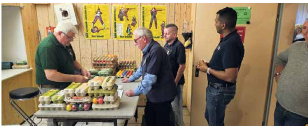
Verteilung der Eier

So wurde es für viele ein kurzweiliger unterhaltsamer Abend, mit vielen bekannten Gesichtern. Immer wieder finden auch neue Besucher den Weg zu den Schützen, um sich ein Bild vom Verein vor Ort machen zu können. Auch hier muss man sagen, wer noch nie mit dem Luftgewehr geschossen hat, wird sicher nicht ohne Ostereier nach Hause gehen. Damit auch niemand hungrig blieb, gab es natürlich auch wieder leckeres zu Essen. Zu Kartoffel- und Nudelsalat gab es auch wieder warmes aus der Küche, welches von den Schützenfrauen, wie immer bestens, zubereitet worden war. Alles in allem wurde wieder ein schöner Abend verbracht. Es war schön in geselliger Runde friedlich zusammen zu feiern und einige schöne Stunden gemeinsam verbringen zu können.