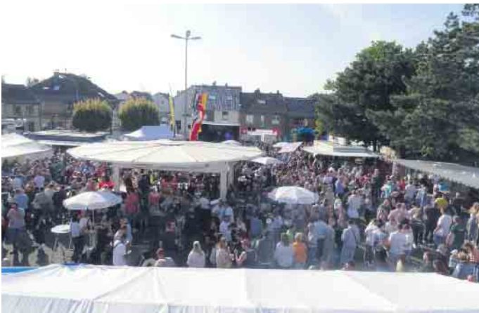
Zahlreiche Menschen suchen jedes Jahr das Feuerwehrfest in Lommersum auf, um den Vatertag zu verbringen, so wie hier im Jahr 2023.

Am 9. Mai startet das Fest um 9.30 Uhr zunächst mit einem Gottesdienst in der St. Pankratius-Kirche in Lommersum. Anschließend gibt es einen Festzug zum Kaiser-Wilhelm-Platz, wo dann in gewohnter Art und Weise gefeiert wird. Die Einnahmen kommen dem Förderverein der Lommersumer Löschinheit für die Gestaltung des Feuerwehrdienstes vor Ort zu Gute.