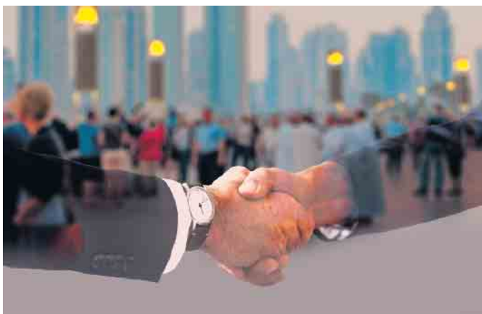
Die Interkommunale Zusammenarbeit funktioniert schon in vielen Projekten.

Beide wurden von der Bürgermeisterin in ihr Amt eingeführt und in feierlicher Form zur gesetzmäßigen und gewissenhaften Wahrnehmung ihrer Aufgaben verpflichtet.