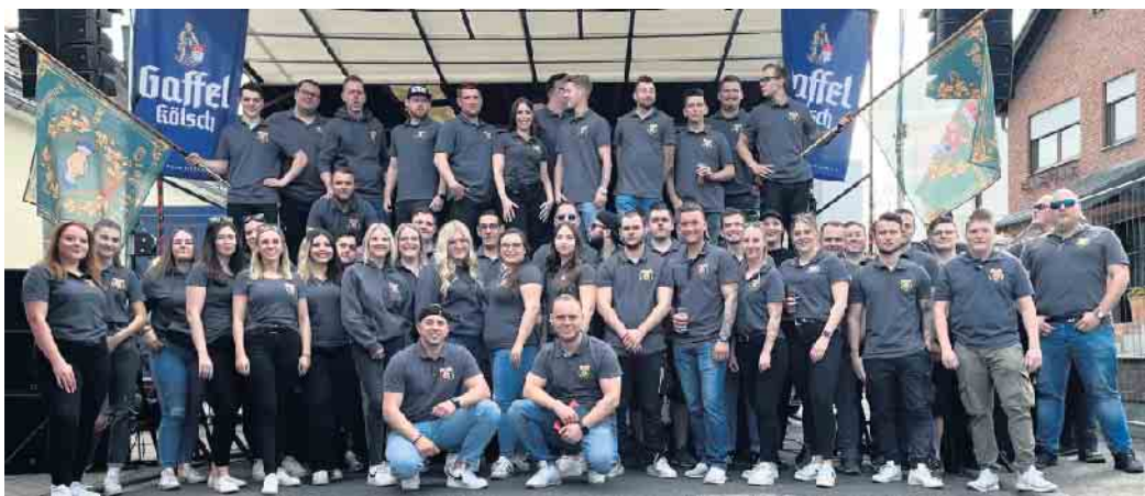
JGV „Dorfjugend“ Vernich e.V.

(WK) Der Junggesellenverein „Dorfjugend“ Vernich e.V. lädt zum traditionellen Tanz in den Mai am 30. April ein. Da es leider nicht mehr möglich ist neben der Maibaumhalterung am Spellmannsbrunne zu feiern, wird in diesem Jahr auf dem Parkplatz am Sportzentrum in Weilerswist gefeiert. Alle Interessierten, egal ob Groß oder Klein, sind herzlich dazu eingeladen sich von einem bunten Programm unterhalten zu lassen. Auch in diesem Jahr wird es wieder eine Hüpfburg für die kleinen Gäste geben. Beginn der offiziellen Veranstaltung ist 17.30 Uhr mit dem