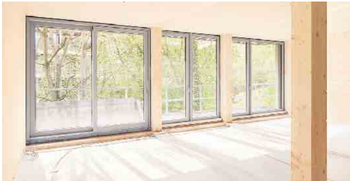
Lichtdurchflutete Räume, eingerahmt von eleganter Metall-Optik: Fensterrahmen aus einem Aluminium-Holz-Verbund bieten viele Gestaltungsmöglichkeiten gerade für großformatige Fenster.