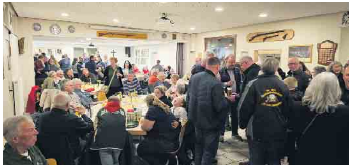
Volles Haus beim Ostereier-Schießen

man davon ausgehen, dass der Bedarf für das Osterfest in vielen Fällen mehr als reichlich gedeckt gewesen sein sollte. Für die unter 12-jährigen wurde dieses Jahr erstmals ein Schnupperschießen mit dem Lasergewehr veranstaltet, in dem man wie beim Biathlon auf fünf Scheiben zielen konnte. Die Schützen freuten sich auch sehr über die Teilnahme von einigen Dorfvereinen (Feuerwehr, Tambourcorps, DVV, JGV, Badminton Club, SSV, usw.) und natürlich der befreundeten Schützenbruderschaft aus Vernich, die an diesem Abend ebenfalls gekommen waren. Des Weiteren gab es auch wieder die Möglichkeit mit den Gästen ins Gespräch zu kommen und alte Bekanntschaften zu vertiefen. Immer wieder finden auch neue Besucher den Weg zu den Schützen, um sich ein Bild vom Verein vor Ort machen zu können.