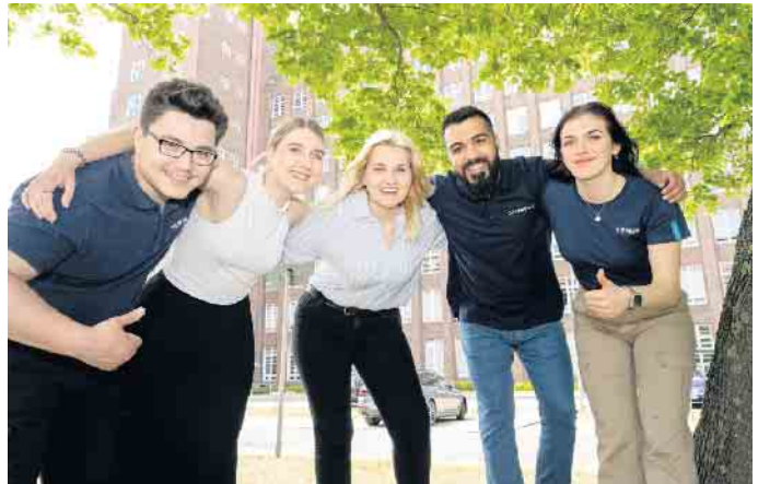
Junge Karrierestarter sollten ihr späteres Betätigungsfeld nach persönlichen Neigungen wählen.