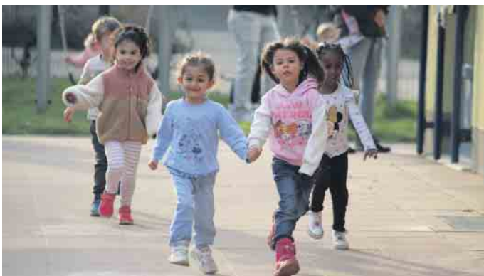
Die „Spatzen“ in Großvernich flitzen beim Sponsorenlauf für ihr großes Jubiläum

Bevor es losging, brachte das Team des Spatzennestes die kleinen Athleten mit einem Profi-Warm-up auf Betriebstemperatur