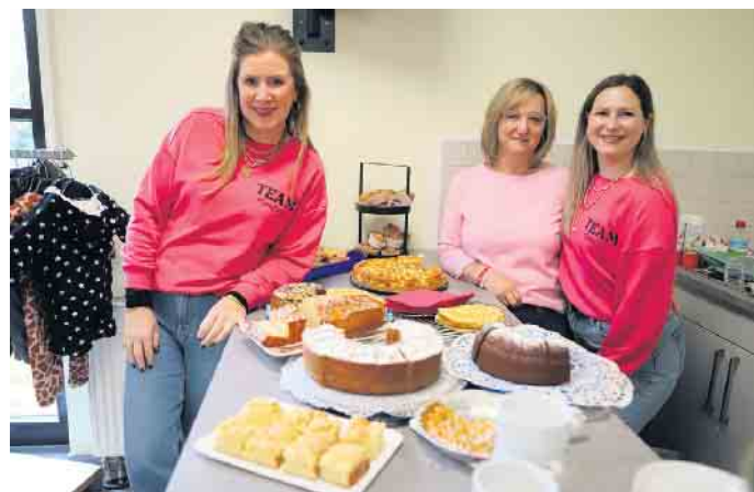
Wer nach dem Shoppen und Flanieren eine Pause brauchte, konnte sich in der Cafeteria stärken