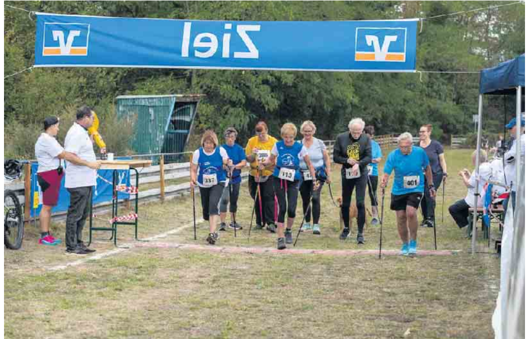
Start der Walker beim Villelauf.