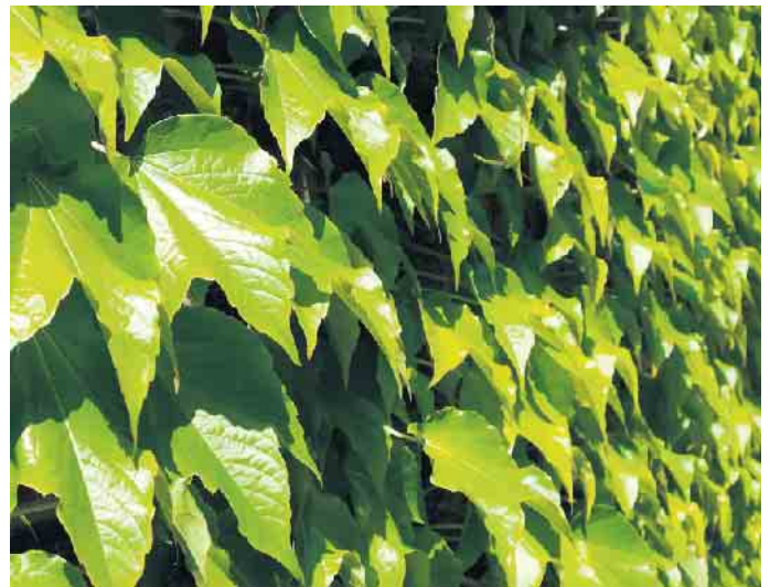
Die klassische Art der Fassadenbegrünung: Wilder Wein wächst an einer Hauswand.

Grundsätzlich gibt es zwei Formen: Kletterpflanzen, die vom Boden aus an Rankhilfen nach oben wachsen, und modulare Sys-