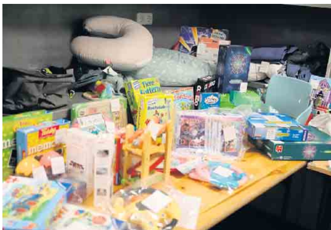
Rund 40 Aussteller hatten im Vorfeld rund 5.000 Teile abgegeben

„Großvernich 2“ (Spatzennest). Nach dem Erfolg der Premiere ist eines sicher: Der „Mama und Mini Basar“ soll zur festen Institution werden. Geplant ist eine Fortführung jeweils im Frühjahr und im Herbst. FH