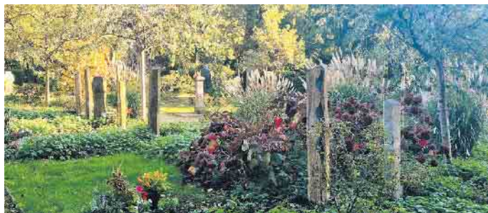
Friedhöfe als grüne Oasen in der Stadt - Gemeinschaftsgrabanlage Nordfriedhof Düsseldorf.

Immer mehr Menschen legen großen Wert auf Umwelt- und Klimaschutz. Diese Haltung spiegelt sich auch in der Bestattungskultur wider. Viele junge wie ältere Menschen gestalten ihr Leben und ihr Verhalten im Alltag nachhaltig und umweltverträglich, und so möchten sie auch über den Tod hinaus ihren ökologischen Fußabdruck minimieren. Sie stellen sich die Frage, wie man bereits zu Lebzeiten Einfluss auf die eigene Bestattung nehmen könnte. Eine Möglichkeit bietet die Bestattungsvorsorge.