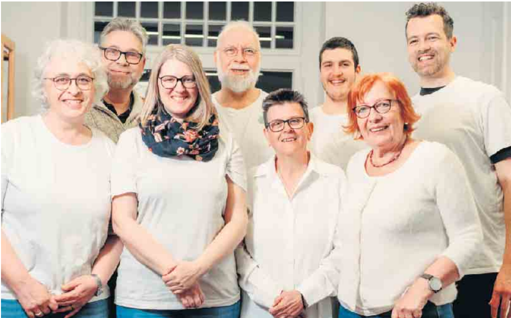
WeilerswistZero freut sich auf viele Teilnehmende am 11. April.

11. April entwickeln wir gemeinsam konkrete Bilder einer wünschenswerten Zukunft für Weilerswist - eine Zukunft, in der wir gerne leben würden.