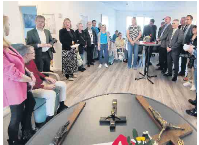
Zahlreiche geladene Gäste aus Politik, Kirche, Sozialwesen und der Weilerswister Gemeinschaft nahmen an der feierlichen Einweihung der Tagespflege St. Silvia und des Quartiersbüros teil.