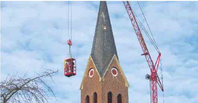
Spektakuläre Montage in windiger Höhe.