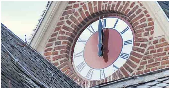
Blick von unten auf eine der vier Uhren des Turms. Fortsetzung S. 5