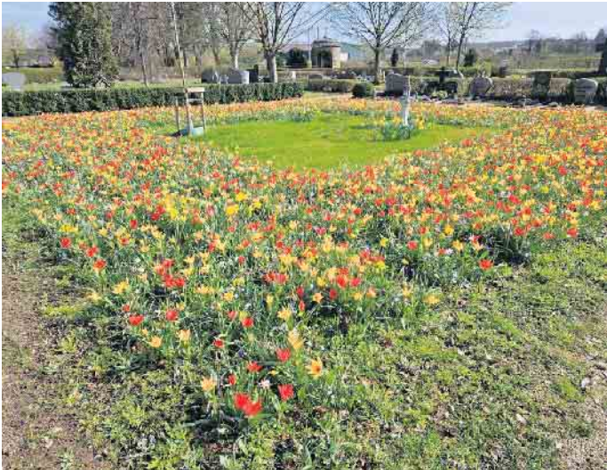
Friedhof Weilerswist am 25.03.24, Foto: Regina de Vries

Wer mit offenen Augen durch Weilerswist geht, wird wunder-