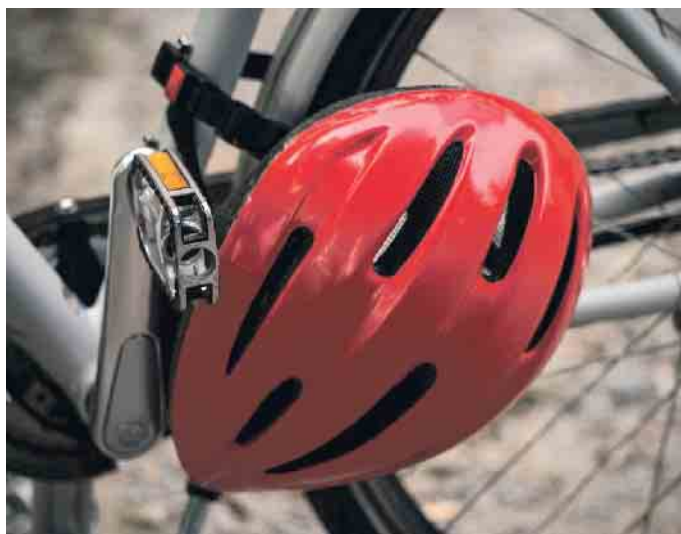
Das Tragen eines Fahrradhelms bietet Radlern den bestmöglichen Schutz.

Einstellungsmöglichkeiten wie Kopf- oder Kinnriemen. Sie sollten festsitzen, aber kein beeinträchtigendes Gefühl geben. Vor allem Stirn, Schläfen und Hinterkopf sollten vom Helm gut geschützt sein. Eine Mindestanforderung ist das CE-Kennzeichen, das vom Hersteller selbst vergeben wird und angibt, dass der Helm den geltenden Anforderungen genügt. Wer sich nicht allein auf die Selbsterklärung des Herstellers verlassen will, sollte beim Kauf auf das GS-Zeichen und das TÜV-Prüfzeichen achten. Sie zeigen, dass der Helm von einer unabhängigen Prüfstelle geprüft wurde, die Europäische Norm EN 1078 erfüllt und auch die Herstellung überwacht wird. (mid/ak-o)