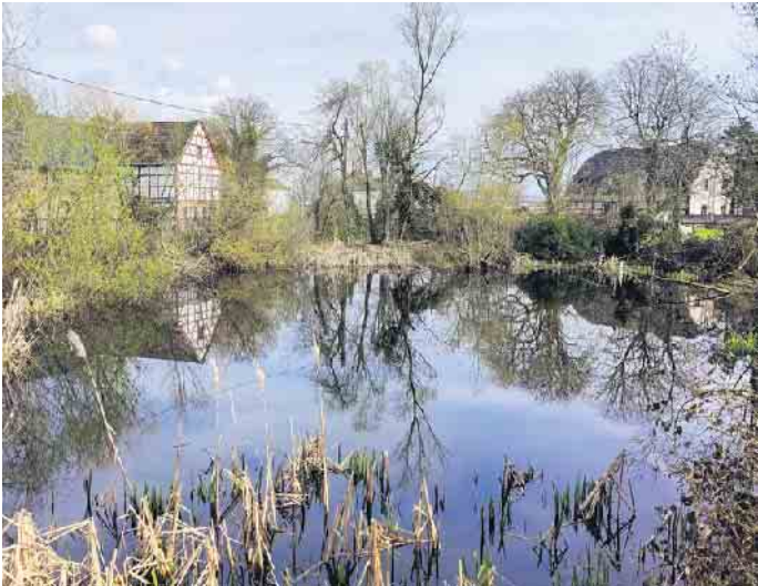
Weiher in Schwarzmaar am 19.03.24