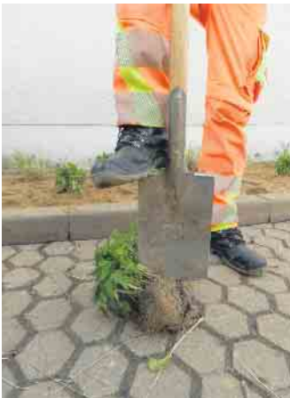
Stauden teilen ist einfach!

beiden inzwischen aus eigener Erfahrung, wie viel pflegeleichter ein solches Beet ist. Viele Mitarbeiter des Bauhofs sind inzwischen richtige Staudenfans. Wer Interesse an Pflanzlisten hat, kann diese gerne beim Grünflächenamt anfragen.