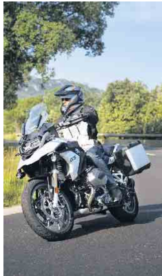
Für genug Grip sollten Biker den Reifenfülldruck alle 14 Tage über-prüfen.

Reifen von 15 Zentimetern ein-halten, um Beschädigungen zu vermeiden. (djd)