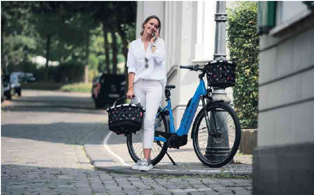
Der Einkaufskorb mit 24 Litern Stauraum kommt per Klicksystem ans Fahrrad.

Im Fachhandel gibt es eine Vielzahl an Fahrradtaschen, -boxen