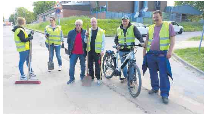
Mitglieder der Dorfgemeinschaft beim Aufbruch zur Müllsammelaktion 2025

Der Container wird auf dem kleinen Parkplatz gegenüber dem Sportlerheim des SSV Eintracht Lommersum aufgestellt.