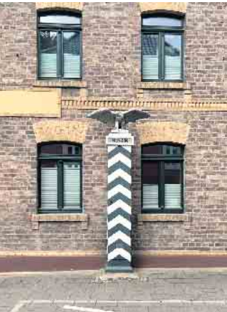
Vor der ehemaligen Gaststätte Wermerskirchen erstrahlt die historische Benzinzapfsäule in neuem Glanz.

Hans W. Rhiem pflegt seit 43 Jahren Denkmäler