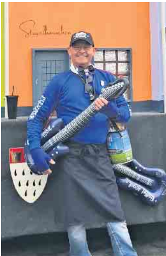
Ne jocke Autonarr