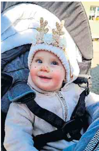
En echt kölsch Mädche am Zoch