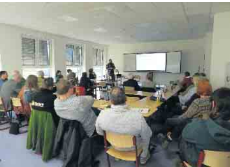
27 Teilnehmer:innen wollten den Acker-kennenlernen.