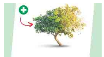
Die Gemeinde Weilerswist hat 2693 Bäume, die nun in einem Kataster erfasst sind.

Insgesamt stehen derzeit 295 offene Baumpflegemaßnahmen an. Das betrifft 259 Einzelbäume, der Rest verteilt sich auf Baum- und Strauchflächen. Mit 99 Einsätzen sind die Baumpfleger am häufigsten in Weilerswist im Einsatz. Fünf Bäume werden vermutlich Bekanntheit mit einer Art Kernspintomograph machen, um diese eingehend zu untersuchen. 32 Bäume müssen leider gefällt werden, vorwiegend