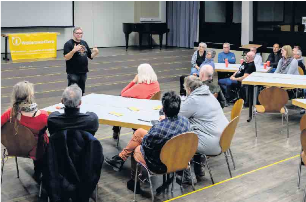
Im Workshop werden gesammelte Ideen zu Zukunftsbildern zusammengeführt.

Rund 30 engagierte Bürgerinnen und Bürger nahmen bereits an der ersten Veranstaltung teil und sprachen über eine lebenswerte Zukunft in Weilerswist. Die Diskussionen waren lebendig und produktiv; sie machten deutlich, dass viele Menschen aktiv werden möchten, aber oft nicht wissen, wo sie ansetzen sollen. Die neue Veranstaltung knüpft an diesen Austausch an und bietet Raum, Ideen weiter zu konkretisieren. Es werden verschiedene Ansätze für ein nachhaltiges Weilerswist erarbeitet - beispielsweise für klimafreundliche Mobilität, für zukunftsfähiges Bauen oder für neue Wohn- und Lebensmodelle. Der offene Austausch soll kreative Lösungen hervorbringen und Menschen zu-