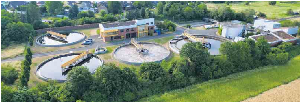
Kläranlage Weilerswist aus der Vogelperspektive

Seit 1992 rufen die Vereinten Nationen in jedem Jahr zum Weltwassertag auf. Ziel ist es, auf die Bedeutung des Wassers als Lebensgrundlage für die Menschheit aufmerksam zu machen. Aus diesem Anlass gibt der Erfverband interessierten Bürger*innen einen Tag vor dem internationalen Tag des Wassers, am 21. März einen Einblick in seine Aufgabengebiete. Geboten werden je zwei Führungen zum Thema Abwasser und Gewässer. Der Weltwassertag steht im Jahr 2025 unter dem Motto „Schutz der Gletscher“. Die Kläranlage in Weilerswist gehört zu den mittelgroßen Anlagen des Erfverbandes und reinigt das Abwasser von rund 20.000 Menschen und Gewerbebetrieben aus der Gemeinde. Mit der ebenfalls dort ansässigen Kanalmeisterei betreibt der Verband auch das Kanalnetz der Gemeinde Weilerswist, das er im Jahre 2021