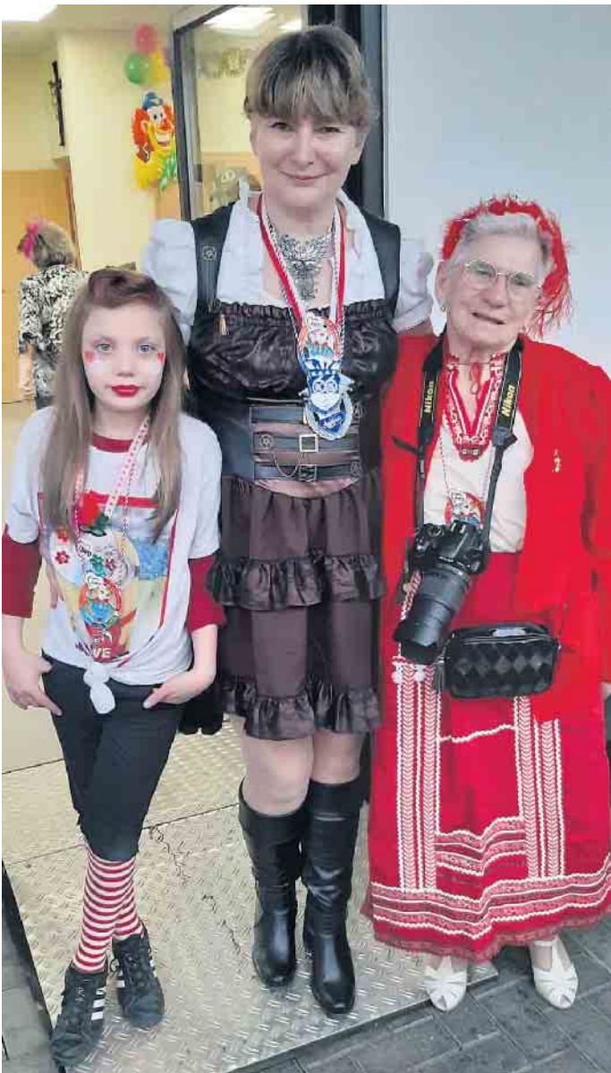
Generationen fiere Karneval