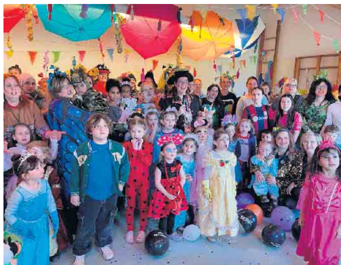
Drei Mal Spatzennest Alaaf: Es war Bunt, Spaßig und voller toller Erlebnisse