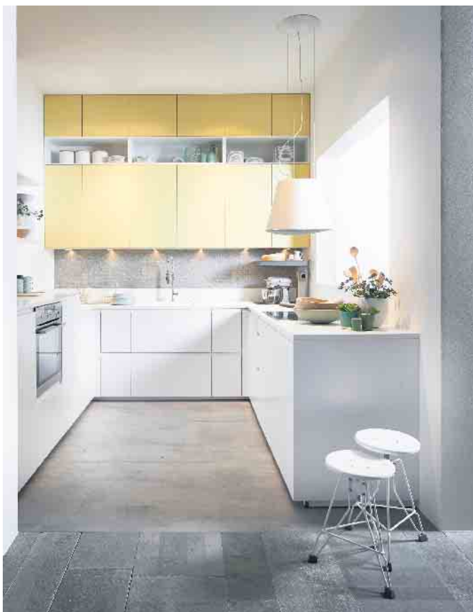
Je weniger Grundfläche zur Verfügung steht, desto mehr wird in die Höhe geplant wie bei dieser sehr ansprechenden Lösung mit reichlich Stauraum und modernen, softmatten Oberflächen in hochwertigem Echtlack.

dell in Standard-Size. Viele 45er-Modelle arbeiten zudem sehr leise, was sie auch für Appartements attraktiv macht. Damit die Tätigkeiten an der Spüle auch in kleinen und Tiny Kitchen flott und angenehm von der Hand gehen, hat die Zubehörindustrie entsprechende Modelle konzipiert: zum Beispiel schicke Einbeckenspülen.