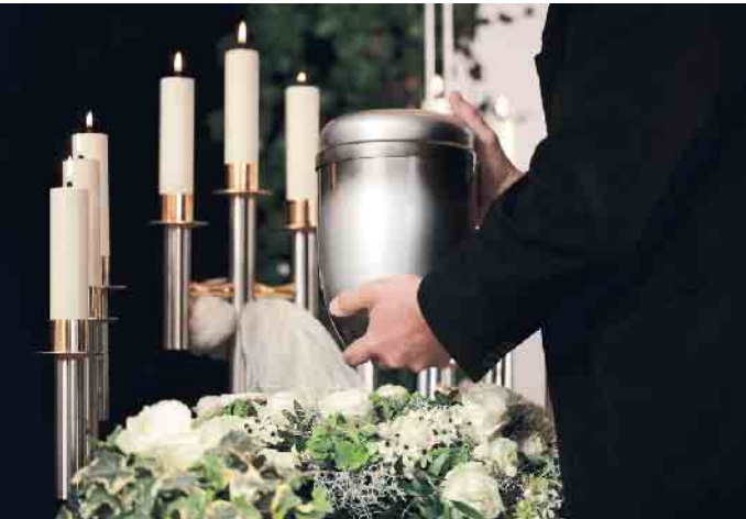
Das Markenzeichen der Bestatter ist eine eingetragene Kollektivmarke des Bundesverbandes Deutscher Bestatter e.V.

Wenn es um die Organisation einer Trauerfeier geht, ist es entscheidend, einen Bestatter zu finden, dem man vertrauen kann und der Qualität liefert. Doch wie findet man einen solchen Bestatter und woran erkennt man überhaupt einen guten Bestatter? Die Planung einer Bestattung ist ein komplexer Prozess, der viele Aspekte umfasst. Von der Organisation der Trauerfeier bis hin zur Einhaltung gesetzlicher Vorschriften gibt es viel zu bedenken. Genau dafür sind Bestatter da - sie kümmern sich um alles, damit Sie sich nicht darum sorgen müssen. Ein qualifizierter Bestatter mag auf den ersten Blick teurer erscheinen, aber Qualität hat ihren Wert. Gerade wenn es um den Verlust eines geliebten Menschen geht, ist es entscheidend, jemanden an seiner Seite zu haben, dem man vertrauen kann. Ein Bestatter mit dem Markenzeichen ist ein solcher Partner. Das Markenzeichen steht für eine unabhängige Zertifizierung des Bestattungsunternehmens und weist eine fachspezifische Qualifikation nach. Markenzeichenbestatter sind in der Region verwurzelt und kennen sich deshalb besonders gut mit den örtlichen Besonderheiten aus. Eine gelungene Bestattung ist mehr als nur eine Pflichterfüllung. Sie kann ein schöner Abschied voller Erinnerungen sein