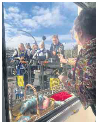
Danach überreichte sie Schlüssel, Alaaf-Herzen sowie Goldtaler aus Schokolade, um die Eroberer zu besänftigen.