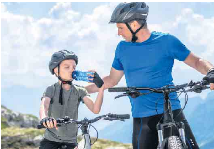
Bei Radtouren gilt es regelmäßig zu trinken, bevor der erste Durst zu spüren ist, zum Beispiel eine selbst angerührte Apfelschorle mit einer Prise Kochsalz.

Eine selbst angerührte Apfelschorle mit einer Prise Kochsalz kann hier helfen. Oder man mischt Wasser mit Salz - eine Messerspitze reicht für ein Viertel Liter Wasser aus. Damit können Radler den Elektrolytverlust durch das Schwitzen ausgleichen und verlieren nicht den Spaß am Radfahren. Am besten trinkt man alle 30 Minuten in mehreren kleinen Schlucken, damit die Flüssigkeit den Magen schnell passieren kann. Zum Zeitpunkt des Dursteintritts ist das Flüssigkeitsdefizit meist bereits zu groß. Daneben sollten Radausflügler immer einen Snack wie einen Müsliriegel mit dabei haben. Übrigens, was fürs Radfahren gilt, gilt auch für alle anderen sportlichen Aktivitäten. (DJD)