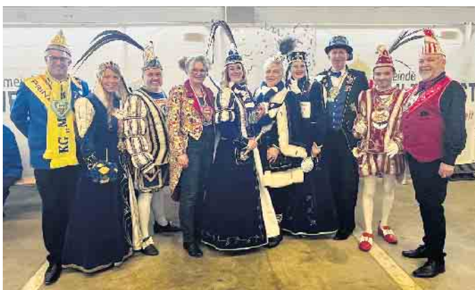
Die „vertriebene“ Bürgermeisterin lud Tollitäten und Jecken in den Bauhof zur Karnevalsfeier ein.

viel Engagement hatten die Mitarbeiter:innen der Gemeindeverwaltung die Feier vorbereitet und organisiert.