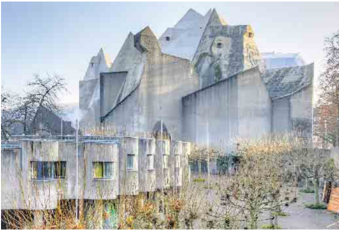
Der Dom zu Neviges.

Stiftung Denkmalschutz. Eintritt frei. Anmeldung erwünscht bei s.rodewald@velbrueck.de Ein Bauwerk aus rohem Beton, wie ein Zelt oder Kristall, mochten sich nur wenige Anfang der