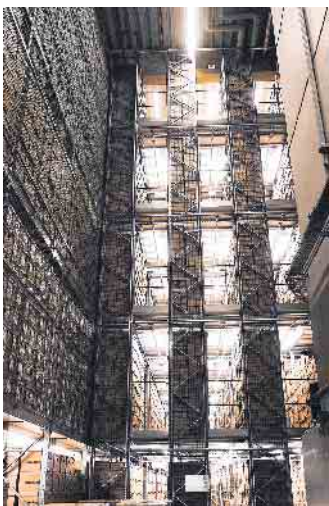
Erinnert an eine Kathedrale: Das riesige Archivdepot des Kunstlogistikers in Frechen bei Köln.