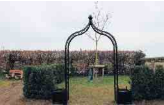
Auf dem Friedhof in Müggenhausen wurde der erste Rosenbogen aufgestellt.

Arbeiten an Sternenkinderfläche und Kindergrabstätten haben begonnen