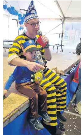
Spaß für groß und klein

Dreigestirn, Kinder Tanzgruppen, Auftritte von Kitas, Kinderanimation einer Tanzschule auf dem Trampolin und vieles mehr. Mit Waffeln, Muffins, Kaffee und anderen Getränken und herzhaften warmen Speisen, wie Burger, Pommes und Würstchen aus dem Food Liner haben wir für unsere Gäste bestens vorgesorgt. Das beheizte Festzelt steht auf der Hemmericher Str. 17 oben am Sportplatz in Metternich, neben dem Sportlerheim. Das wird ein Spaß! Die KG freut sich auf den Jecken Nachwuchs.