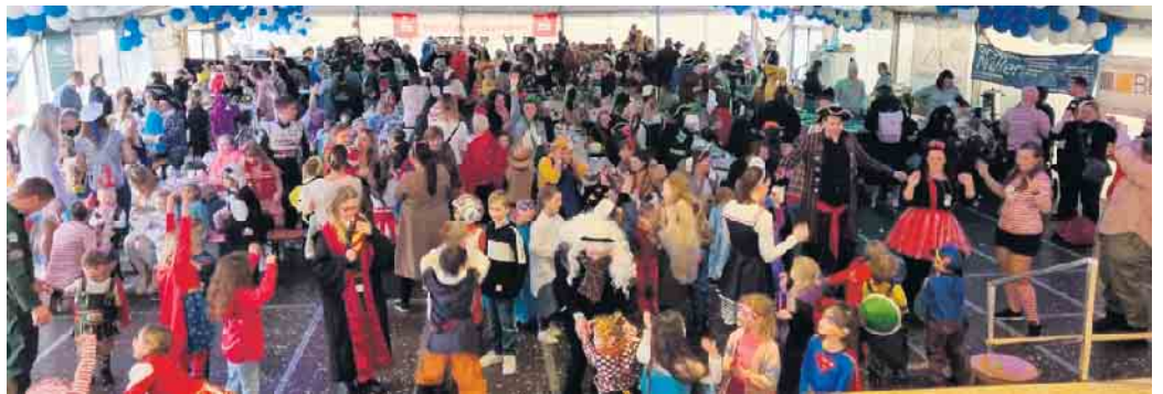
Kinder-Party im Zelt