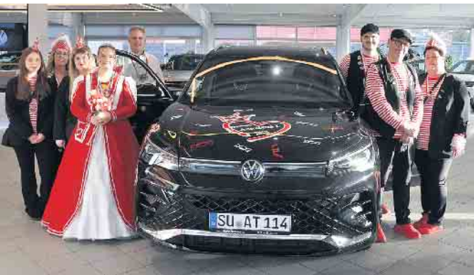
Die junge Prinzessin, ihre Eltern und Gefolge freuen sich darauf, mit dem tollen VW sicher durch die Session von Termin zu Termin zu kutschieren.