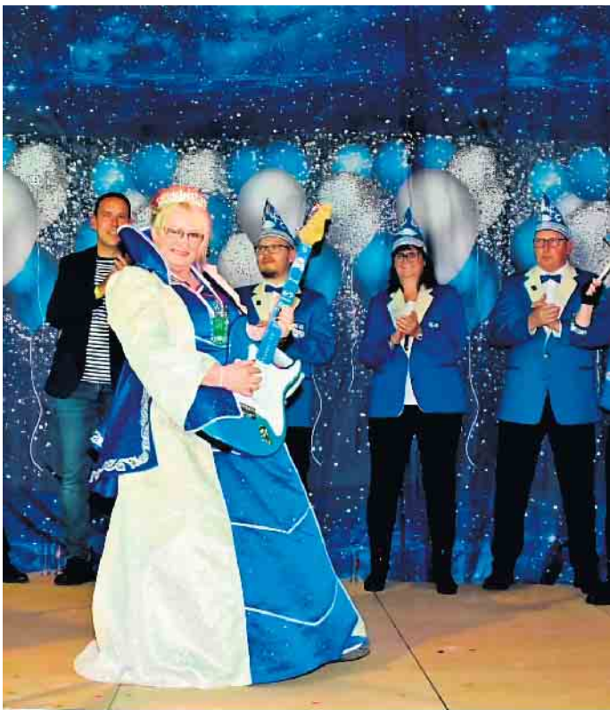
Die Prinzessin rockt den Karneval