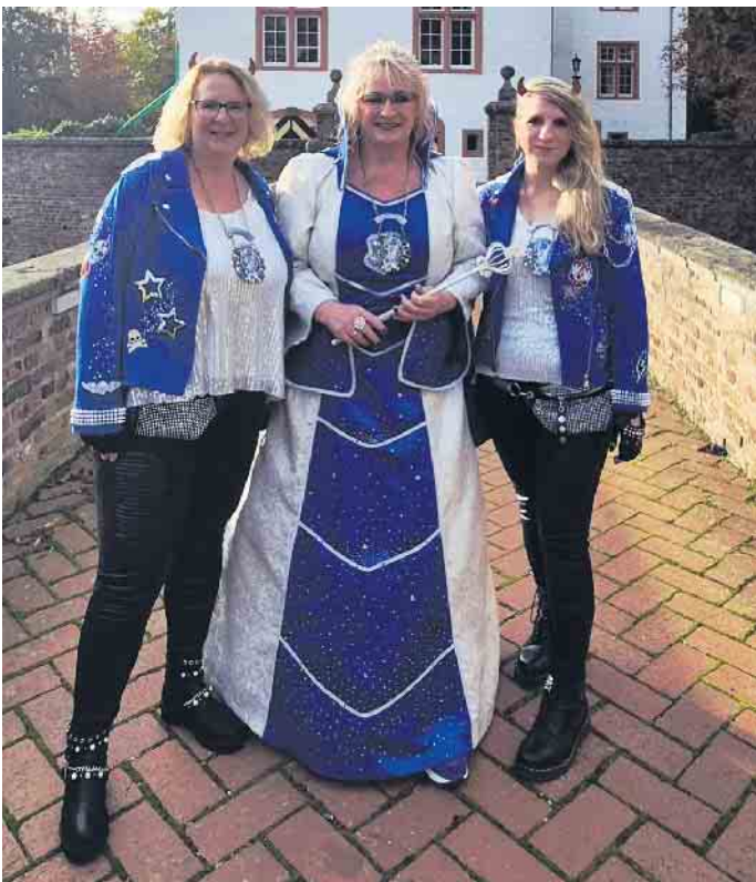
Prinzessin Iris I.